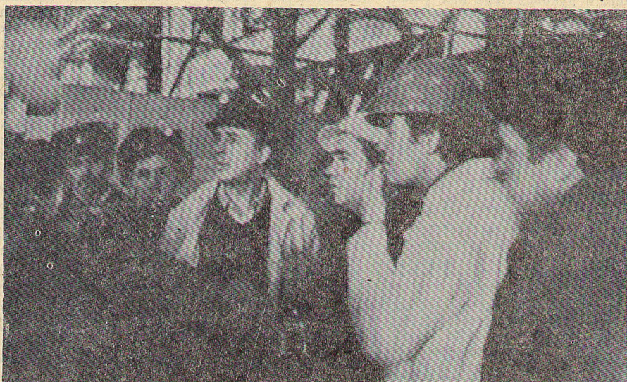
Один из самых волнующих моментов — вывод турбины на номинальные обороты.