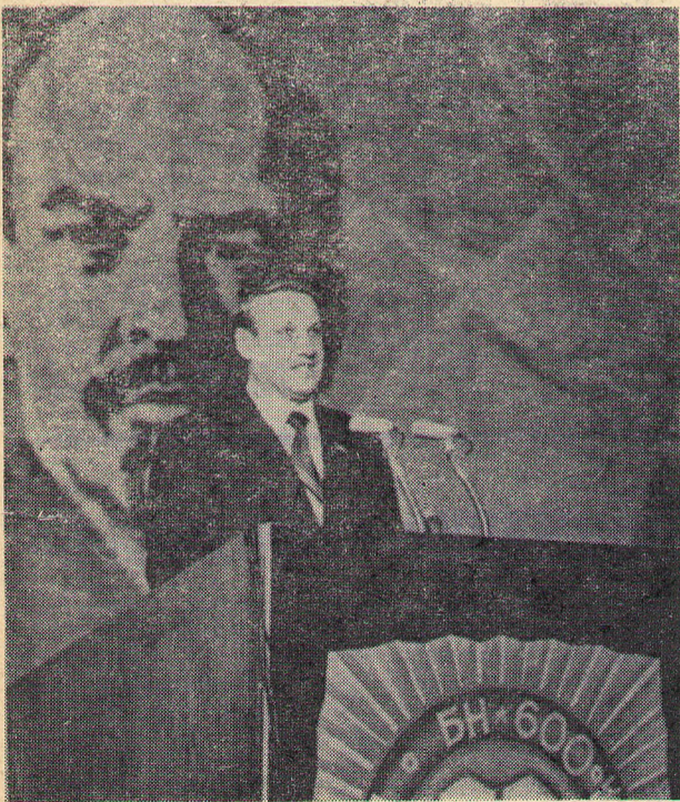
Выступает Б. Н. ЕЛЬЦИН.

После торжественного собрания состоялся праздничный концерт.