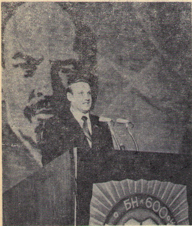
Выступает Б. Н. ЕЛЬЦИН.

После торжественного собрания состоялся праздничный концерт.