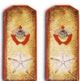
Погоны Маршала Советского Союза