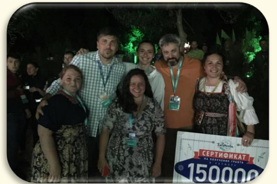
Форум «Таврида». Грант на проект «Зауральская Атлантида» 2015 г.