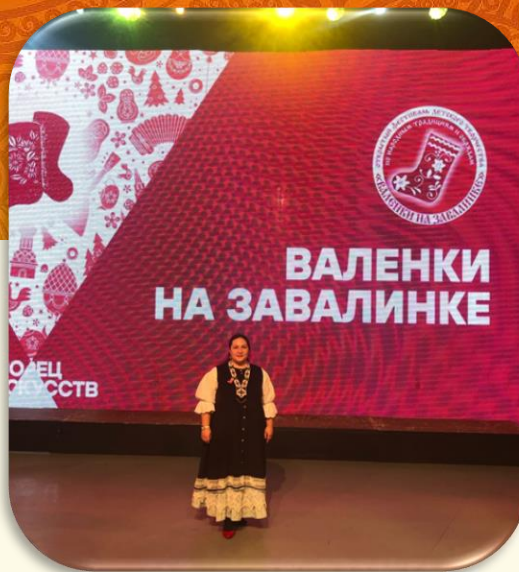
Работа в составе жюри г. Нижневартовск