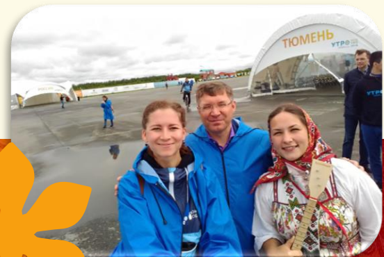
Форум «Утро-2017» с губернатором В. В. Якушевым