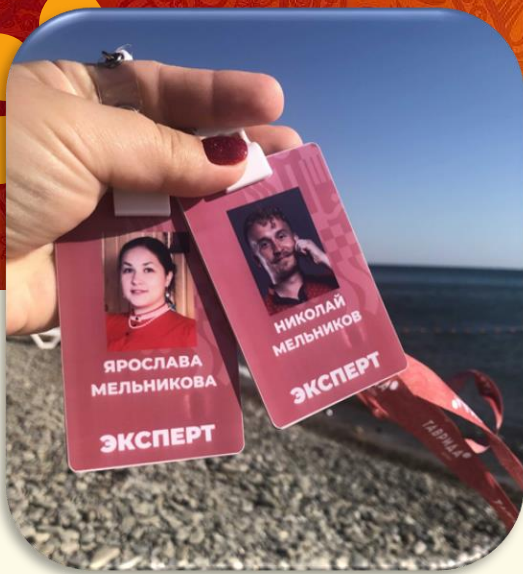
Всероссийский арт-кластер «Таврида» Крым 2020 г.