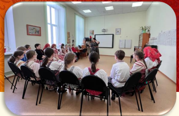
Мастер - класс в ДШИ № 2 г. Сургута