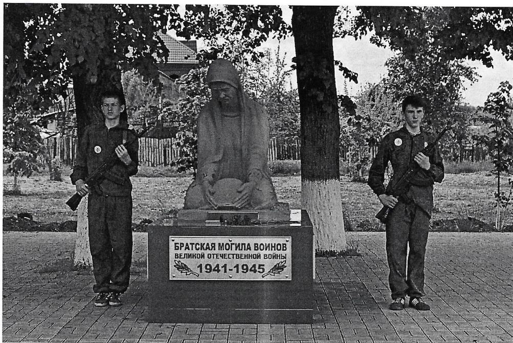
Братская могила СКОРБЯЩАЯ МАТЬ