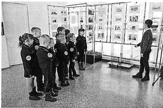
Уголок ПАМЯТИ ЛЕТЧИКОВ

К 12 июня 2017 года, на месте крушения боевого самолёта был поставлен обелиск памяти погибших лётчиков, спустя 75 лет.