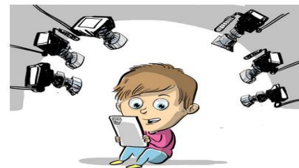
Анонимность в сети