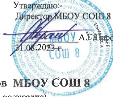
График приема пищи учащихся 1-11 классов МБОУ СОШ 8 в 2023-2024 учебном году (1 полугодие)