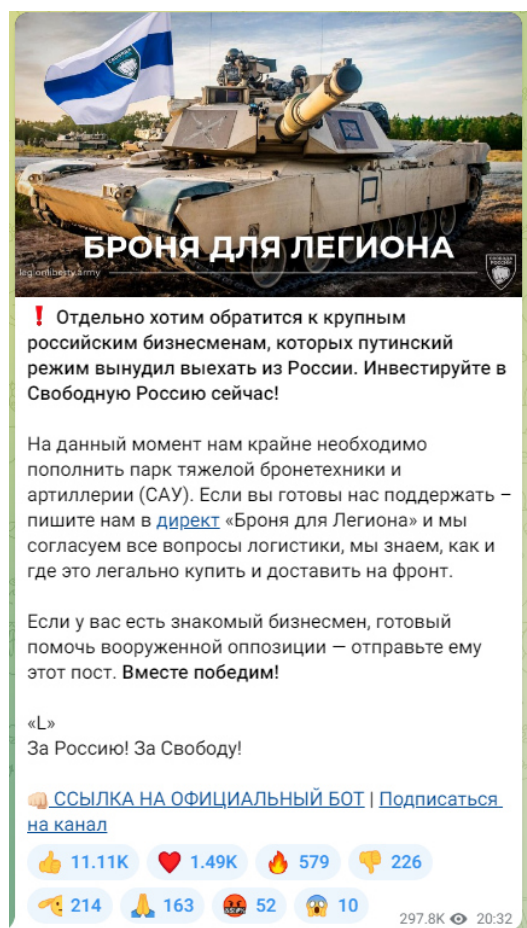
Рисунок 3 — Скриншот телеграм-канала легиона «Свобода России» с призывом к финансированию

Важно подчеркнуть, что помимо собственно пропаганды и распространения идеологии террористических организаций, а также вовлечения в деятельность террористических организаций существует еще одна угроза террористического характера — ложные сообщения о готовящемся террористическом акте. Только за 2021 год зафиксировано более 4,5 тысяч ложных сообщений о готовящихся терактах на объектах социальной инфраструктуры. Это может быть хулиганство, злой умысел, специфическое чувство юмора, желание проверить качество работы правоохранительных органов или антитеррористическую защищенность объекта и др. Во всех вышеперечисленных случаях за такой поступок придется нести уголовную ответственность. Ведь злоумышленник нарушает конструктивную деятельность общественных объектов, а правоохранителям приходится задействовать множество средств и сил, чтобы проверить объекты, которые якобы находятся под угрозой. За ложное сообщение о готовящемся теракте правонарушитель может быть наказан либо штрафами – от 200 тысяч рублей и до двух миллионов рублей, либо лишением свободы – от одного года до 10 лет. Ответственность за данный вид правонарушения наступает с 14 лет (статья 207 УК РФ «Заведомо ложное сообщение о акте терроризма»).