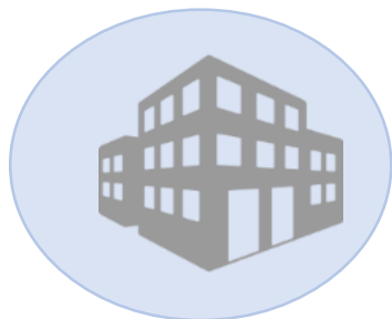
Схема проведения ОГЭ

Прибытие в пункт проведения экзамена (до 9.00 часов)