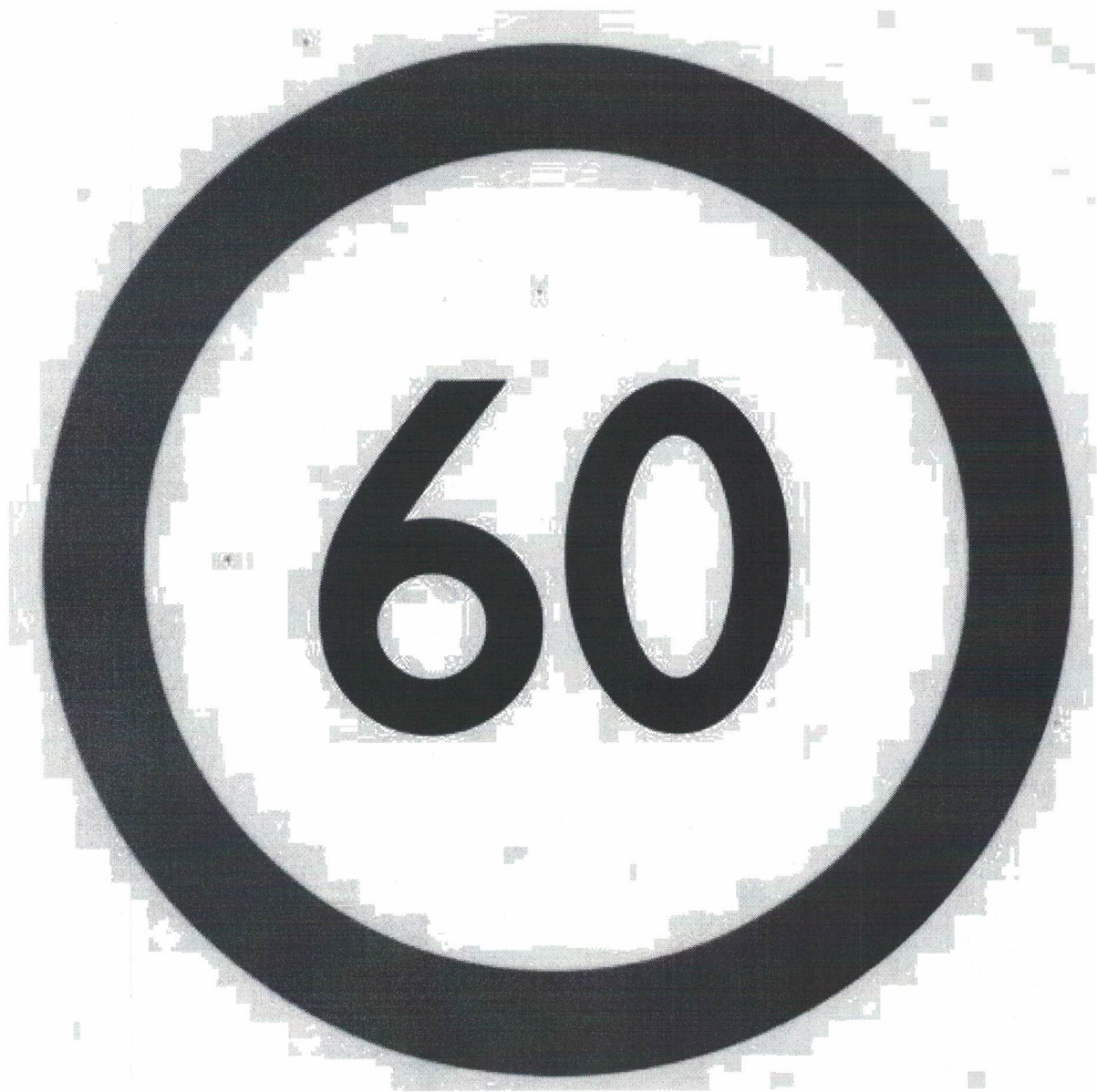
Опознавательный знак «Ограничение скорости»

«Ограничение скорости» - уменьшенное цветное изображение дорожного знака 3.24 с указанием разрешенной скорости (диаметр знака - не менее 160 мм, ширина каймы - 1/10 диаметра) - на задней стороне кузова, слева у механических транспортных средств, осуществляющих организованные перевозки групп детей.