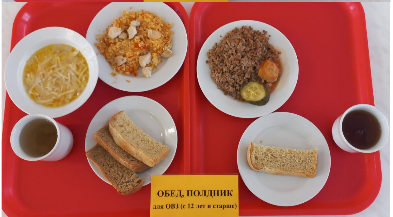
ОБЕД, ПОЛДНИК для ОВЗ (с 12 лет и старше)