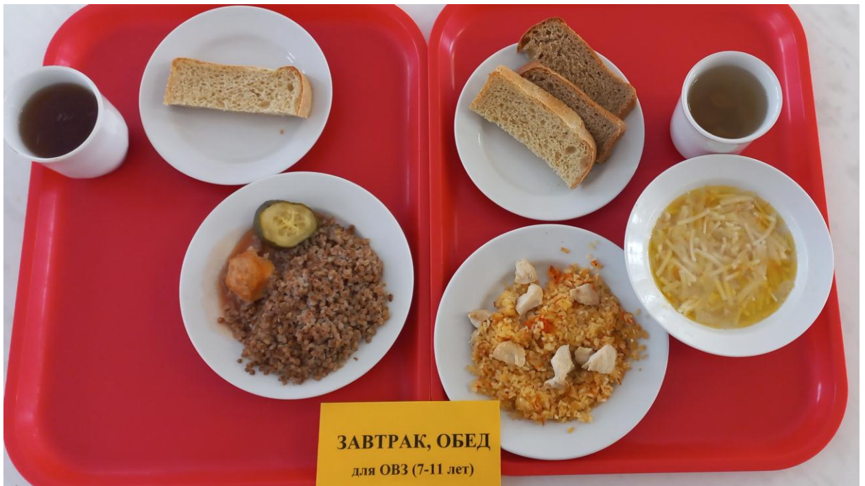
ЗАВТРАК, ОБЕД для ОВЗ (7-11 лет)