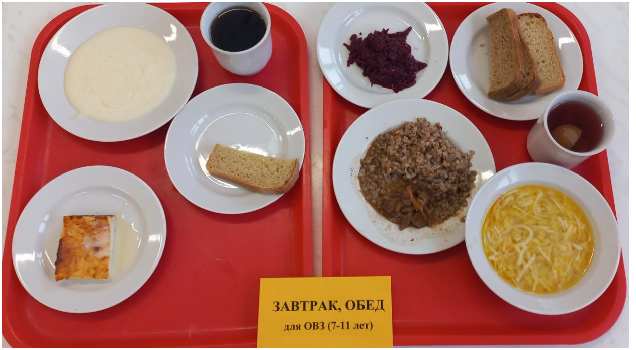
ЗАВТРАК, ОБЕД для ОВЗ (7-11 лет)