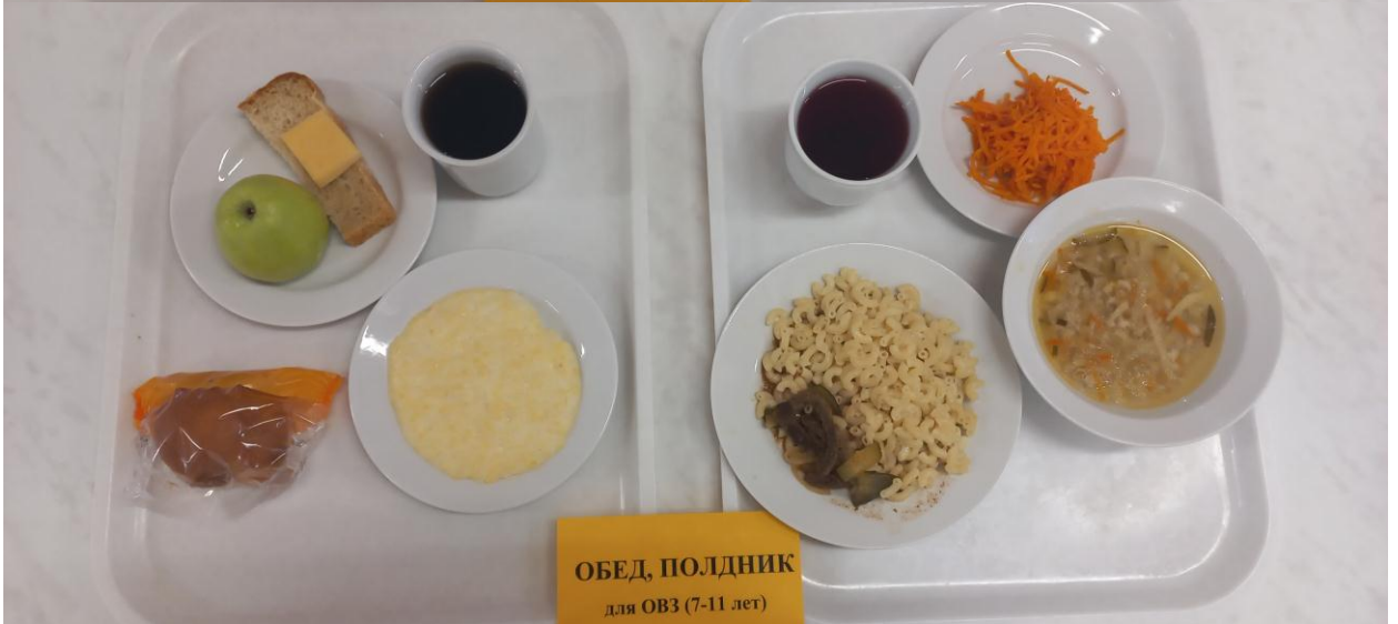
ОБЕД, ПОЛДНИК для ОВЗ (7-11 лет)