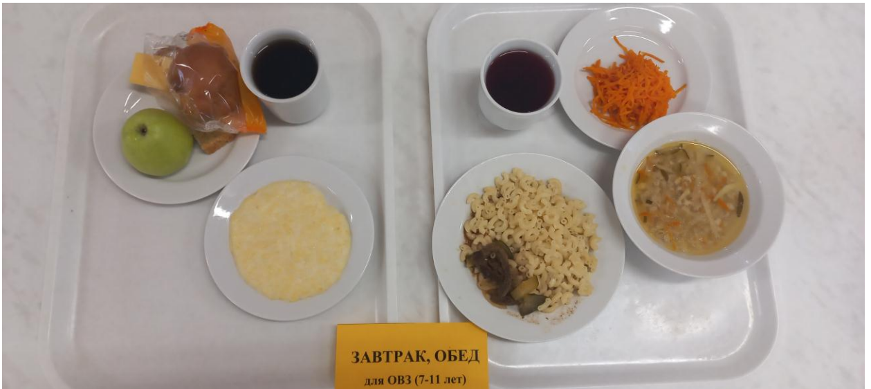
ЗАВТРАК, ОБЕД для ОВЗ (7-11 лет)