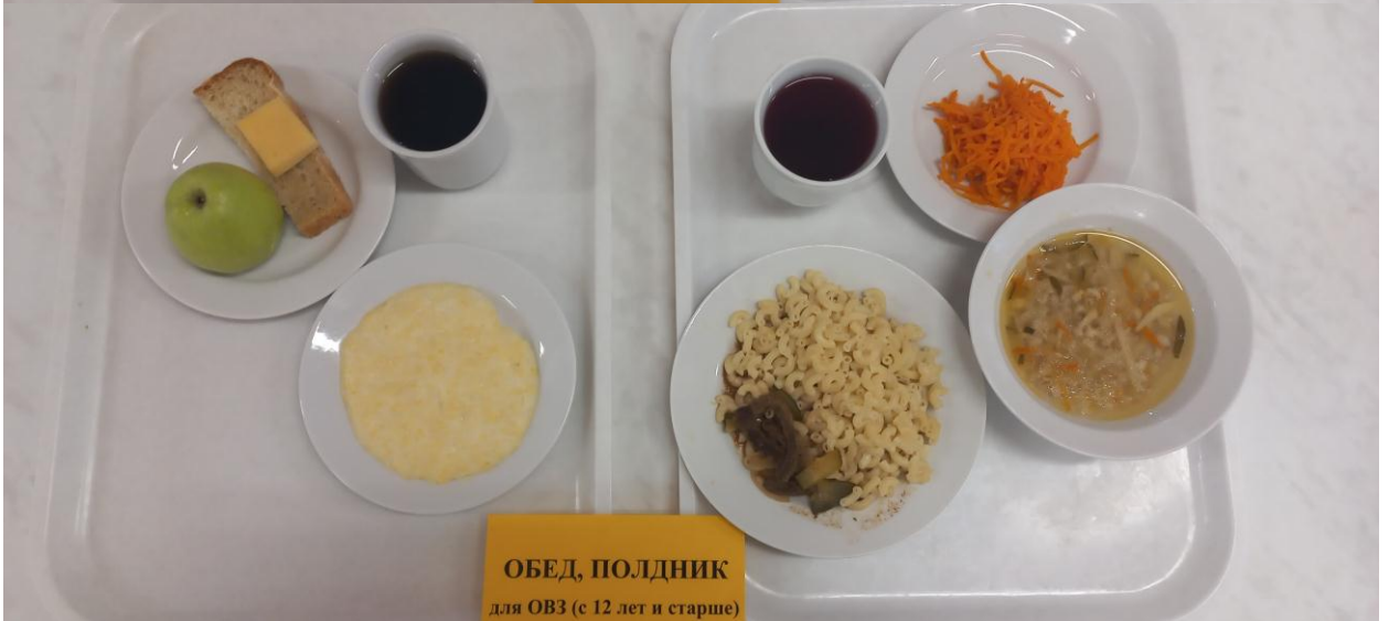
ОБЕД, ПОЛДНИК для ОВЗ (с 12 лет и старше)