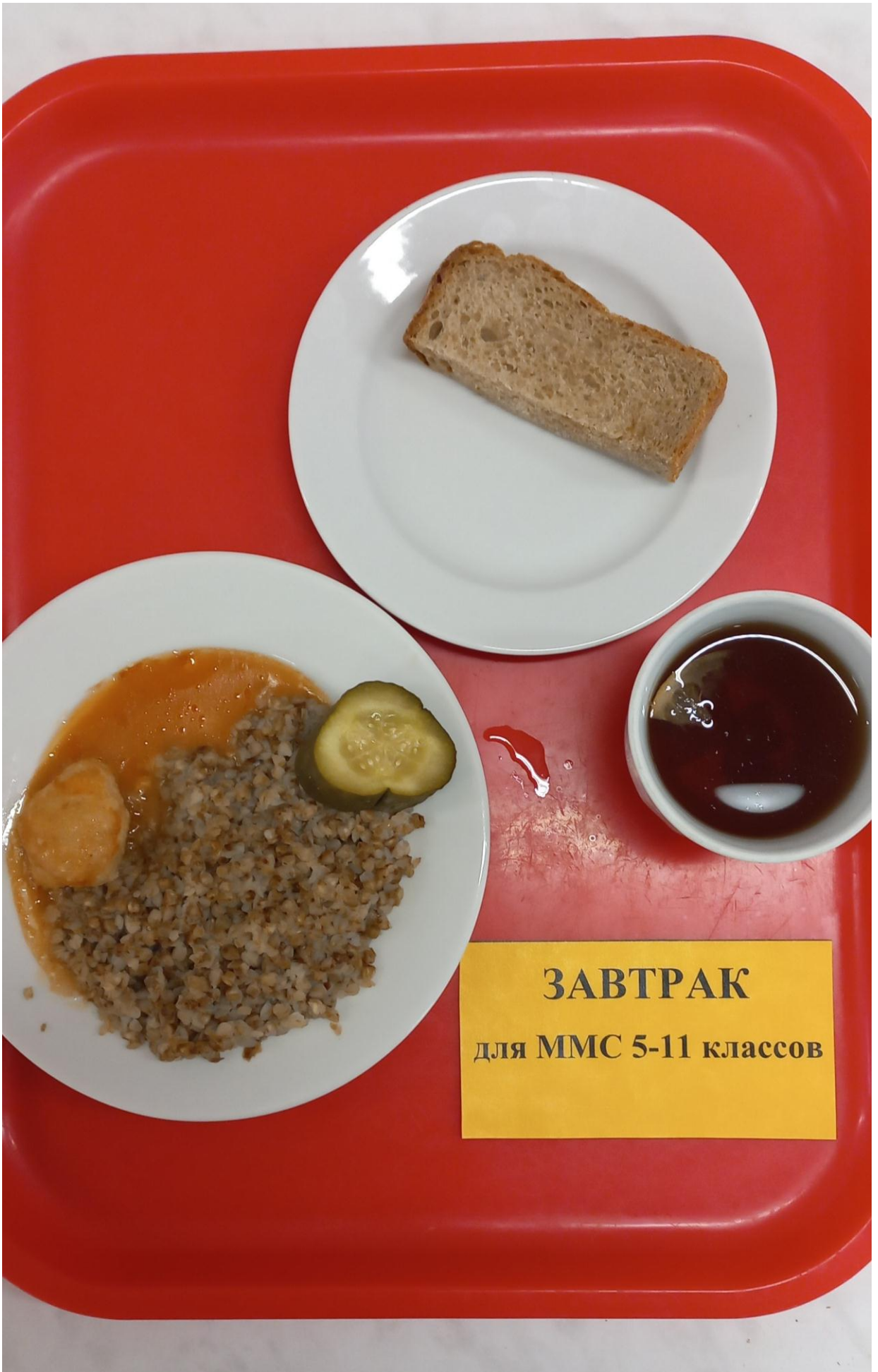
ЗАВТРАК для ММС 5-11 классов