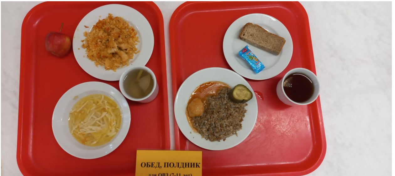
ОБЕД, ПОЛДНИК для ОВЗ (7-11 лет)