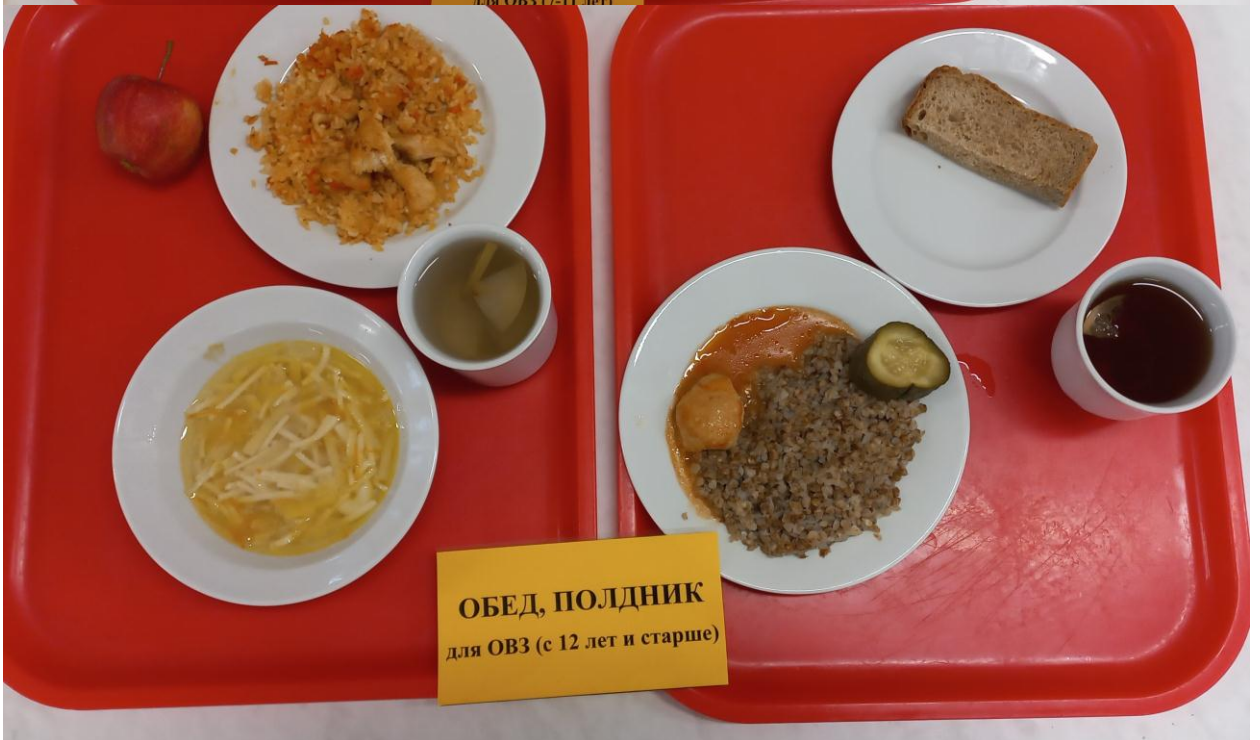
ОБЕД, ПОЛДНИК для ОВЗ (с 12 лет и старше)