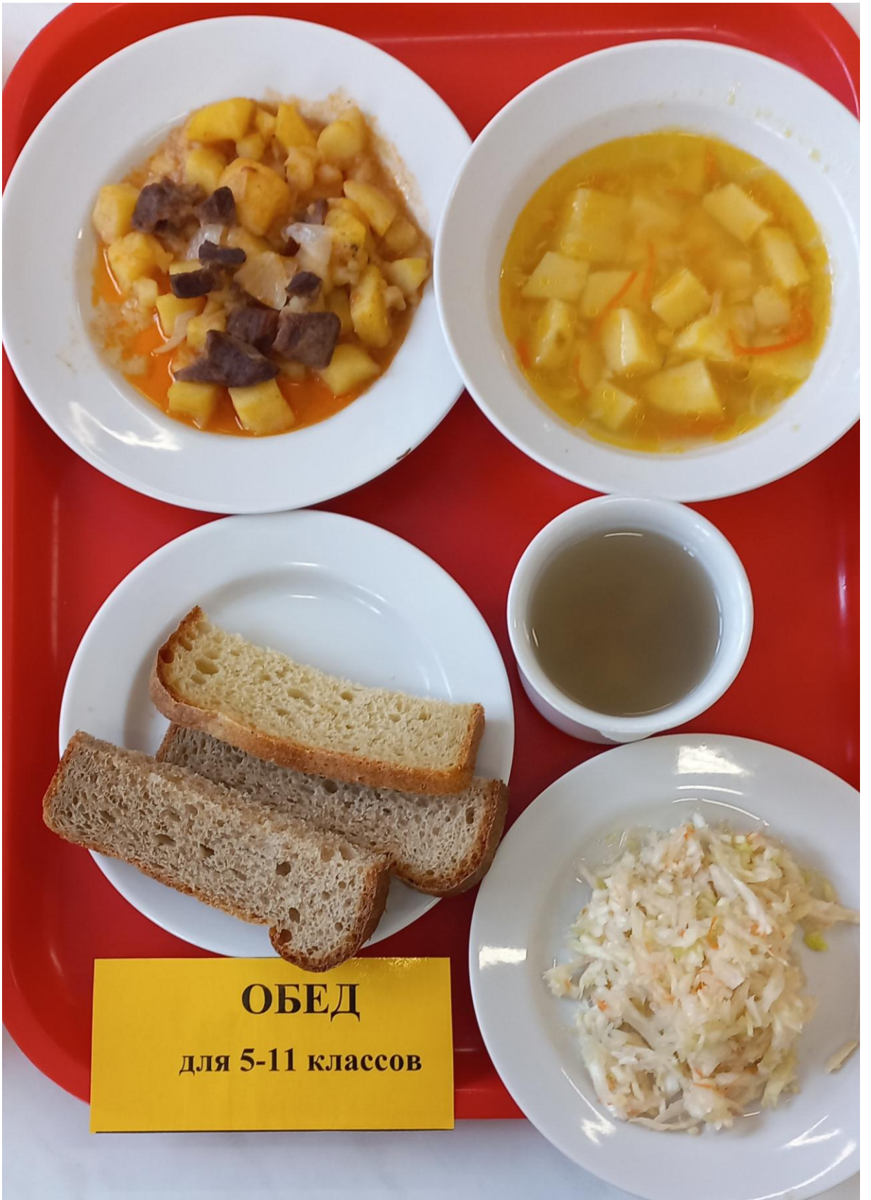
ОБЕД для 5-11 классов