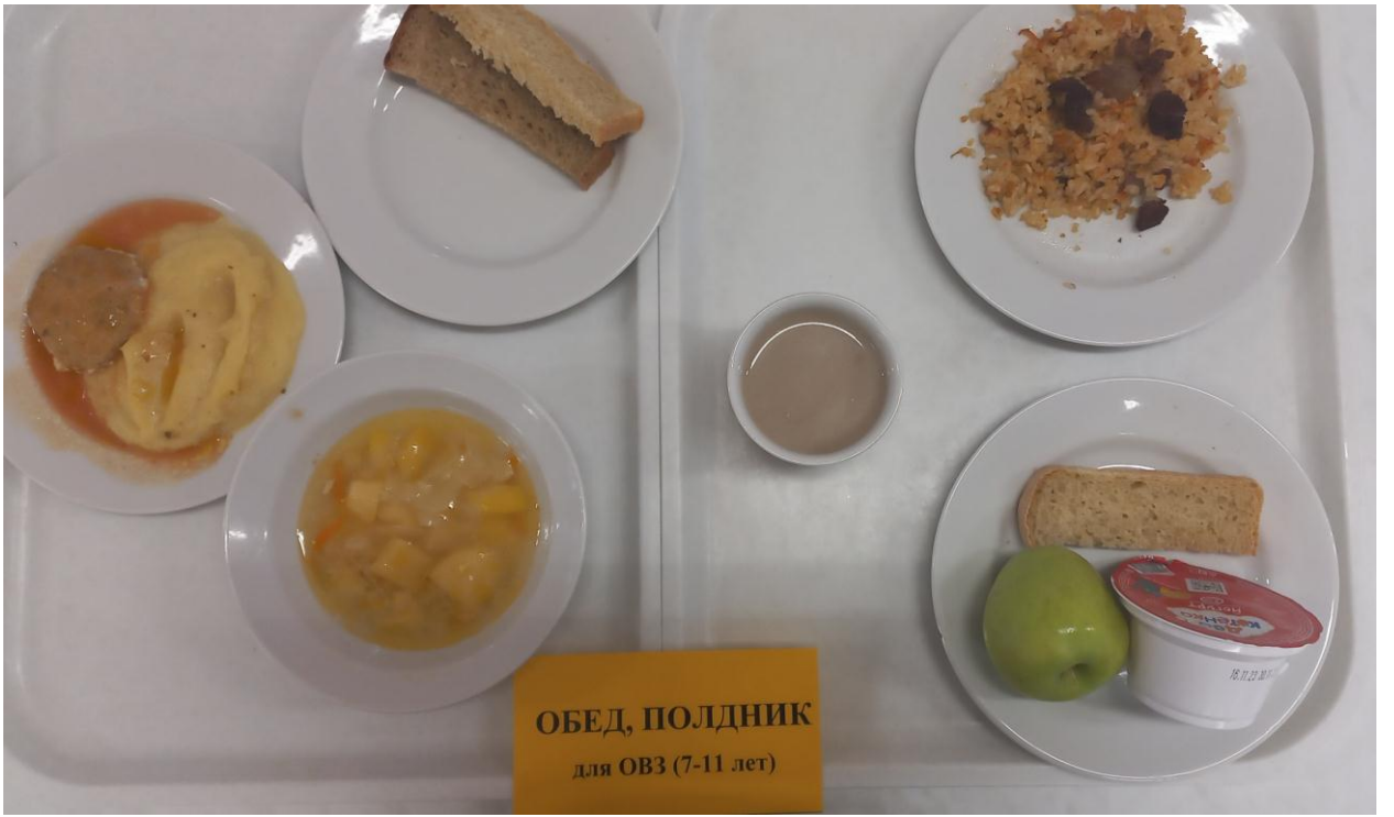
ОБЕД, ПОЛДНИК для ОВЗ (7-11 лет)