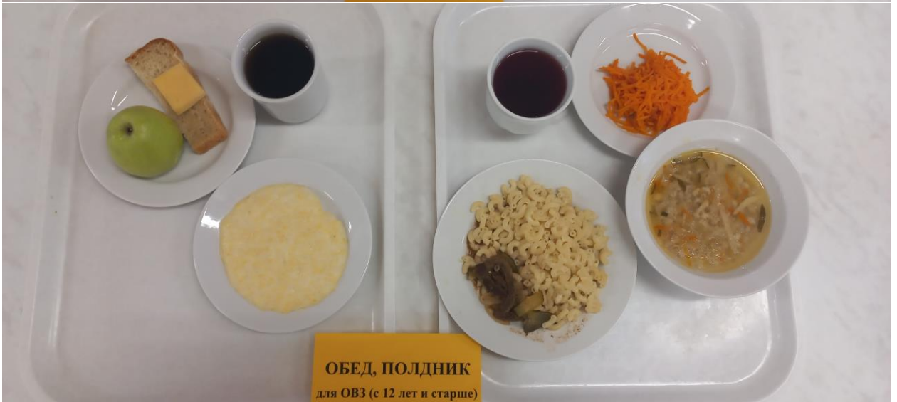
ОБЕД, ПОЛДНИК для ОВЗ (с 12 лет и старше)