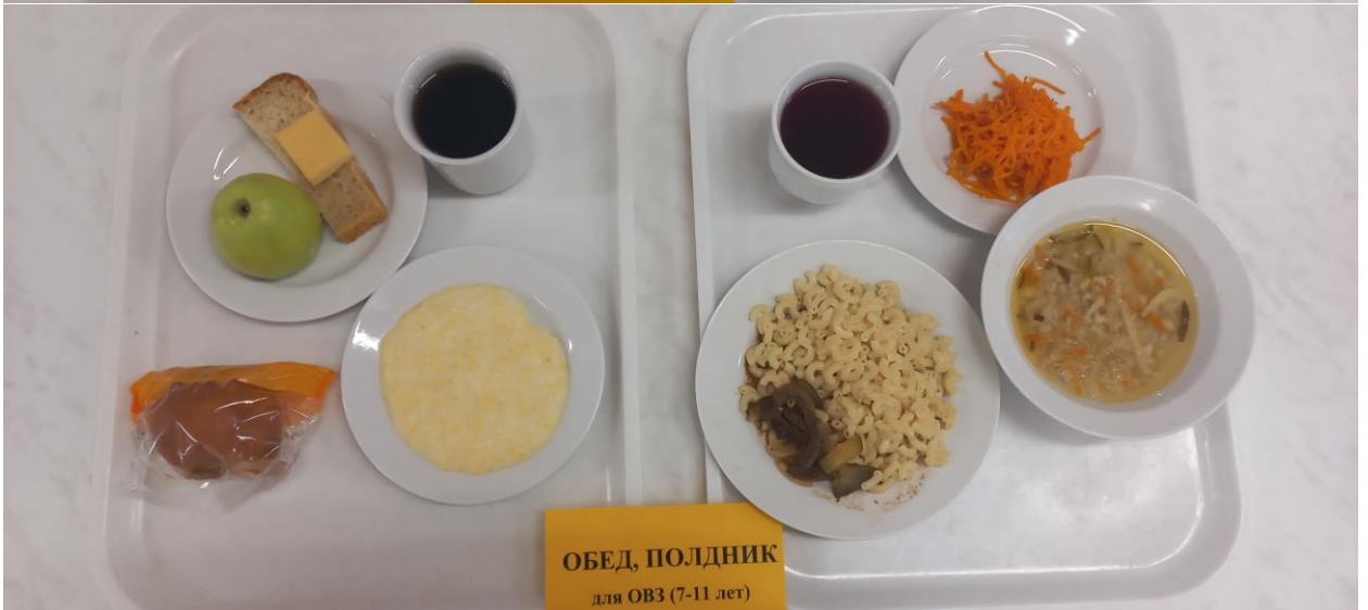
ОБЕД, ПОЛДНИК для ОВЗ (7-11 лет)