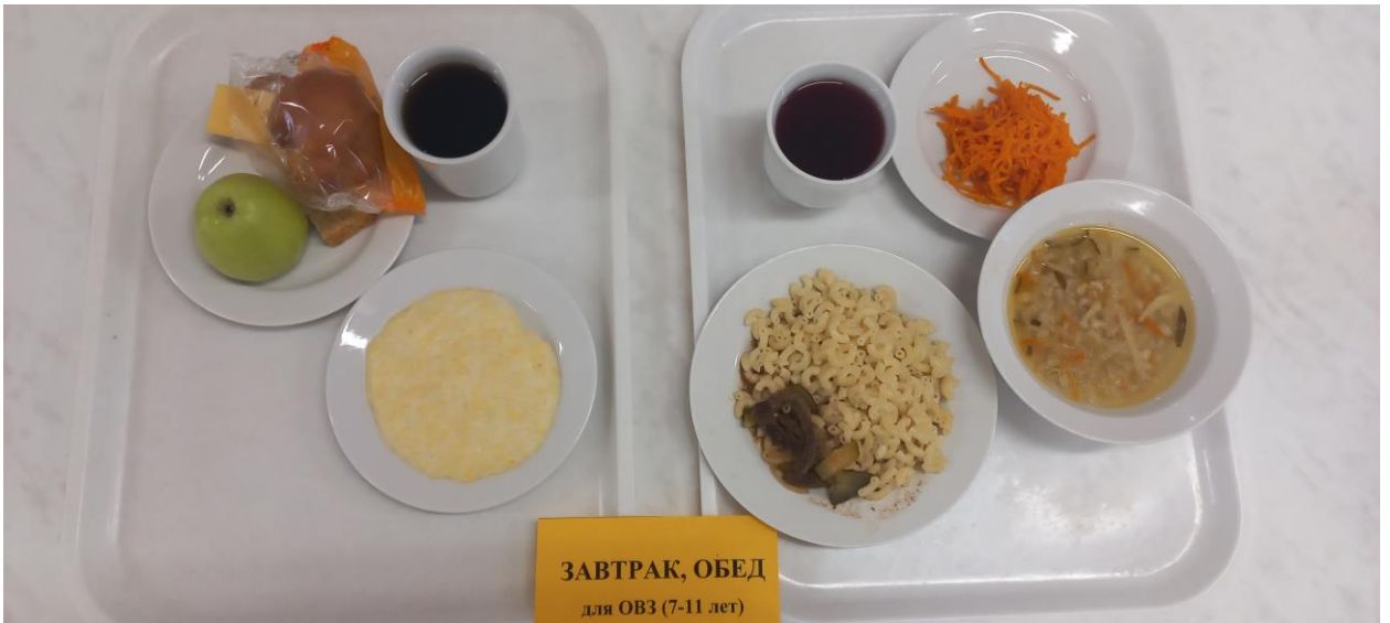
ЗАВТРАК, ОБЕД для ОВЗ (7-11 лет)