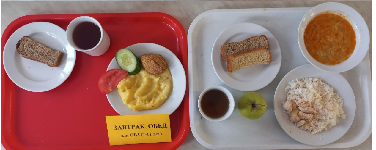
ЗАВТРАК, ОБЕД для ОВЗ (7-11 лет)