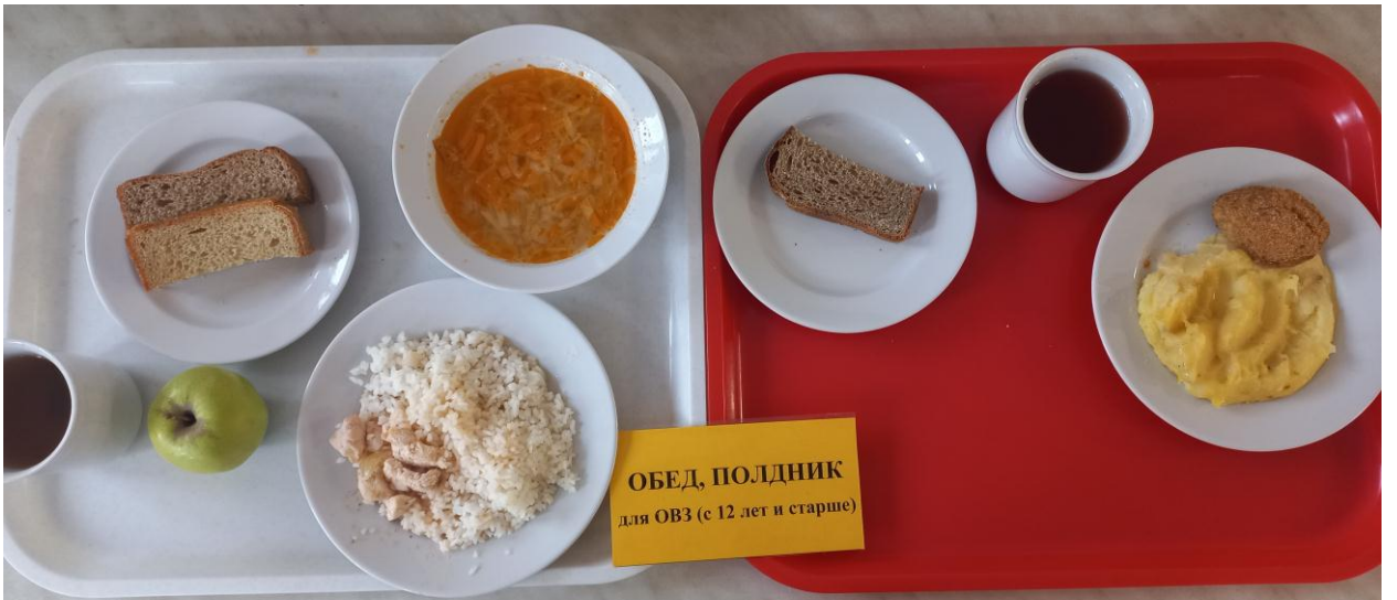
ОБЕД, ПОЛДНИК для ОВЗ (с 12 лет и старше)