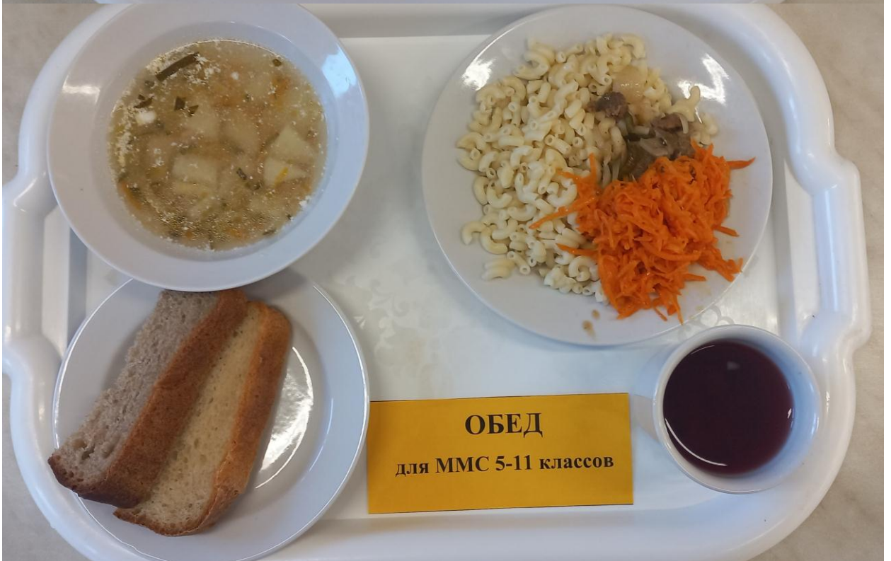
ОБЕД для ММС 5-11 классов