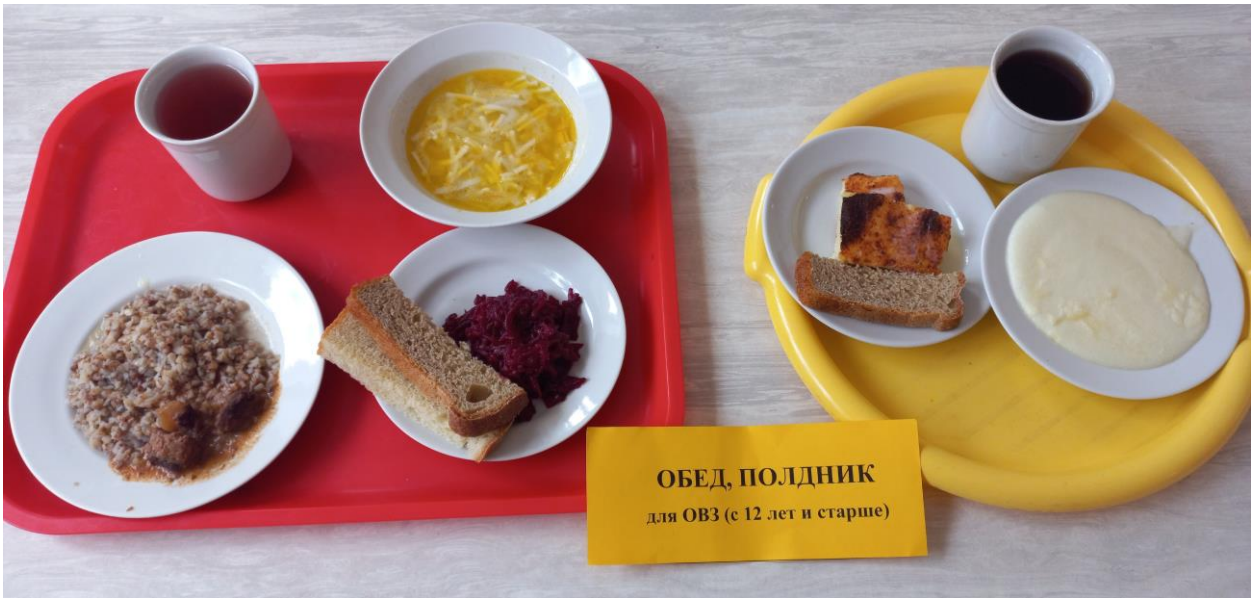
ОБЕД, ПОЛДНИК для ОВЗ (с 12 лет и старше)