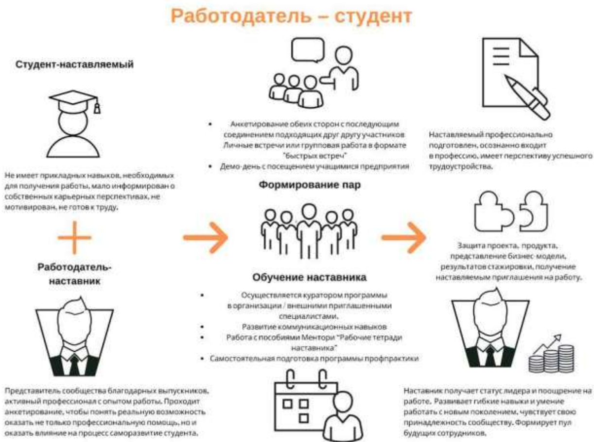
Рисунок 5. Графическое представление наставнического взаимодействия по форме «работодатель – студент»