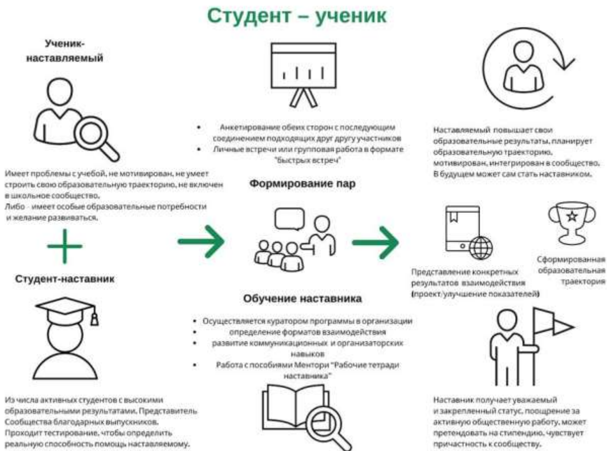
Рисунок 3. Графическое представление наставнического взаимодействия по форме «студент – ученик»