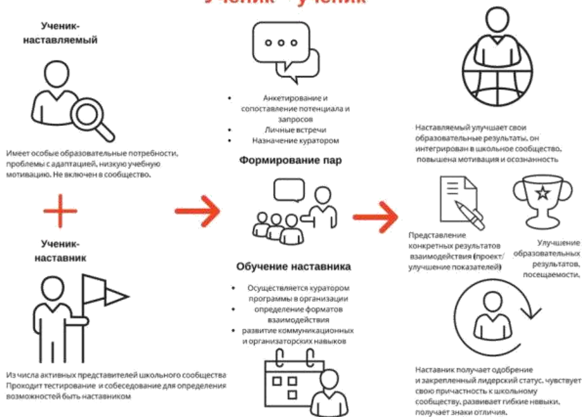
Рисунок 1. Графическое представление взаимодействия по форме «ученик – ученик»