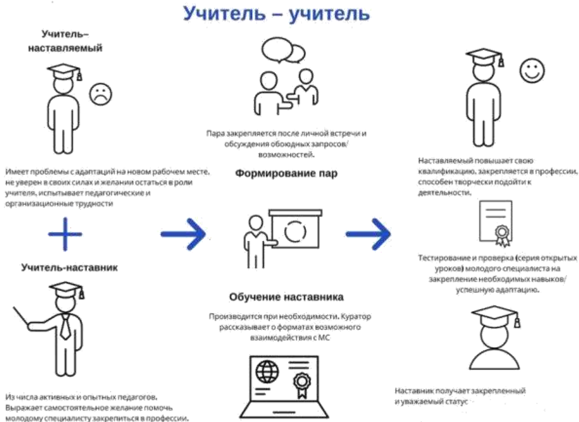
Рисунок 2. Графическое представление взаимодействия по форме «учитель – учитель»