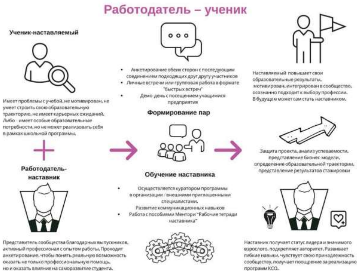
Рисунок 4. Графическое представление наставнического взаимодействия по форме «работодатель – ученик»