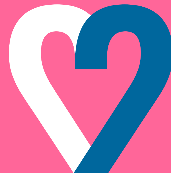
На цветном фоне