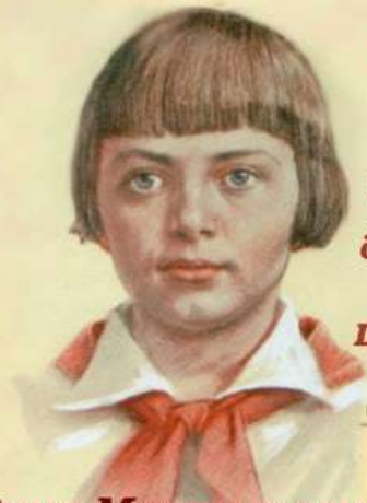
Зина Мартыновна Портнова

Родилась Зинаида Портнова 20 февраля 1926 года. Она одна из 4 пионеров, удостоенных звания Героя Советского Союза в годы Великой Отечественной войны (1941-1945).