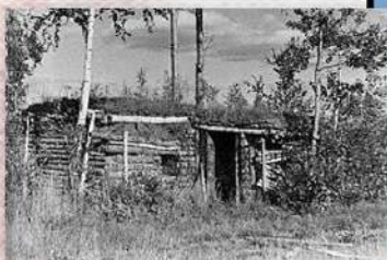
Немецкий ДЗОТ у деревни Чернушки, амбразуру которого закрыл своим телом Александр Матросов

затем на фронт. В феврале 1943 года его батальон атаковал опорный пункт фашистов, но угодил в ловушку, попав под плотный огонь, отрезавший путь к окопам. Стреляли из трех дзотов. Два вскоре замолчали, однако третий продолжал расстреливать красноармейцев, залегших в снегу. Видя, что единственный шанс выйти из-под огня, это подавить огонь соперника, Матросов с однополчанином дополз до дзота и бросил в его сторону два гранаты.