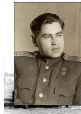
Маресьев А. П. (1916–2001 гг.)