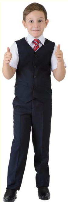
Жилет MG-S5-002 Брюки MB-S5-003 Сорочка CSHB-A005