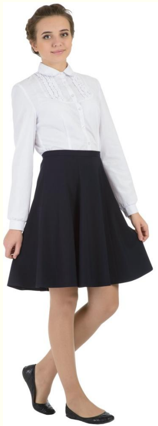
Юбка DU-L5-007 Блузка CBLG-A007