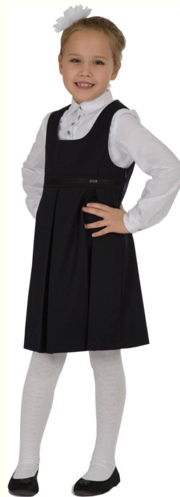
Сарафан DS-S5-006 Блузка SC6CBLG-012