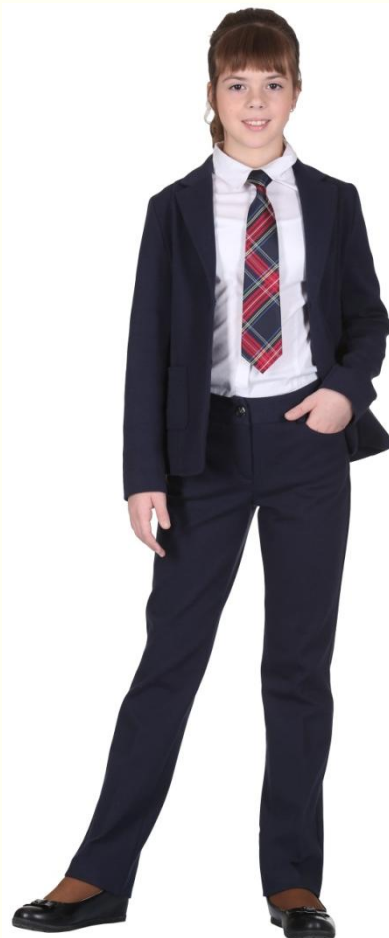
Жакет без подклада DJ-M5-002