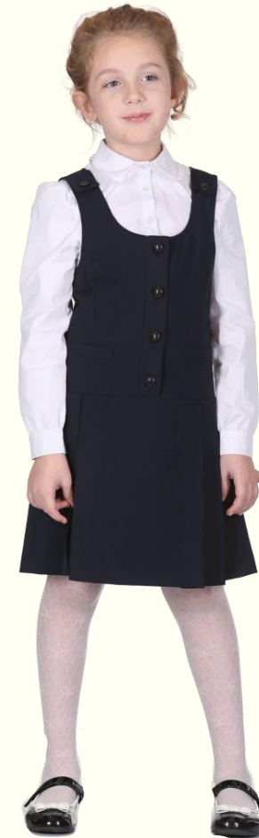
Сарафан DS-S5-004 Блузка CBLG-A005