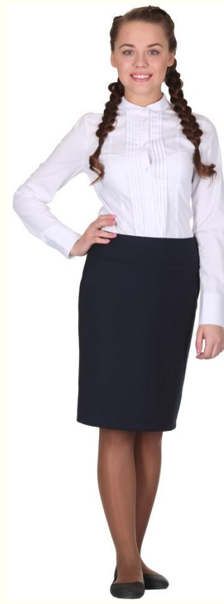
Юбка DU-L5-006 Блузка CBLG-A006