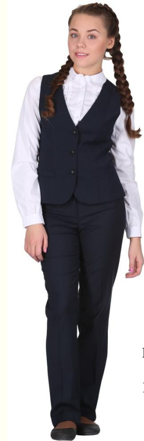
Жилет DG-L5-002 Брюки DB-L5-003