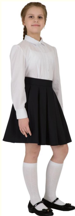
Юбка DU-S5-005 Блузка SC6CBLG-012