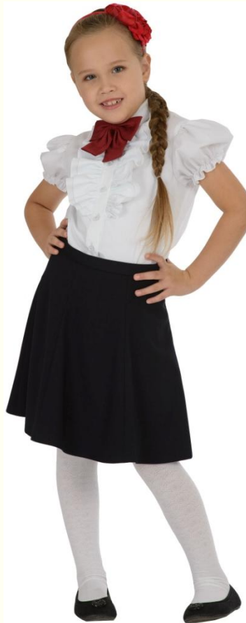
Юбка DU-S5-007 Блузка SC6CBLG-013