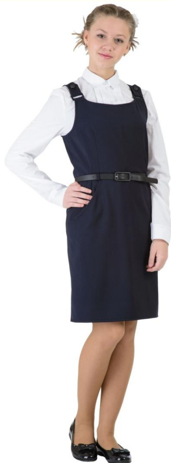
Сарафан DS-M5-003 Блузка SC6CBLG-008