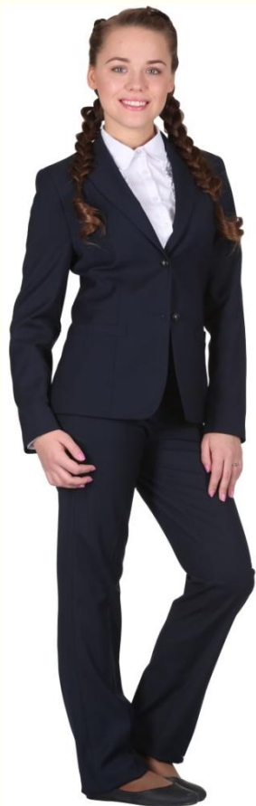
Брюки DB-L5-003 Жакет DJ-L5-002