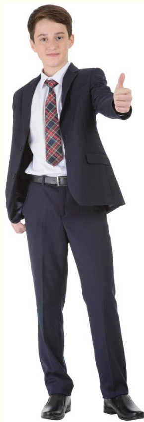
Пиджак MP-M5-212 Брюки MB-M5-003 Сорочка CSHB-A002