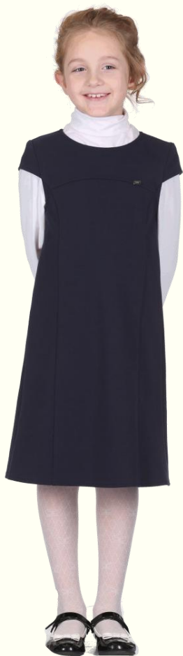
Сарафан DS-S5-007T Водолазка CJMC-A004