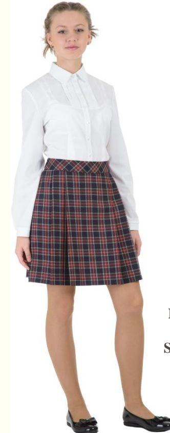
Юбка DU-M5-004K Блузка SC6CBLG-010