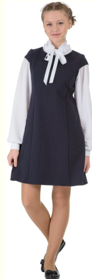
Сарафан DS-M5-007T Блузка SC6CBLG-015