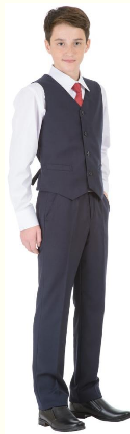
Жилет MG-M5-002 Брюки MB-M5-003 Сорочка CSHB-A002