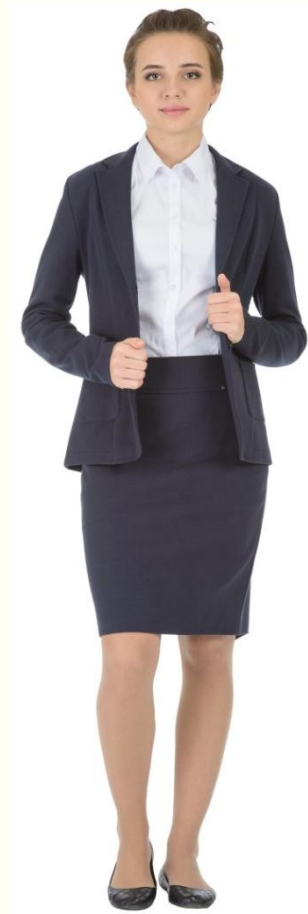
Жакет DJ-L5-003Т Юбка DU-L5-006Т Блузка CBLG-A004