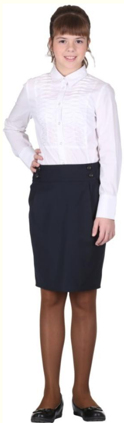
Юбка DU-M5-003 Блузка CBLG-A003