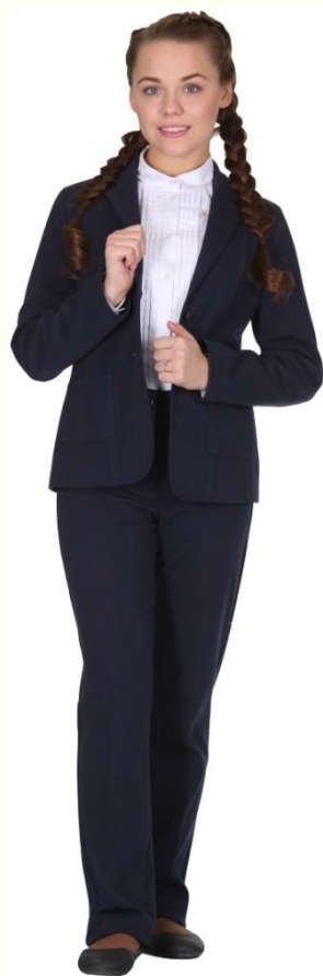
Жакет без подклада джерси DJ-L5-003Т