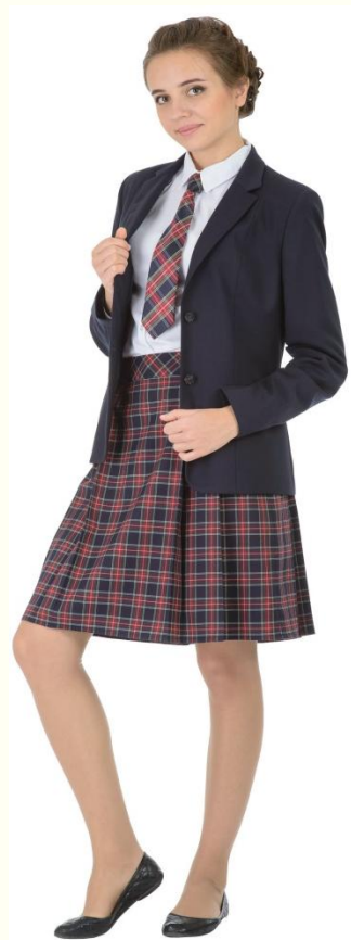
Юбка DU-L5-004К Блузка CBLG-A007