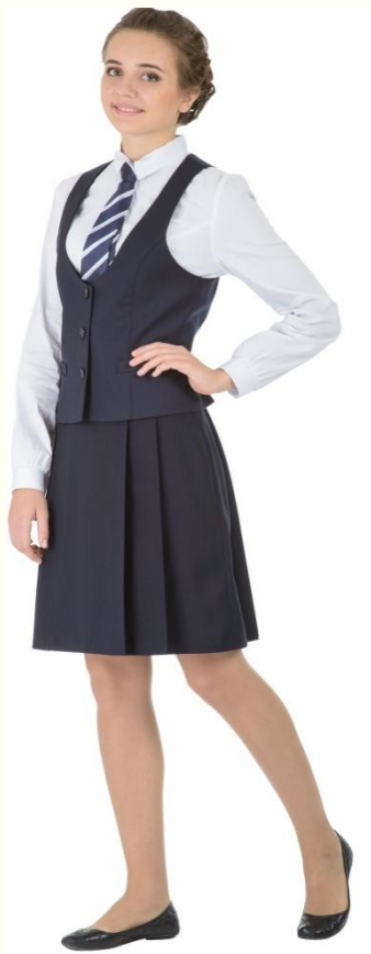
Жилет DG-L5-003 Юбка DU-L5-004