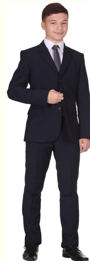
Пиджак MP-L5-312 Брюки MB-L5-003 Сорочка CSHB-A002