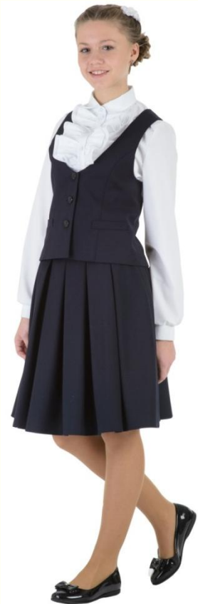
Жилет DG-M5-003 Юбка DU-M5-005