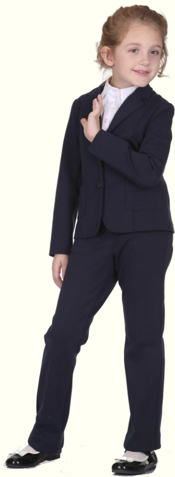
Жакет без подклада DJ-S5-003 T