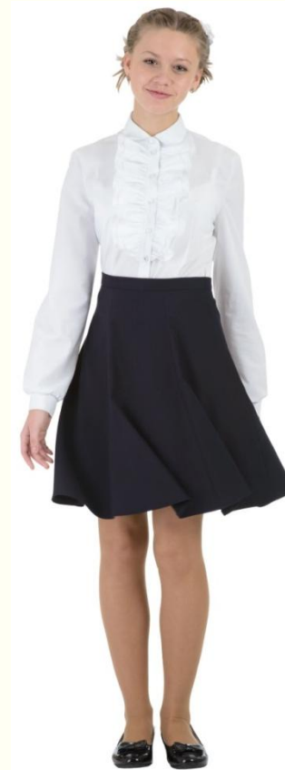
Юбка DU-M5-007 Блузка SC6CBLG-014