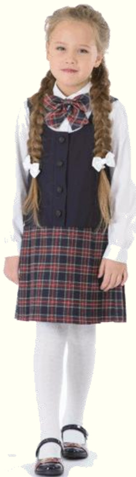
Сарафан DS-S5-004K Блузка CBLG-A004