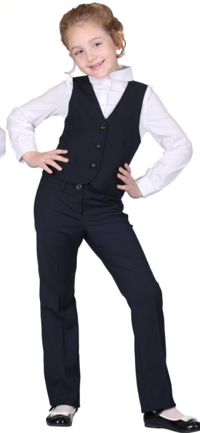
Жилет D6-S5-001 Брюки DB-S5-003