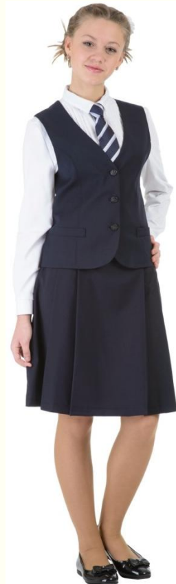
Жилет DG-M5-001 Юбка DU-M5-04