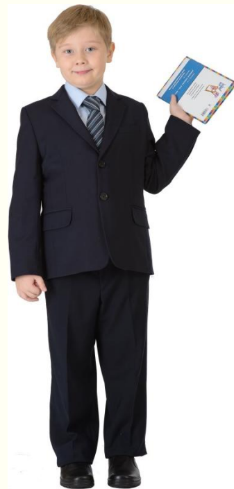
Для полных мальчиков