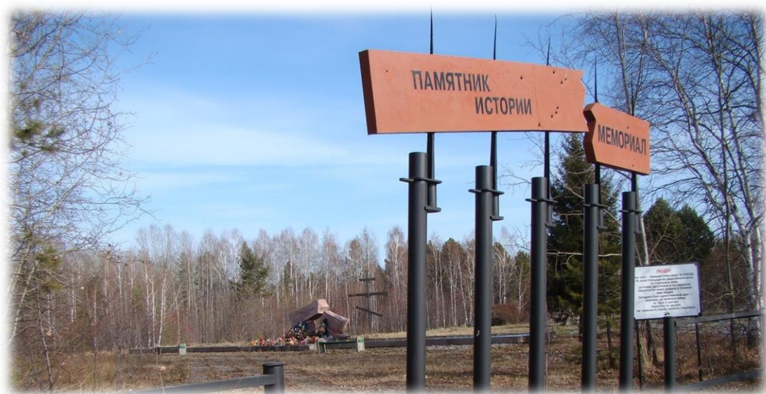
Памятник истории Мемориал жертв политических репрессий, село Пивовариха, 2000 гг.