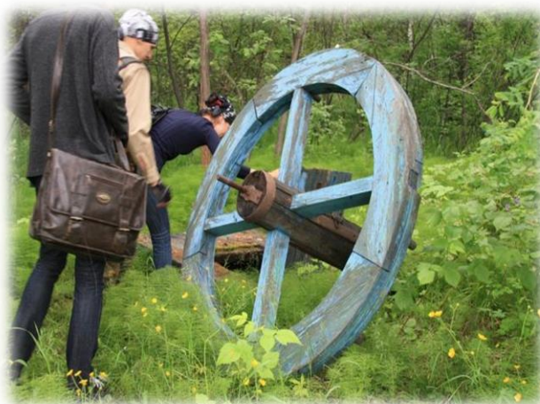
Старый колодец и колючая проволока на подходе к Даче

С 1920 г. дача стала местом отдыха иркутских чекистов. Дача была красива и просторна, выходила на живописный луг, усыпанный цветами. Озеро было, лодочка. Однако именно это райское место очень скоро стало самым страшным в округе.