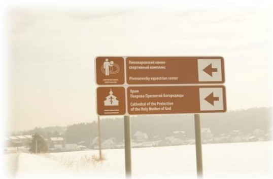
Дорожный указатель к церкви