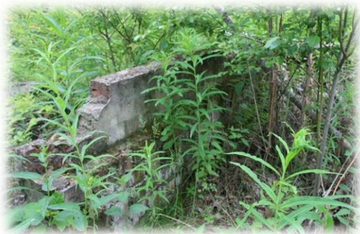
Остатки «Дачи Лунного Короля»

Прибыли репатрианты — люди, побывавшие в плену. Все эти люди, поставленные на специальный учет, были обязаны раз в неделю отмечаться в комендатуре. Село фактически перешло в распоряжение МВД, по периметру оно было огорожено колючей проволокой, охранялось солдатами с собаками, существовал пропускной режим. Отлучаться в город без специального разрешения не полагалось. Постоянные документы не выдавались, выдавались справки, «удостоверяющие личность», лишь в 1956 г. жителям были выданы паспорта. С 1945 г. в Пивоварихе несколько лет трудились пленные японцы, именно их силами вручную была отсыпана дамба озера в с. Пивовариха, в д. Новолисиха. Японцы работали на колхозных огородах и сплавляли лес, заложили питомник плодово-ягодных культур, впоследствии питомником занимался сосланный из Прибалтики