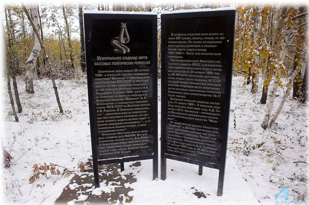
На месте захоронения открыты памятные знаки, установлена Стена скорби с фамилиями и портретами репрессированных.