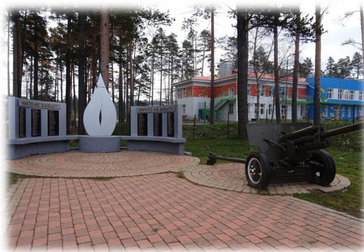
с. Пивовариха, ул. Дачная, 6