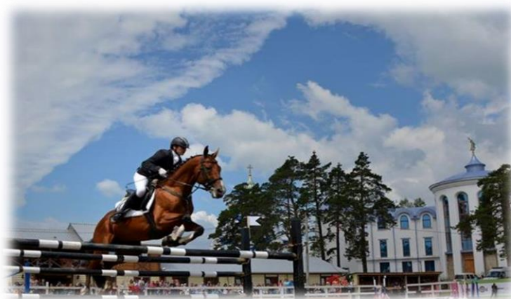
конно-спортивный комплекс "Пивоваровский, 2000 гг.

Сегодня конно-спортивный комплекс "Пивоваровский" вносит свою значимую лепту в развитие конного спорта Иркутской области.