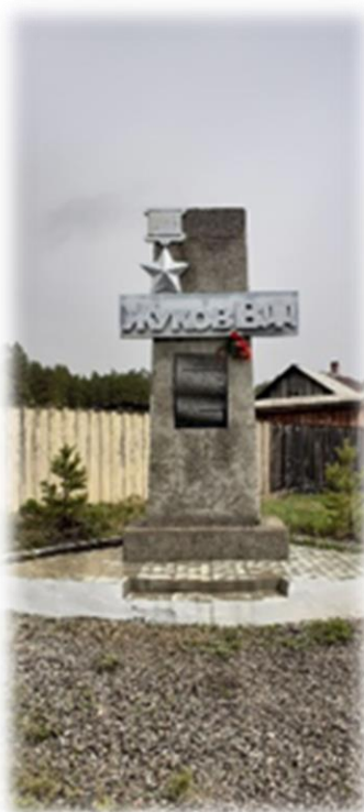
Памятник Герою Советского Союза лётчику-истребителю Жукову В. Ф. в д. Поливаниха