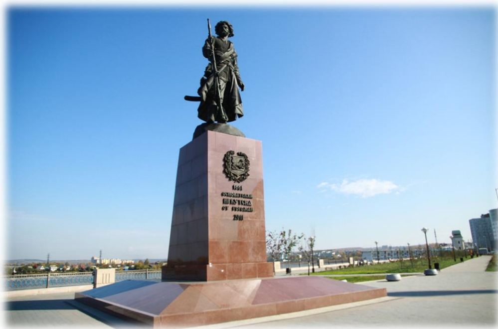
Памятник Якову Похабову. Иркутск, ул. Нижняя Набережная, 2

Памятник Якову Похабову в Иркутске – бронзовая статуя, установленная в 2011 г. к 350-летию города в месте его основания – сейчас это район улицы Нижняя Набережная. Отсюда открывается живописный вид на Ангару, а неподалёку располагается Собор Богоявления и триумфальная арка «Московские ворота».