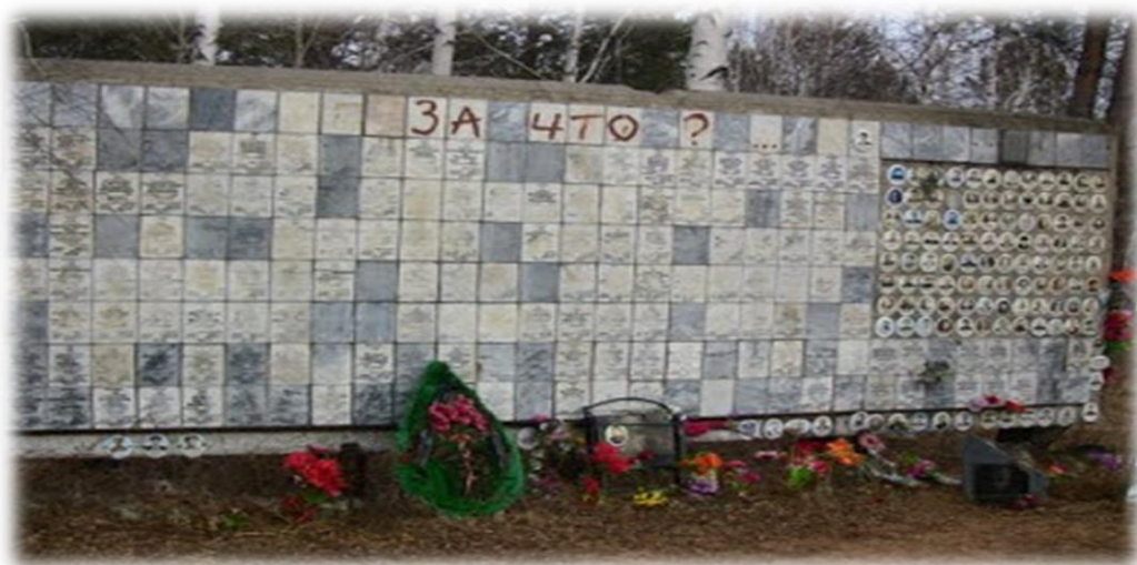
В 1992 г. была построена Стена скорби с личными памятными знаками. В том же г. на кладбище были проложены дорожки, поставлены скамейки, высажены деревья. Мемориальный комплекс занимает около 7 га.