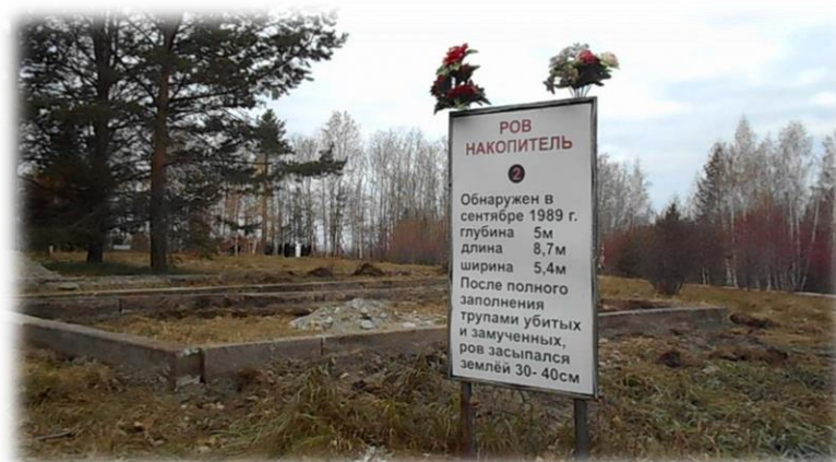
Указатель рвов накопителей в Меморале жертвам политических репрессий

Первый ров с захоронениями обнаружен 29 сентября 1989 г., тогда же были извлечены и отправлены на экспертизу останки 304 человек. Вскоре удалось определить месторасположение еще двух рвов (эксгумация не проводилась). Прокуратура возбудила уголовное дело.