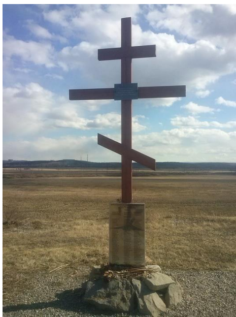
Памятный крест в память о погибших 3 января, 1994 г.

Третье января 1994 г. – день памяти по погибшим в авиакатастрофе Ту-154. У самолета, который направлялся в Москву, через 3,5 минуты после взлета загорелся двигатель. Пилоты развернули лайнер обратно в Иркутск, но он потерял