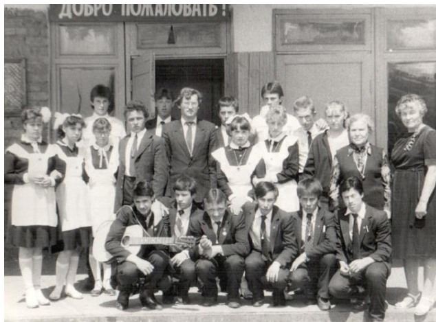
МОУ ИРМО «Мамоновская СОШ», 1980 гг.

За 50 лет школа выпустила 14 выпусков восьмиклассников, 29 выпусков 10 и 11 классов.