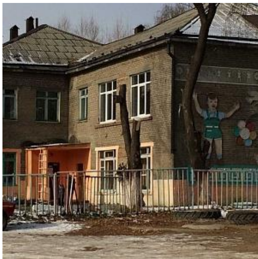
"Мамоновский детский сад комбинированного вида"