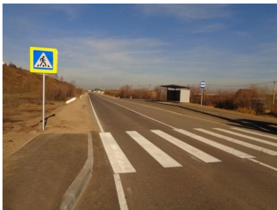
Московский тракт перед поворотом на Мамоны

Через 5 километров подъезжаем к селу Мамоны.