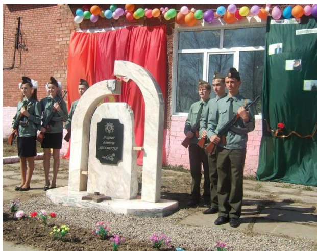
9 мая, 2020 г., село Мамоны