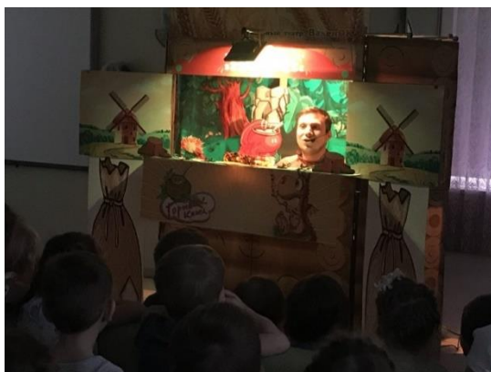
1. Спектакль в Детском саду №220 ОАО «РЖД» Солнышко

Театр «ВаленОК» представил своим зрителям кукольный спектакль: «Горшочек каши».