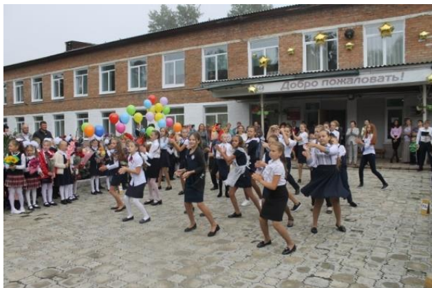
МОУ ИРМО «Мамоновская СОШ», 2000 гг.

Школа гордится Вами, дорогие выпускники!