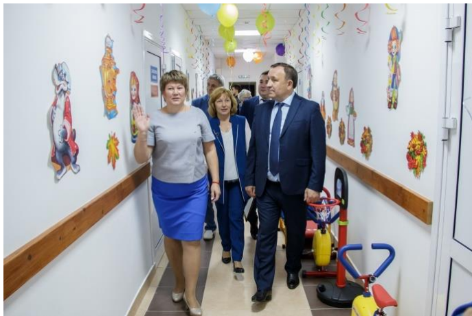
Открытие нового помещения детского сада. 2020 г.

Также администрация Иркутского района в 2019 г. приобрела помещение в микрорайоне Южном для ясельной группы.