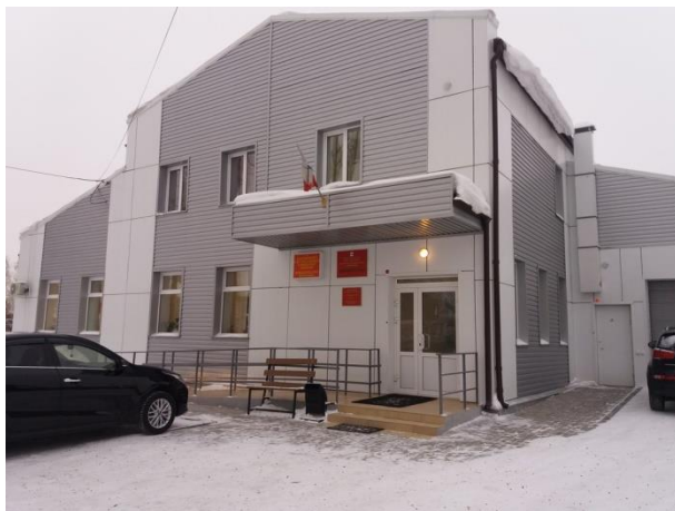
Администрация Мамонского муниципального образования, 2020 г.

Мамонское муниципальное образование является сельским поселением в составе Иркутского районного муниципального образования Иркутской области. Мамонское муниципальное образование расположено в Иркутском районе в юго-восточной части Иркутской области и граничит с Иркутским городским округом, с Ангарским и Шелеховским муниципальными районами.