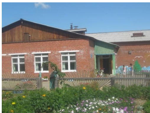
"Мало-Еланская начальная школа-детский сад", 2020гг.

Муниципальное общеобразовательное учреждение. Иркутского районного муниципального образования. "Мало-Еланская начальная школа-детский сад".