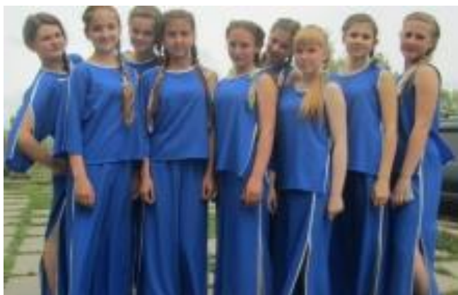
Коллектив «Улыбка», созданный в 2007г.

Вокальный коллектив «Сибирячка» и «Надежда» 20 лет работают на Мамонской земле.