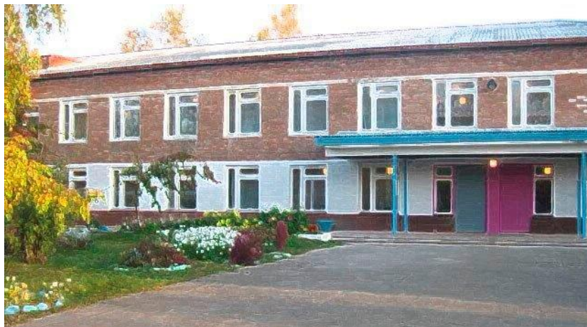
МОУ ИРМО «Мамоновская СОШ», 2000 гг.