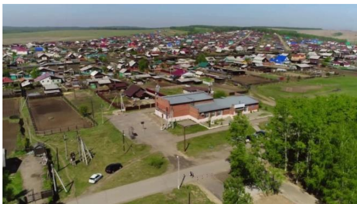
Село Мамоны, 2020гг.

Мамоны — село в Иркутском районе Иркутской области России. Административный центр Мамонского муниципального образования. Находится в 10 км к западу от центра Иркутска.