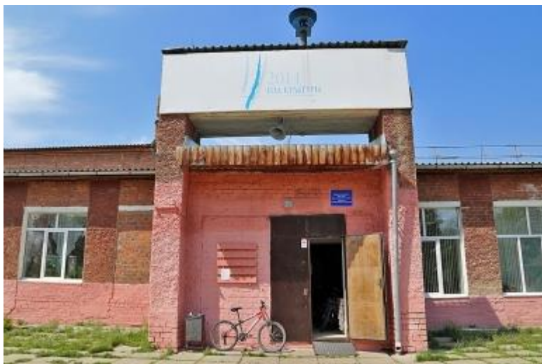
Дом культуры в селе Мамоны, 2020гг.

Дом культуры в селе Мамоны МКУК КСЦ Мамонского МО – одно из популярнейших мест. Здесь проводят все мероприятия, отмечают юбилеи. Здесь чествуют ветеранов и самых