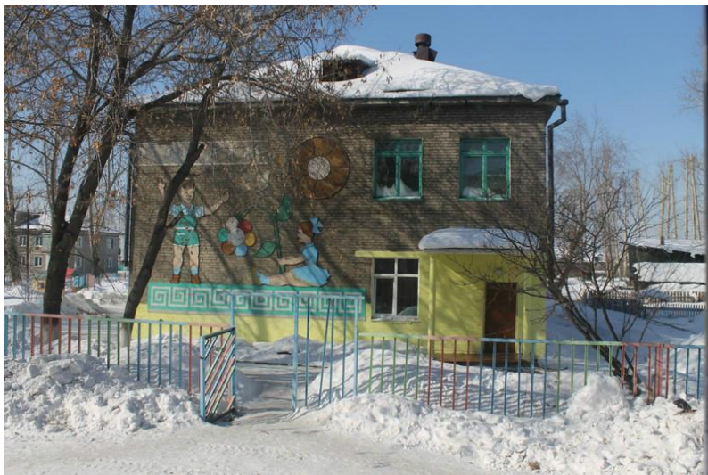
"Мамоновский детский сад комбинированного вида"

МДОУ ИРМО "Мамоновский детский сад комбинированного вида" начал свою работу в декабре 1972 г.