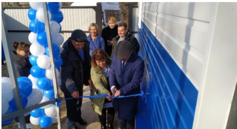
Открытие ветеринарного пункта в селе Мамоны по адресу улица Центральная, 15.

В Иркутском районе в селе Мамоны отремонтировали ветеринарный пункт. Количество обращений увеличилось. В месяц поступает около 200 обращений. В здании оборудована современная операционная, бокс для амбулаторного лечения животных и ветеринарная аптека.