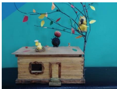
Конкурс поделок и рис. «Вот и наступила осень, птицы в лето улетают»