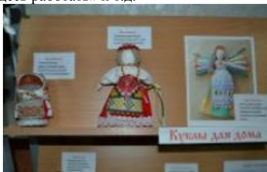
Куклы из Бабушкиного сундука