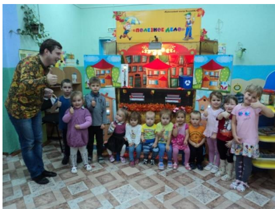
2. Театр «ВаленОК» в гостях у Патроновского детского сада.

Ребята с большим интересом смотрели, как разворачиваются события и, что самое главное, активно принимали участие (отвечая на вопросы) в судьбе главного героя.