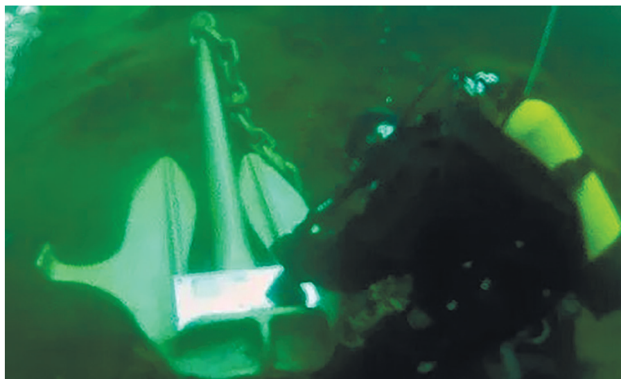
Памятник на дне Байкала водолазам, погибшим во время Великой Отечественной войны, оз. Байкал, залив Лиственничный, 2015 г.