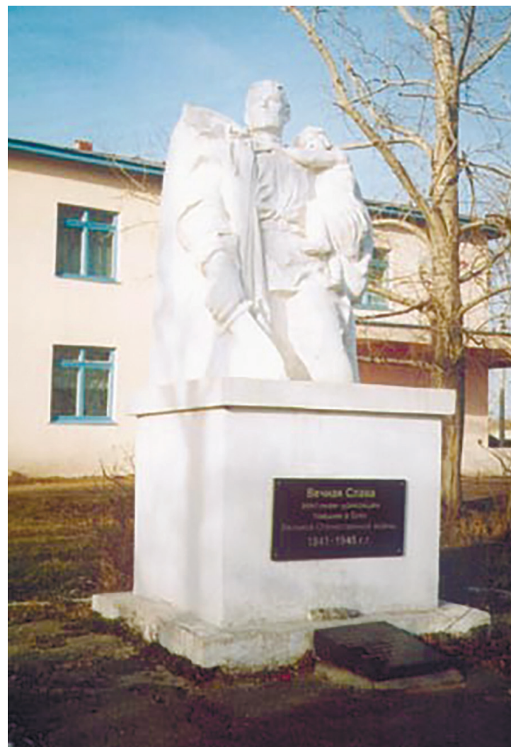
Памятник воинам-землякам, участникам Великой Отечественной войны 1941-1945гг, с. Урик, ул. Лунина, 2г, установлен в 1975 г.