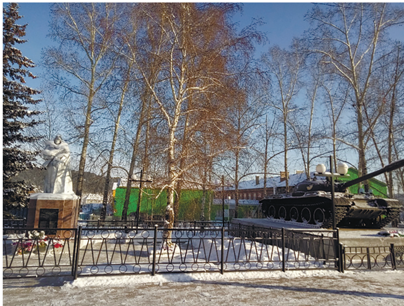
Мемориал Славы, д. Карлук, ул. Гагарина, 4