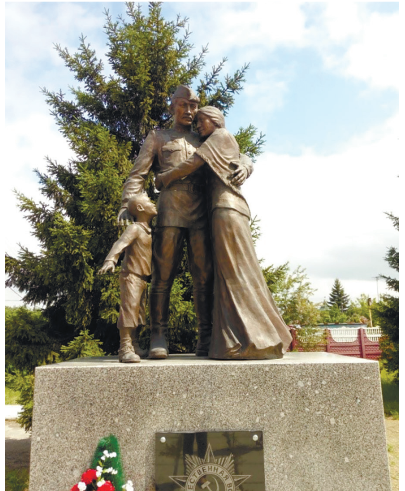
Скульптурная композиция «Победитель» была открыта в с. Смоленщина, ул. Зои Космодемьянской, 3, 2015 г.

9 мая 2015 г. в торжественной обстановке, с участием ветеранов и жителей села, в присутствии телевидения и других СМИ, новый Мемориал Памяти в с. Смоленщина был открыт!