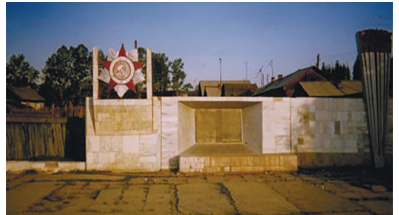
Мемориал воинам-землякам, погибшим в годы Великой Отечественной войны, пос. Горячий Ключ, ул. Коммунистическая, 27, 1985 г.

В 1985 г. обелиск воинам-землякам разместили на одной из центральных улиц – Коммунистической, 27 – в пос. Горячий Ключ.