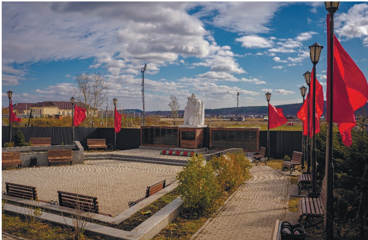
Мемориал землякам, ушедшим на фронт в годы Великой Отечественной войны, с. Урик, ул. Лунина, 2024 г.