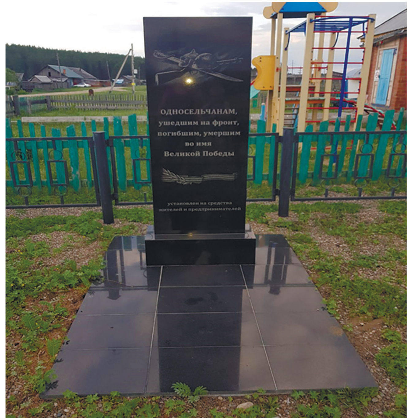
Памятник односельчанам, не вернувшимся с Великой Отечественной войны, пос. Усть-Балей, ул. Молодёжная, 1а, 2011 г.