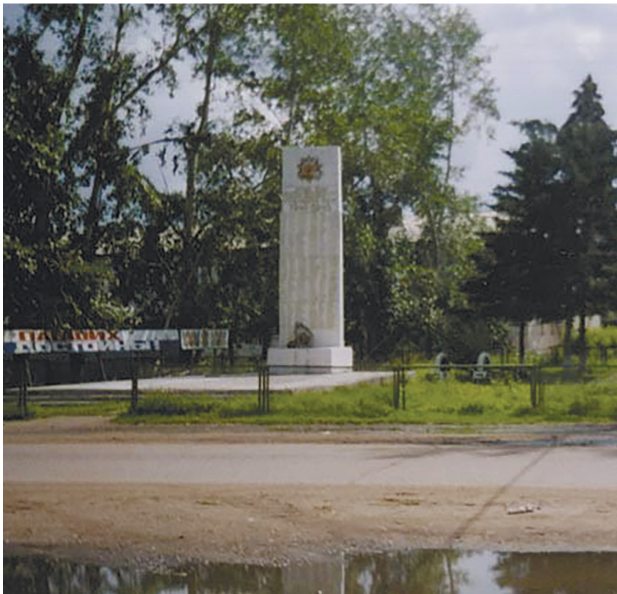
Обелиск Вечной Славы землякам-хомутовцам, с. Хомутово, 1966 г

Обелиск Вечной Славы землякам-хомутовцам первоначально установлен 9 мая 1966 г.