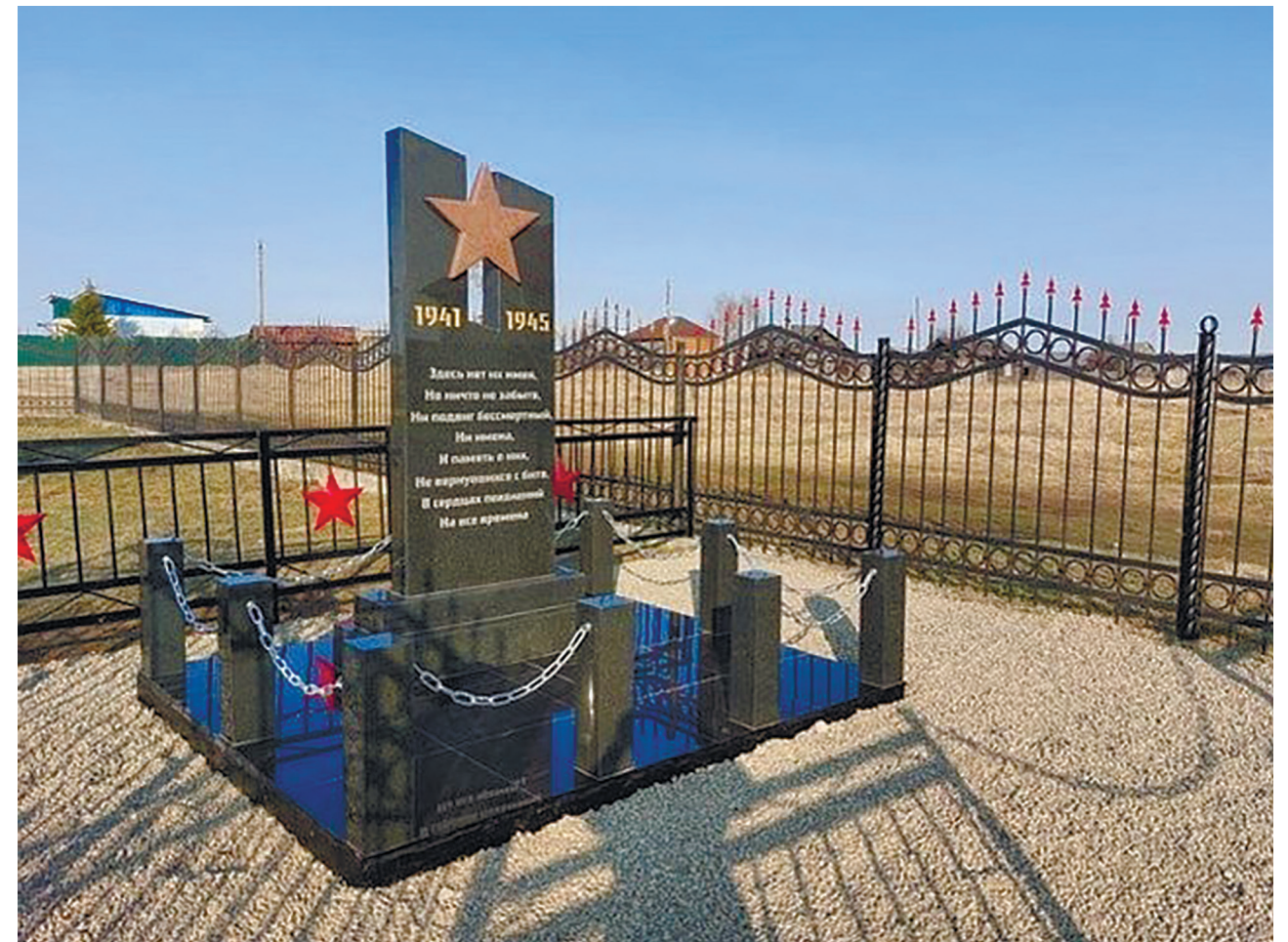
Памятник воинам-землякам, павшим в годы Великой Отечественной войны, д. Бургаз, 2023 г.

В д. Бургаз Иркутского района 9 мая 2023 г. состоялось открытие мемориальной стелы, которую посвятили павшим в годы Великой Отечественной войны местным жителям.