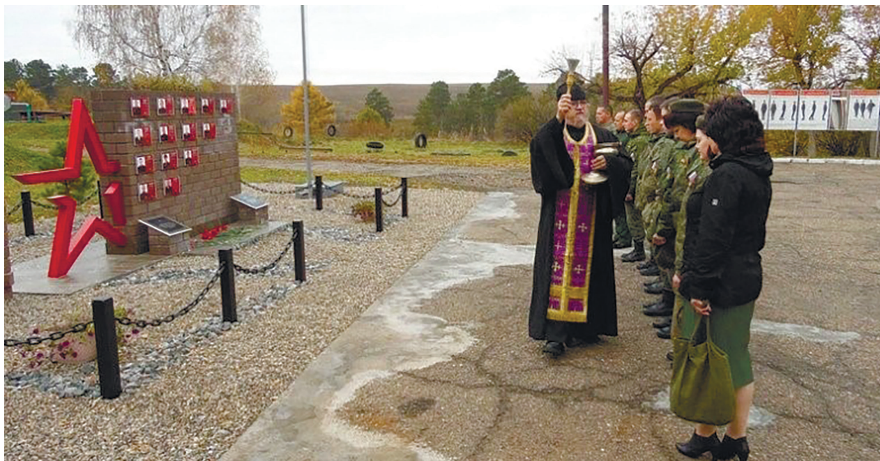
Памятный знак героям-топографам на территории военной части с. Хомутово, 2024 г.