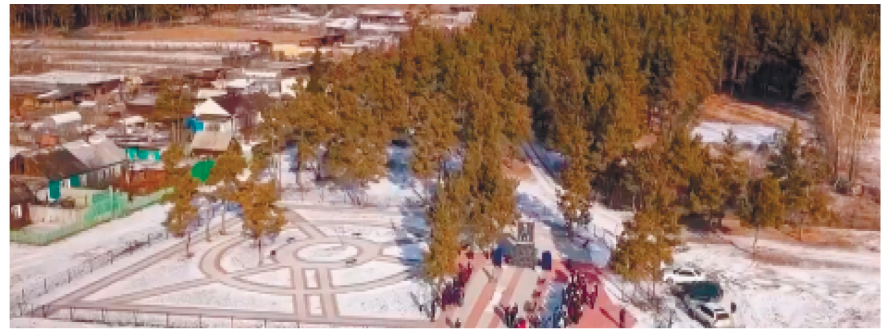
Парк Победы и Памятник воинам Великой Отечественной войны, с. Никольск, пл. Комсомольская, 2021 г.