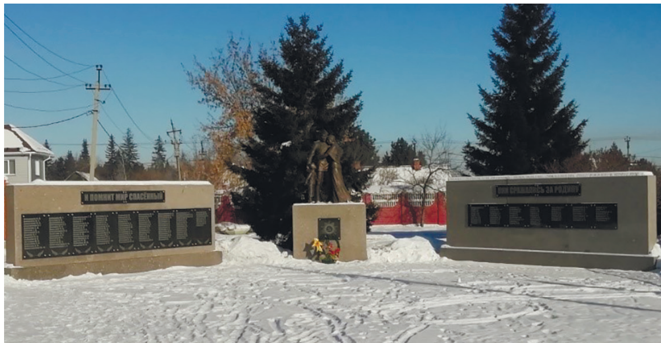
Памятник воинам-землякам, участникам Великой Отечественной войны, с. Смоленщина, ул. Зои Космодемьянской, 3, 1991 г.