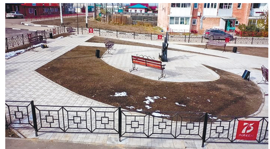
Парковая зона, посвящённая 75-летию Победы в Великой Отечественной войне, с. Хомутово, ул. Чапаева, 2020 г.