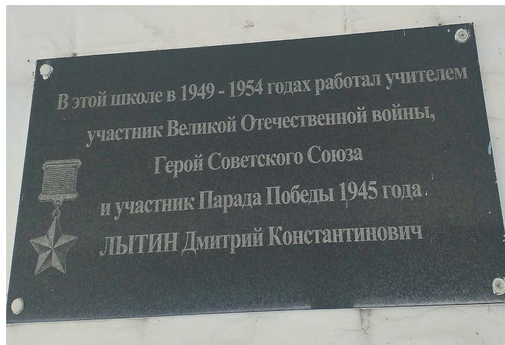
Мемориальная доска в честь Героя Советского Союза Дмитрия Константиновича Лытина, участника Парада Победы в г. Москве, установлена на здании школы с. Никольск, ул. Комсомольская, 13