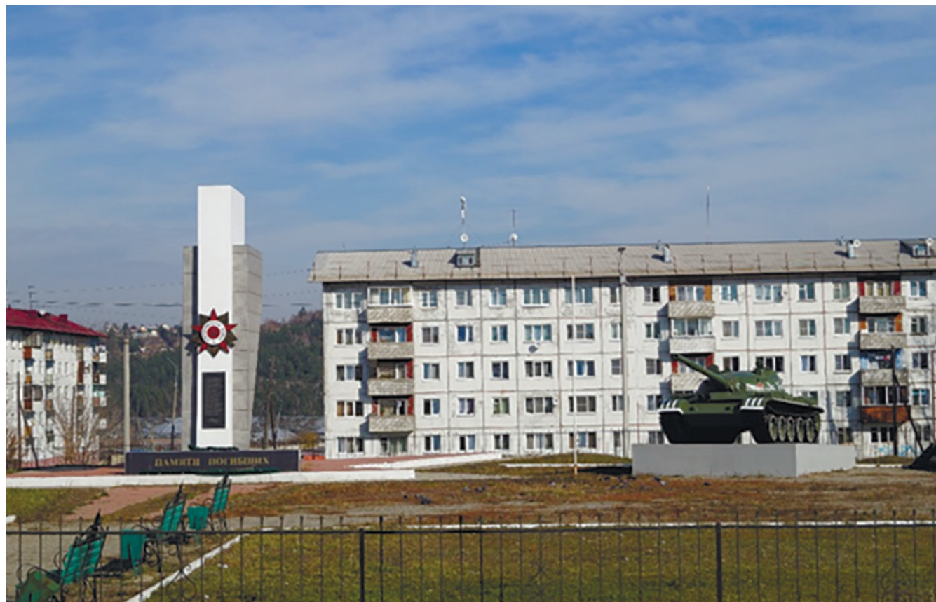
Парковая зона в честь воинов, погибших на фронтах Великой Отечественной войны, р. п. Маркова, 2018 г.

В 2018 г. на мемориальной площадке был установлен танк Т-62 № 504В049, переданный в собственность поселения Министерством обороны РФ в качестве памятника в честь 73-й годовщины Победы в Великой Отечественной войне.