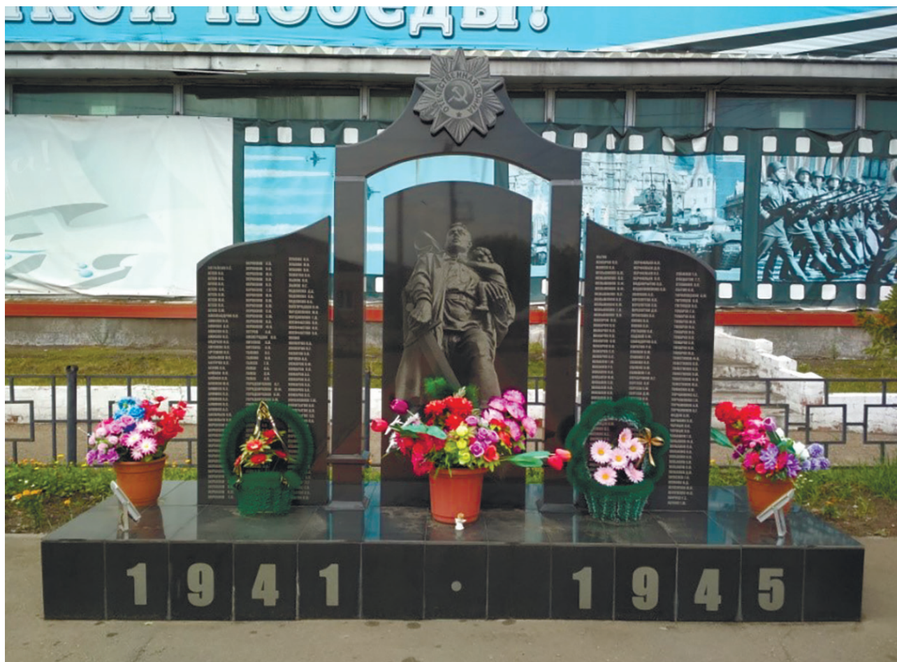
Памятник воинам-землякам, погибшим на фронтах Великой Отечественной войны 1941–1945 гг., с. Оёк, ул. Кирова, 91г, 2014 г.