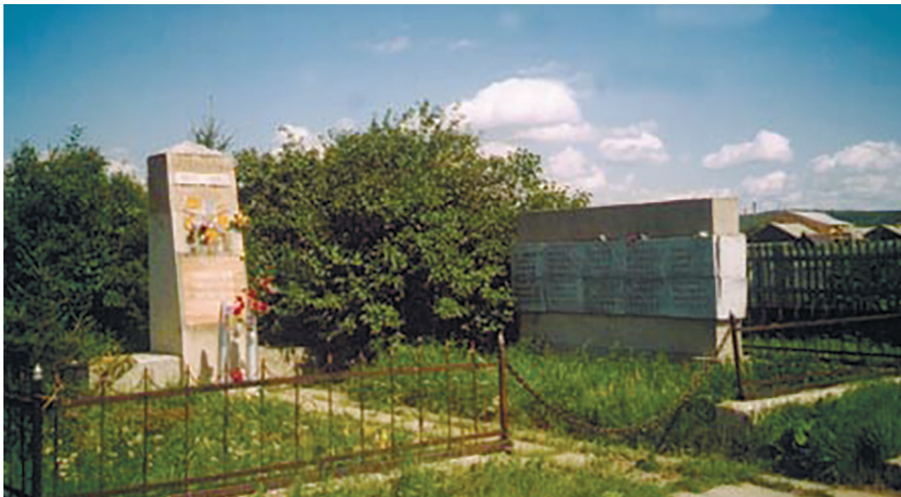
Мемориал Памяти в с. Смоленщина, ул. Зои Космодемьянской, 3, 1980 г.