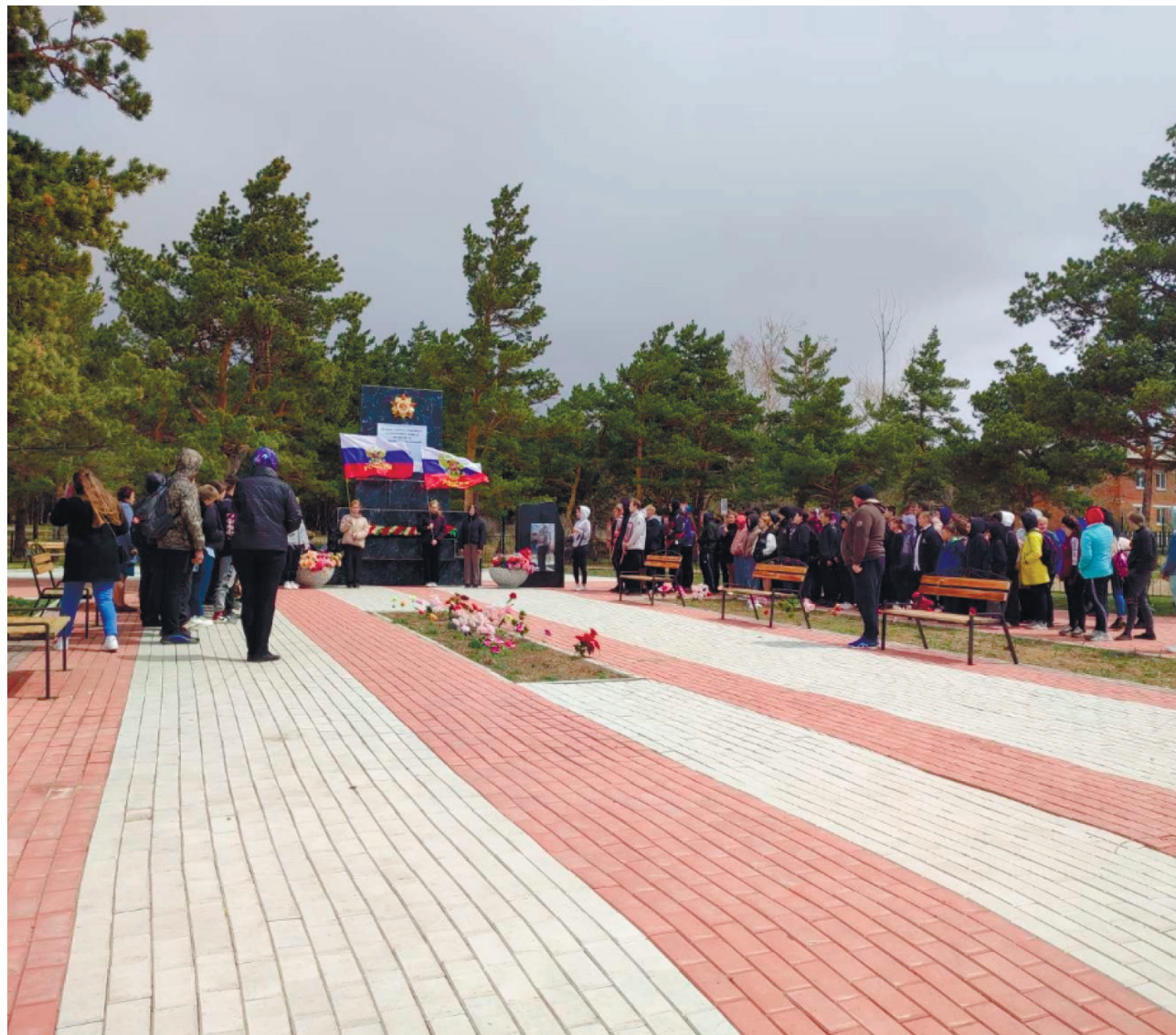
Парк Победы и Памятник воинам Великой Отечественной войны, с. Никольск, пл. Комсомольская, 2021 г.