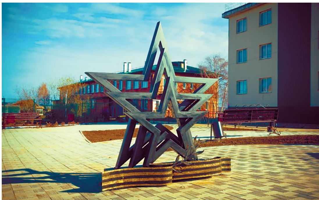
Малая архитектурная форма «Звёзды» в парке Победы, с. Хомутово, ул. Чапаева, 2020 г.