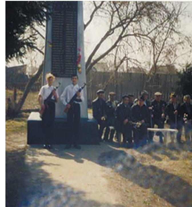
Памятник воинам Великой Отечественной войны, с. Максимовщина, ул. Советская, 13, 1967 г.