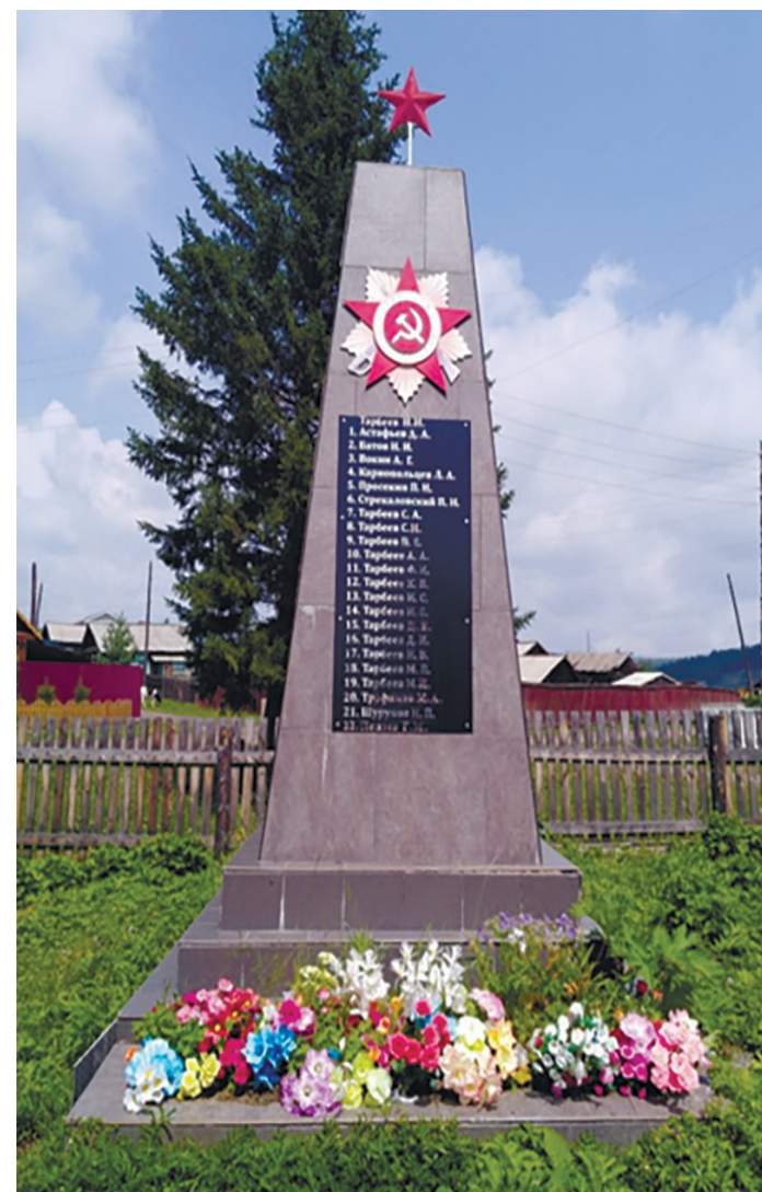
Обелиск памяти воинов, павших в боях в годы Великой Отечественной войны, с. Малое Голоустное, ул. Байкальская, 15

В 2015 г. в селе, на площади перед администрацией Голоустненского МО, на ул. Мира, 26а, был возведён Мемориал памяти ветеранов Великой Отечественной войны, умерших в мирное время.