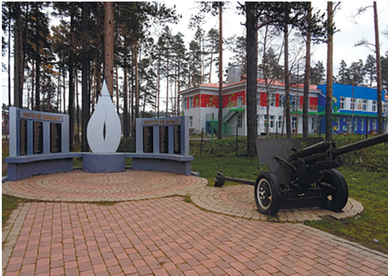
Обелиск павшим воинам-землякам, участникам Великой Отечественной войны, с. Пивовариха, ул. Дачная, 6