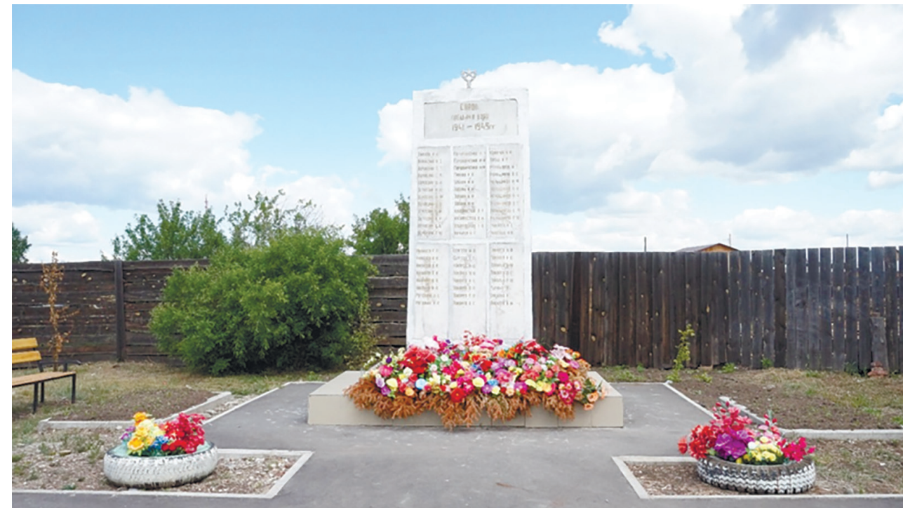
Памятник воинам-землякам, погибшим на фронтах Великой Отечественной войны, д. Бутырки, ул. Молодёжная, 1