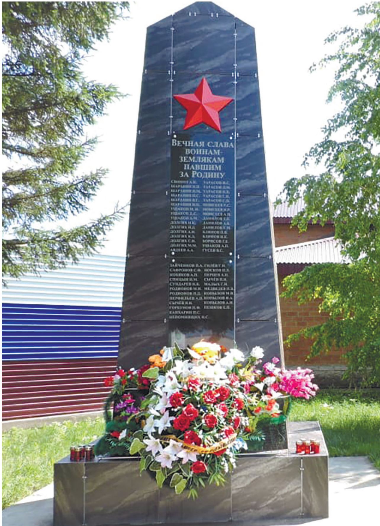
Памятник воинам-землякам, с. Максимовщина, ул. Советская, 13, 2015 г.

К 70-летию Великой Победы 9 мая 2015 г. обелиск был реконструирован. Памятник облицевали плиткой, обновили надписи фамилий героев-земляков, заменили ограждение.