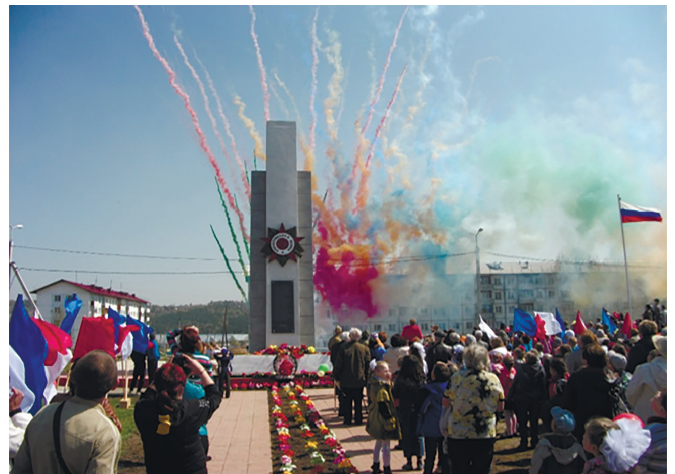
Стела воинам-землякам, погибшим в годы Великой Отечественной войны, р. п. Маркова, ул. Мира.