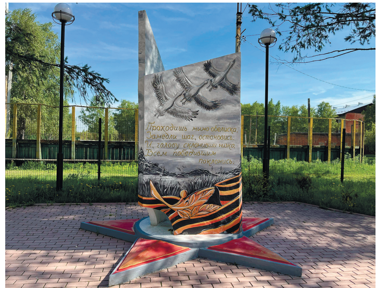
Аллея Победы, пос. Молодёжный, 2024 г.

В центральной части комплекса установлен мемориал, посвященный всем солдатам Великой Отечественной войны и труженикам тыла. На мемориале изображены три журавля, взмывающих в небо, и четверостишие, посвящённое воинам-землякам.