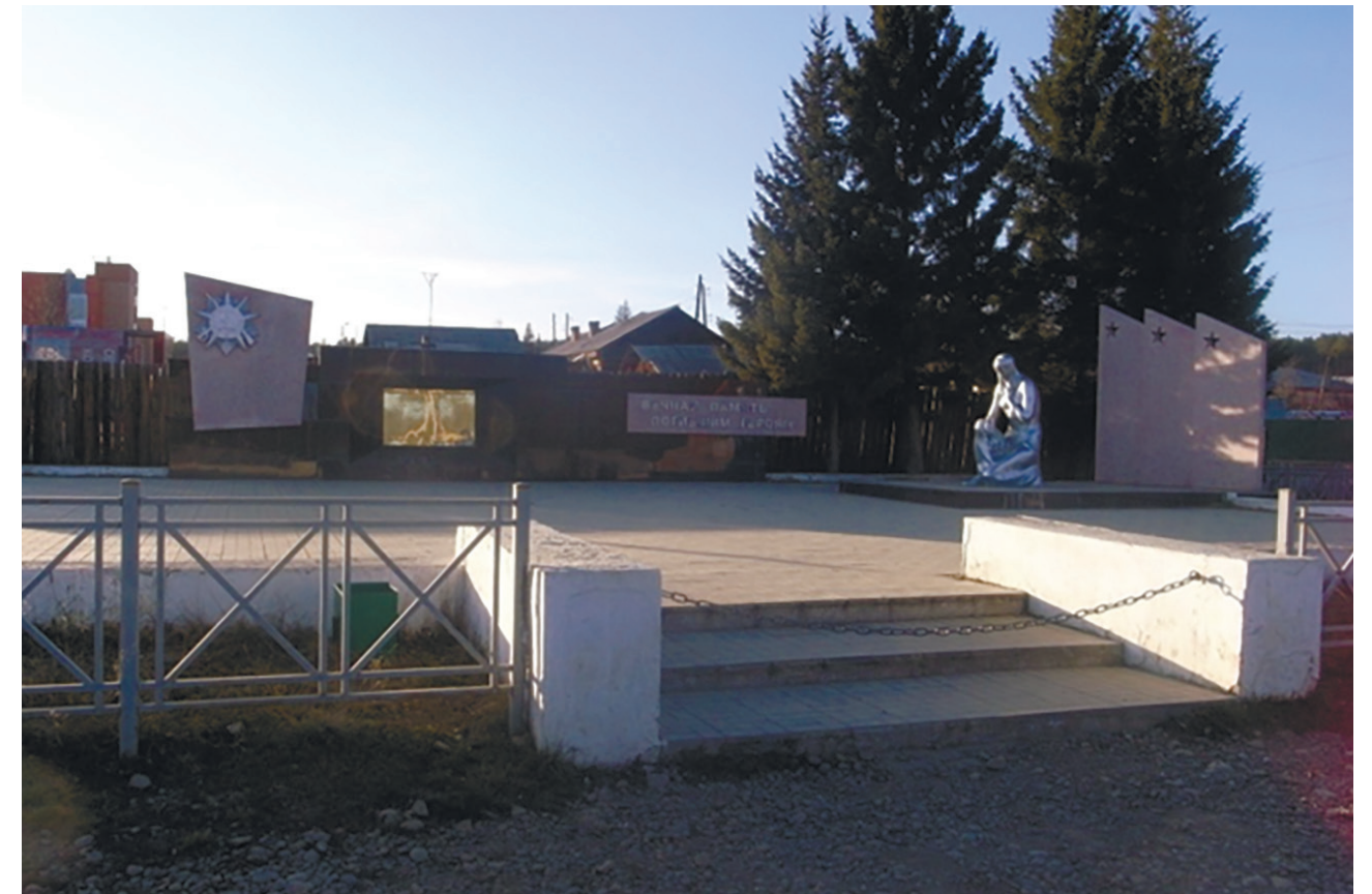
Мемориал воинам-землякам, погибшим в годы Великой Отечественной войны, пос. Горячий Ключ, ул. Коммунистическая, 27