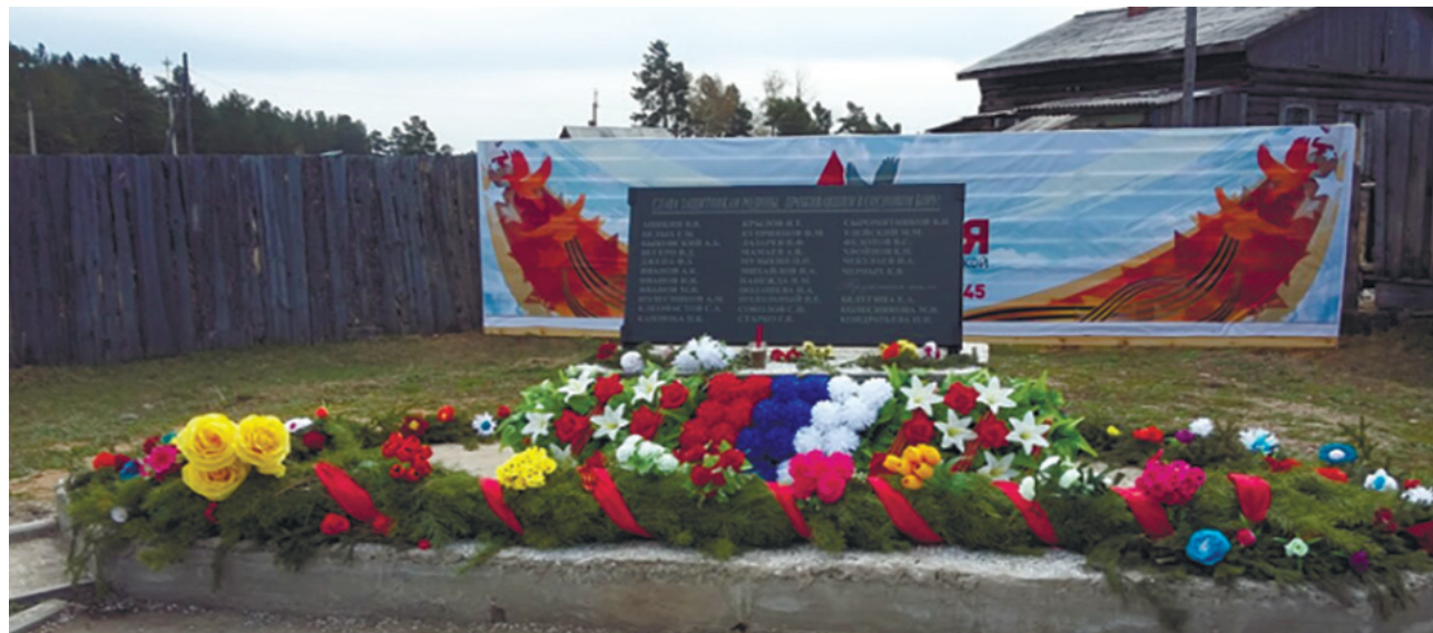
Памятник защитникам Родины, проживавшим в д. Сосновый Бор