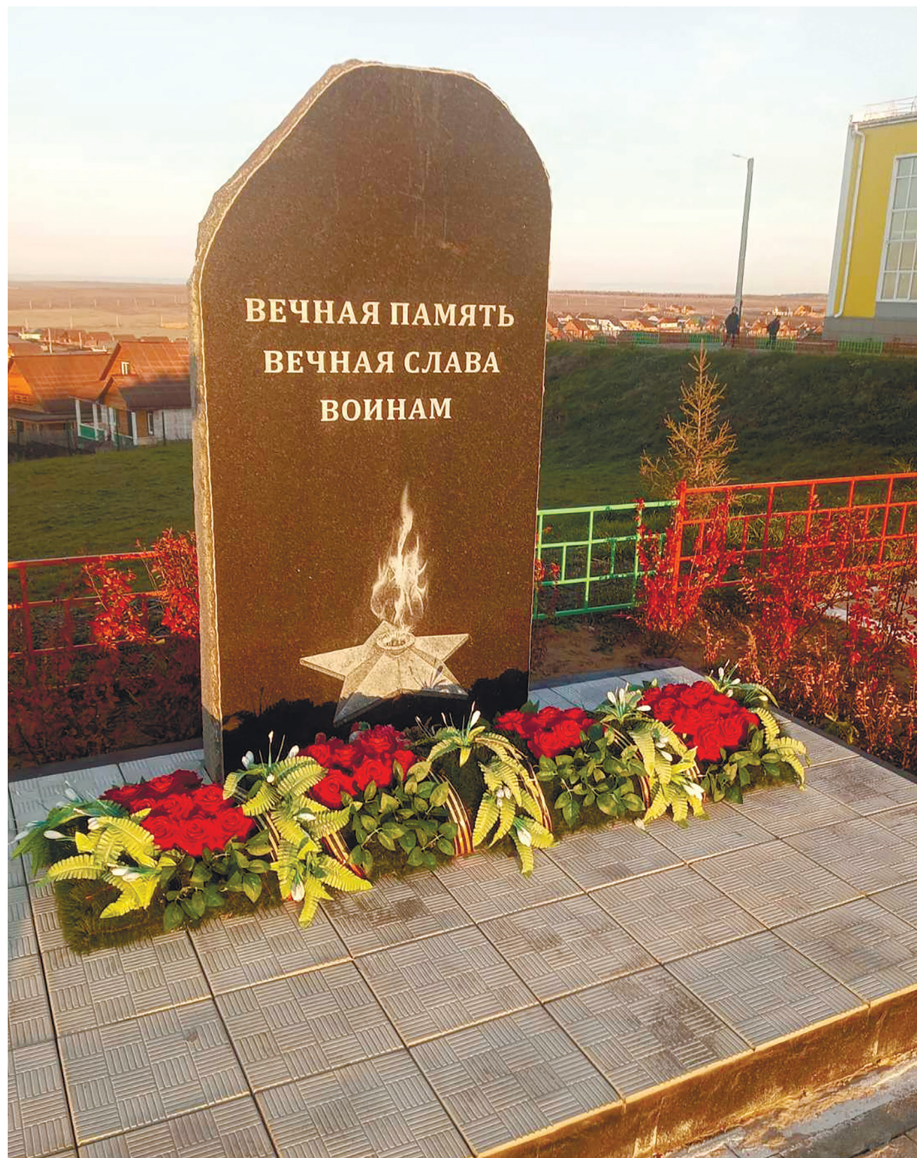
Памятник воинам-землякам «Вечная память. Вечная слава воинам», д. Грановщина, территория Грановской СОШ, 8 мая 2024 г.

8 мая 2024 г. на территории Грановской средней школы в Уриковском МО состоялось торжественное открытие памятника воинам-землякам «Вечная память. Вечная слава воинам». Мемориал был возведен на средства, собранные родителями, педагогами школы и жителями д. Грановщины.