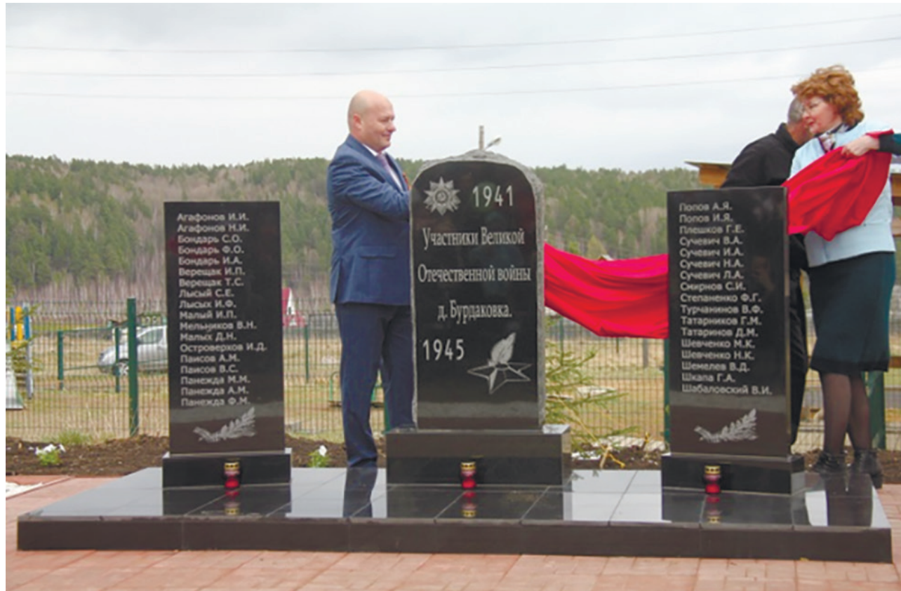
Мемориальный комплекс воинской славы, д. Бурдаковка, ул. Лесная, 7а, 2019 г.