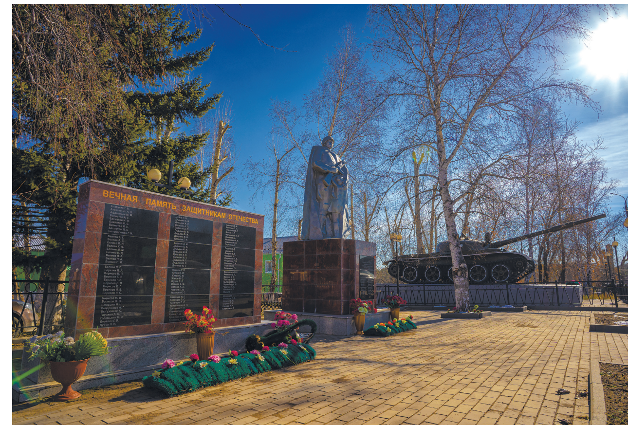
Мемориал Славы, д. Карлук, ул. Гагарина, 4, фото Павла Крутенко, 2024 г.

На территории Мемориала Славы в сентябре 2016 г. была произведена установка мемориальной плиты с фамилиями двадцати одного участника Великой Отечественной войны, уроженцев д. Карлук.