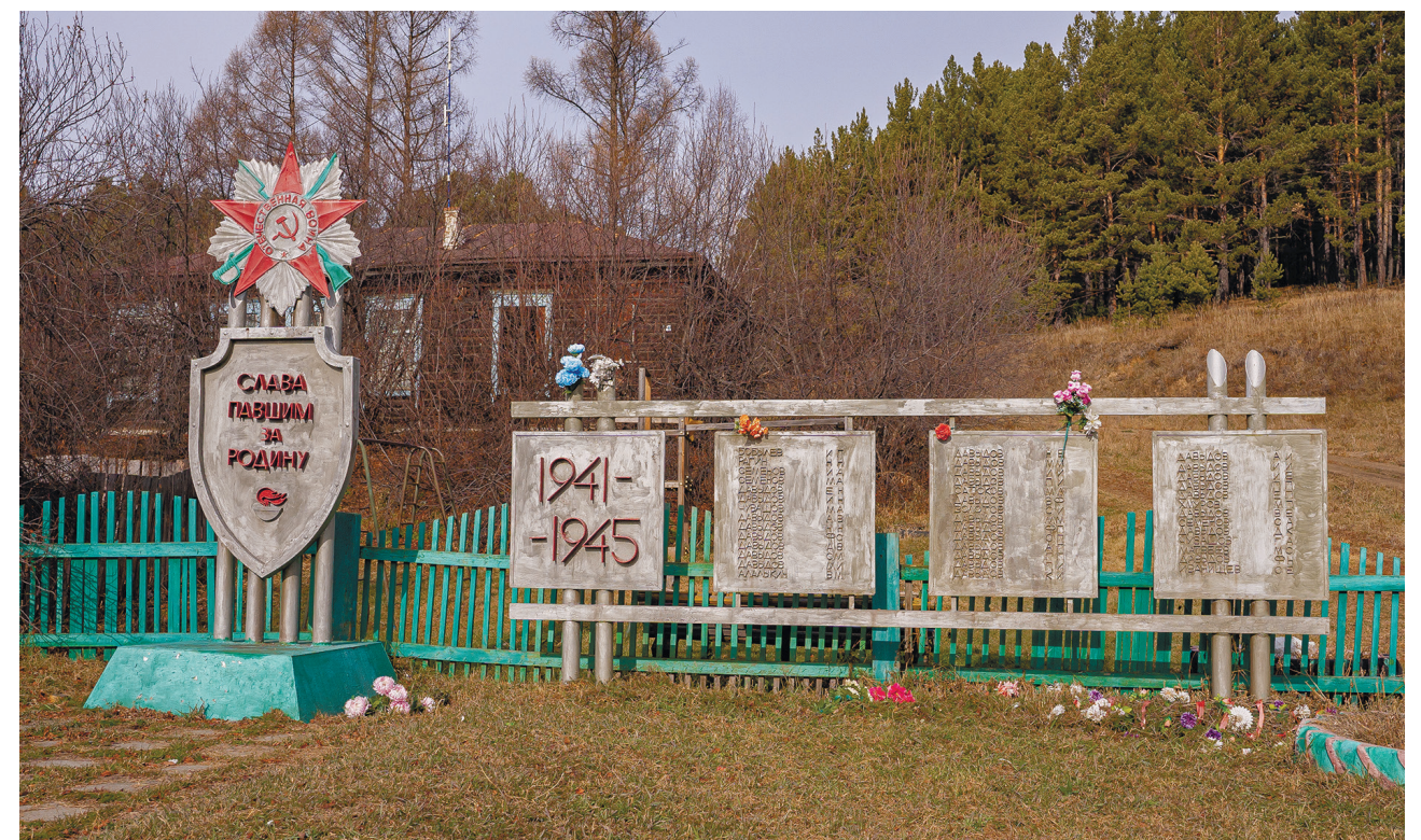
Памятная плита воинам-землякам, д. Тихонова Падь, ул. Центральная, 2024 г.

Территория памятника облагораживается силами жителей и администрации Ширяевского МО.