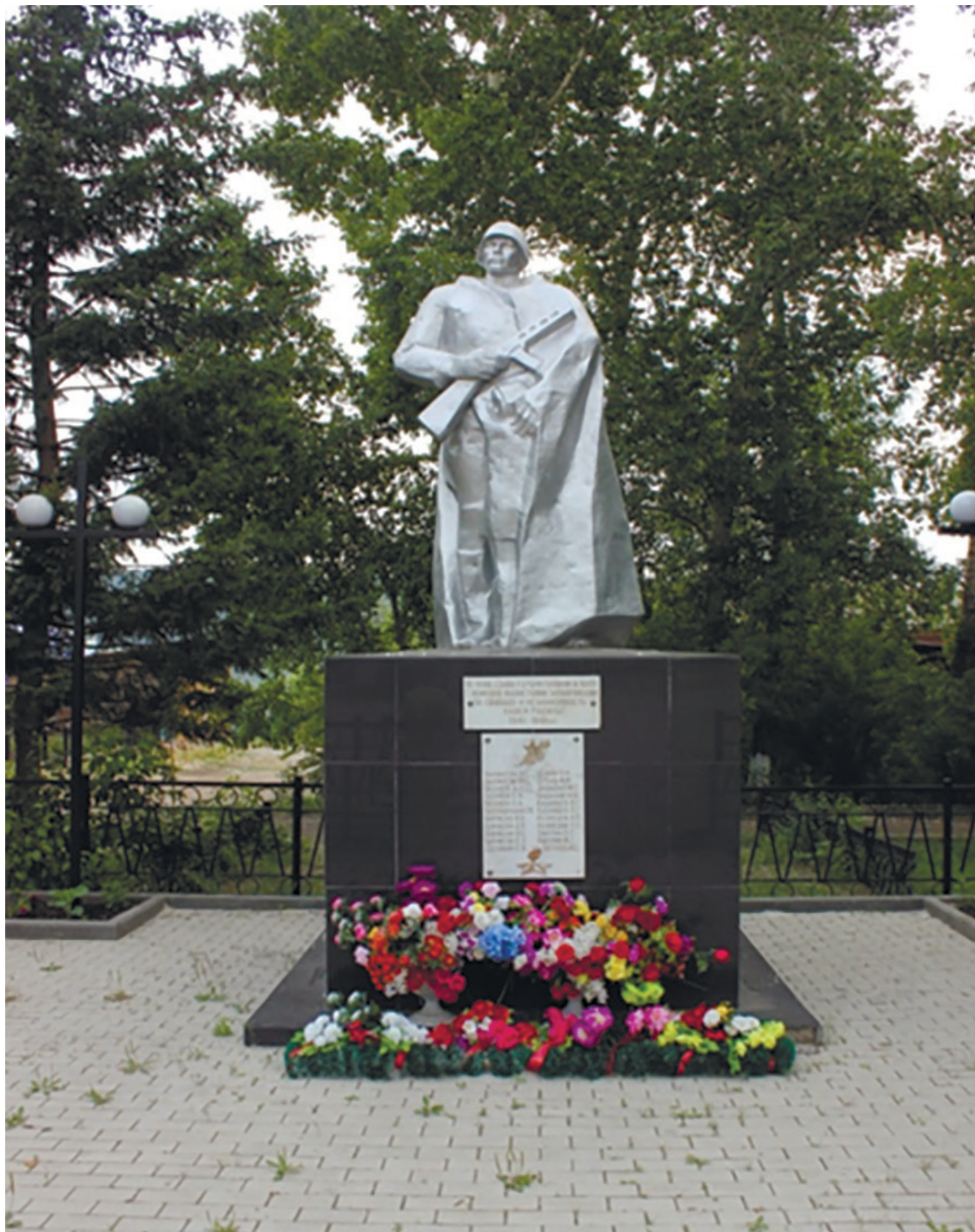
Памятник солдату. Установлен к 70-летию Победы в Великой Отечественной войне, д. Карлук, ул. Гагарина, 4, 2015 г.

В 2015 г. к 70-летию Великой Победы проведены ремонтные работы: облицовка постамента мраморной плиткой, был изготовлен постамент для установки танка Т-62. Доставлен танк из г. Красноярска.