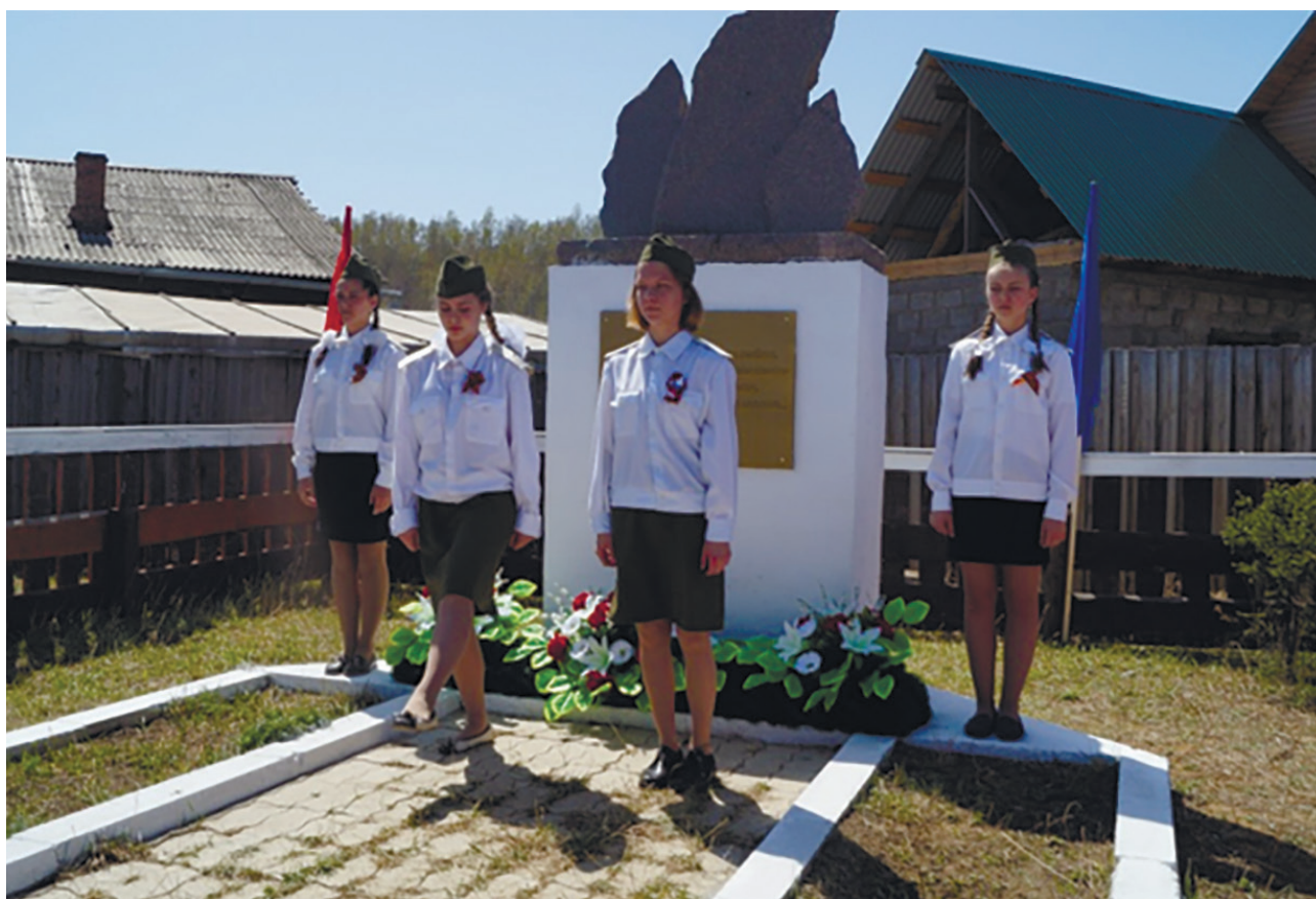
Аллея Победы и мемориал памяти ветеранам Великой Отечественной войны, д. Столбова