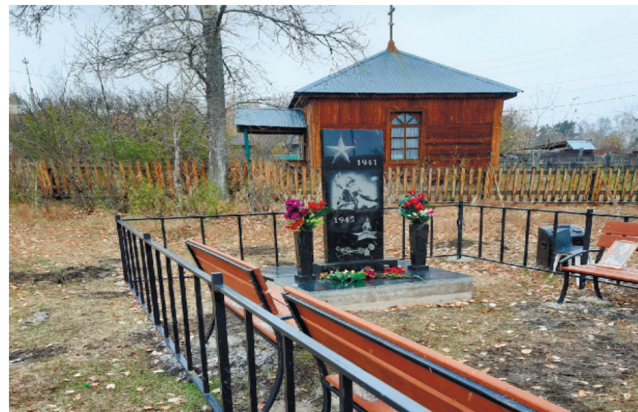
Сквер памяти, д. Кыцигировка, ул. Цветочная, 2022 г.