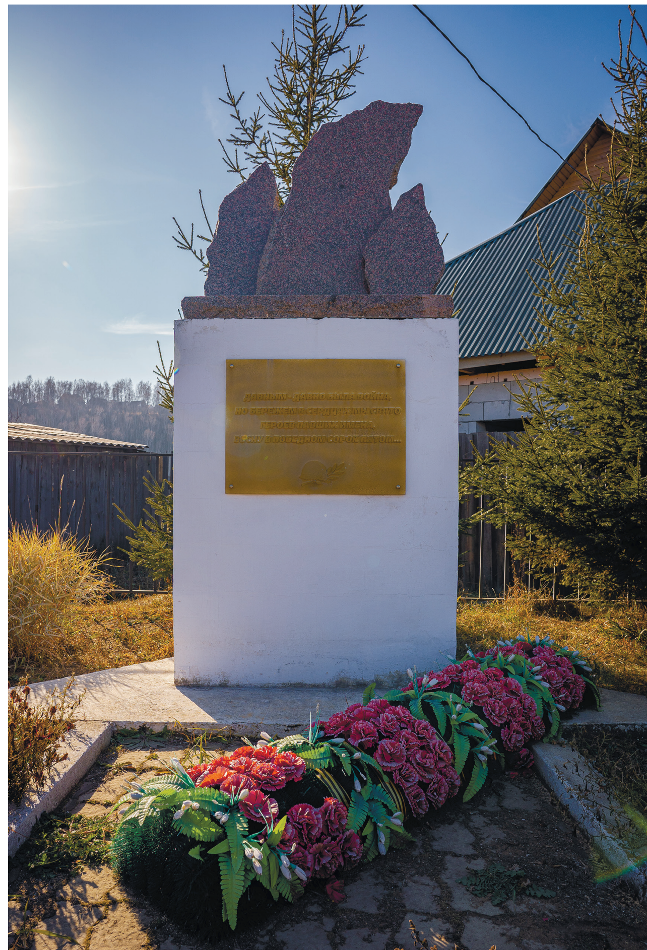
Аллея Победы и мемориал памяти ветеранам Великой Отечественной войны, д. Столбова 2024 г.