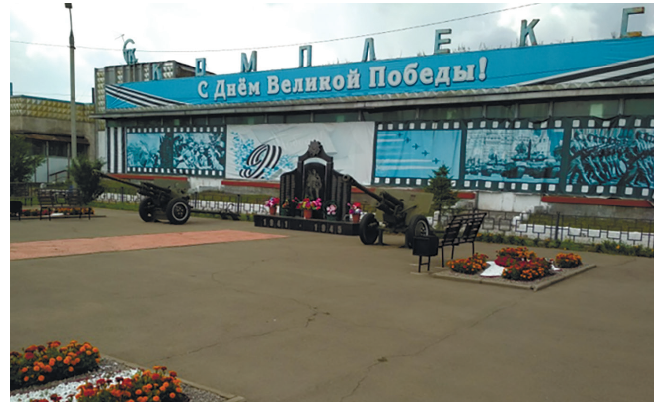
Площадь в честь воинов-земляков, погибших на фронтах Великой Отечественной войны 1941–1945 гг., с. Оёк

В 2014 г. был установлен новый мемориал в центре села по программе «Народные инициативы» и на средства администрации Оёкского муниципального образования. Автор проекта Полищенко В. В. На памятнике нанесены 269 фамилий воинов, погибших в годы Великой Отечественной войны. Все эти годы жители бережно охраняют память воинов, отдавших жизнь за Родину.