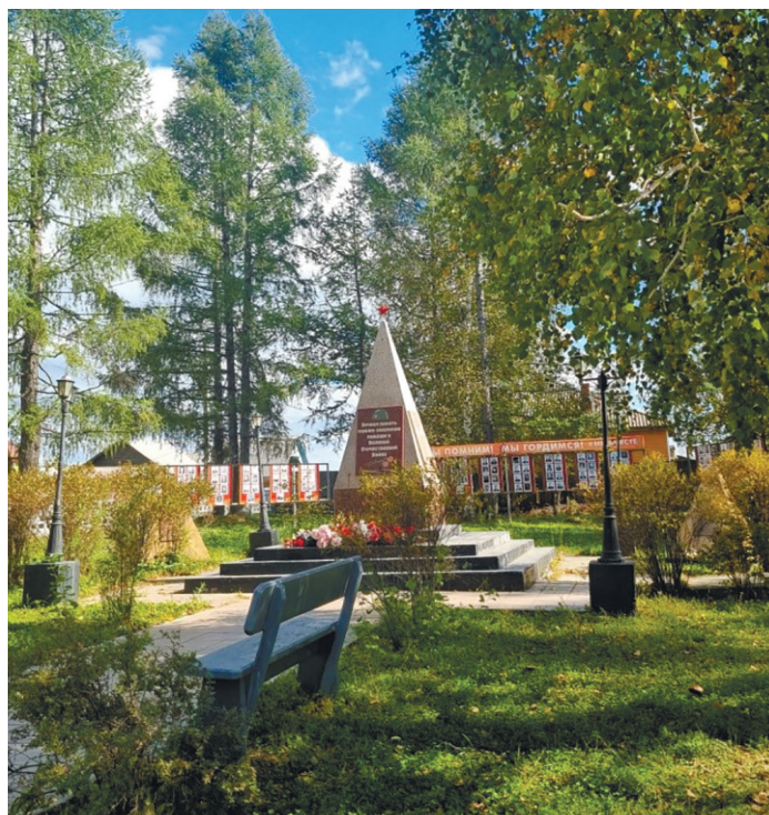
Сквер Славы, п. Большая Речка, ул. Ленина, 8, 2024 г.