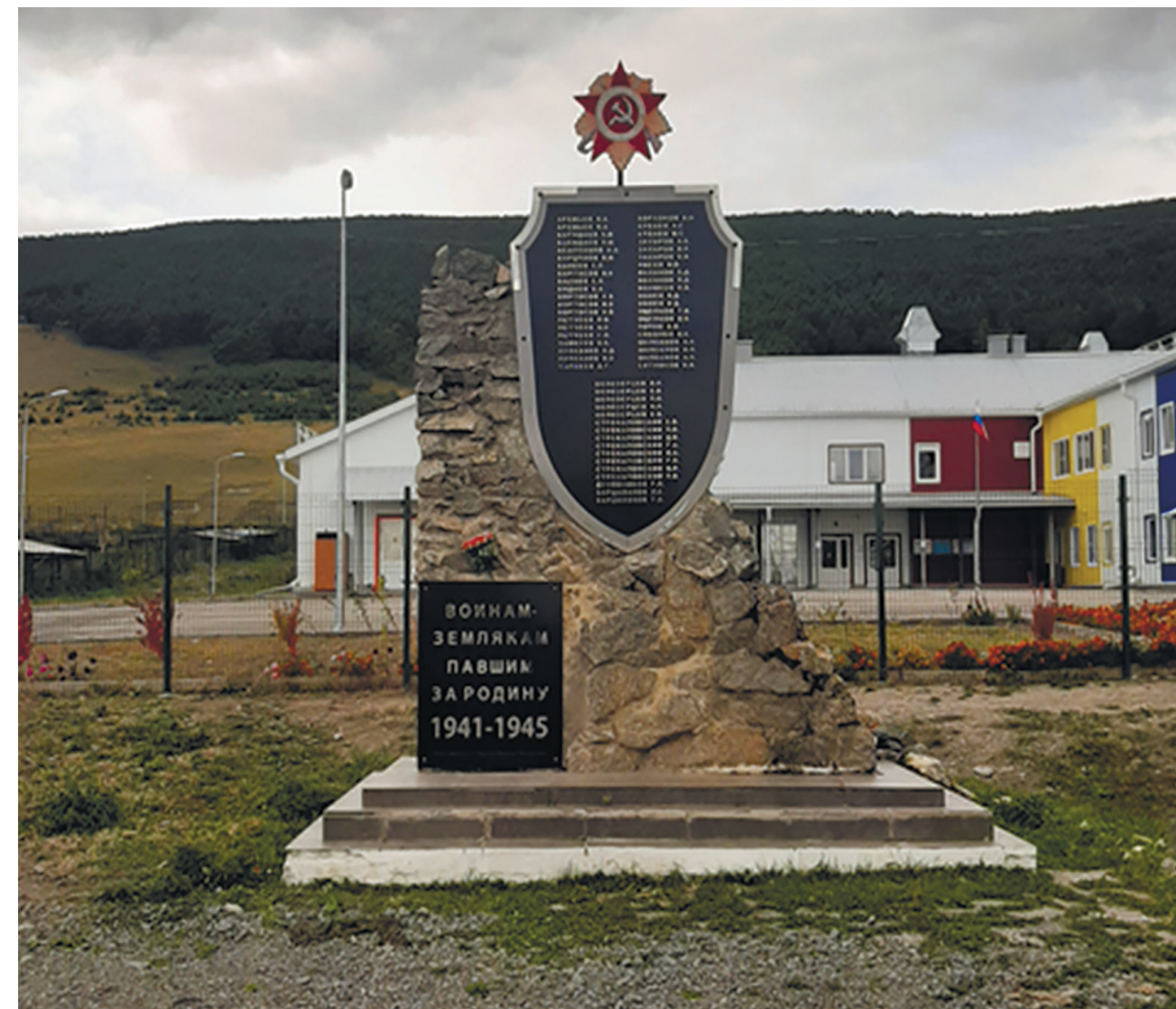
Обелиск в память о воинах-земляках, павших за Родину в Великой Отечественной войне, у школы пос. Большое Голоустное, ул. Кирова, 54