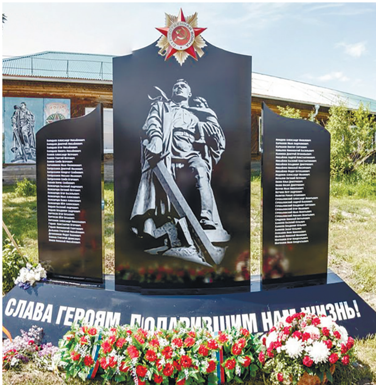
Мемориал памяти ветеранов Великой Отечественной войны, пос. Большое Голоустное, ул. Кирова, 54

На новом обелиске вбита 61 фамилия. Молодежь и все, кто бывает в пос. Большое Голоустное, должны видеть и помнить, что память продолжается (из сообщения пресс-службы администрации Иркутского района 23 июня 2020 г.).