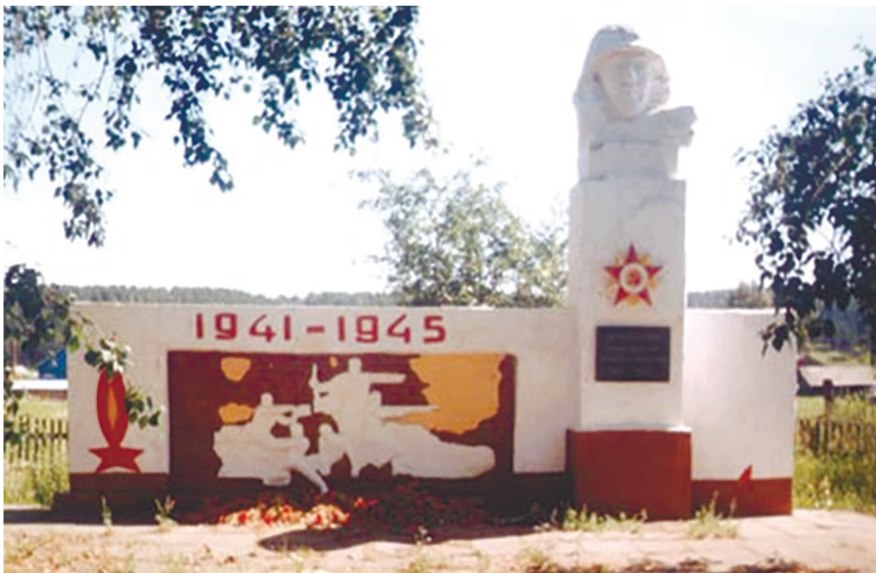
Памятник Героям Великой Отечественной войны, не вернувшимся с полей сражений, д. Ширяева, ул. Ленина, 26, 1971 г.