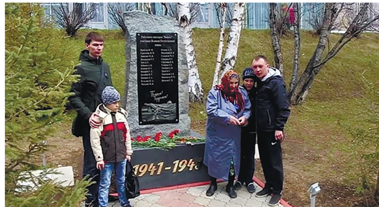
Мемориал памяти ветеранов Великой Отечественной войны в р. п. Листвянка на территории санатория «Байкал» ФСБ России, р. п. Листвянка

С момента основания учреждения (1961 г.) в нем работали 26 участников ВОВ. Мемориал создан и установлен на средства, собранные коллективом учреждения (из сообщения пресс-службы УФСБ России по Иркутской области).