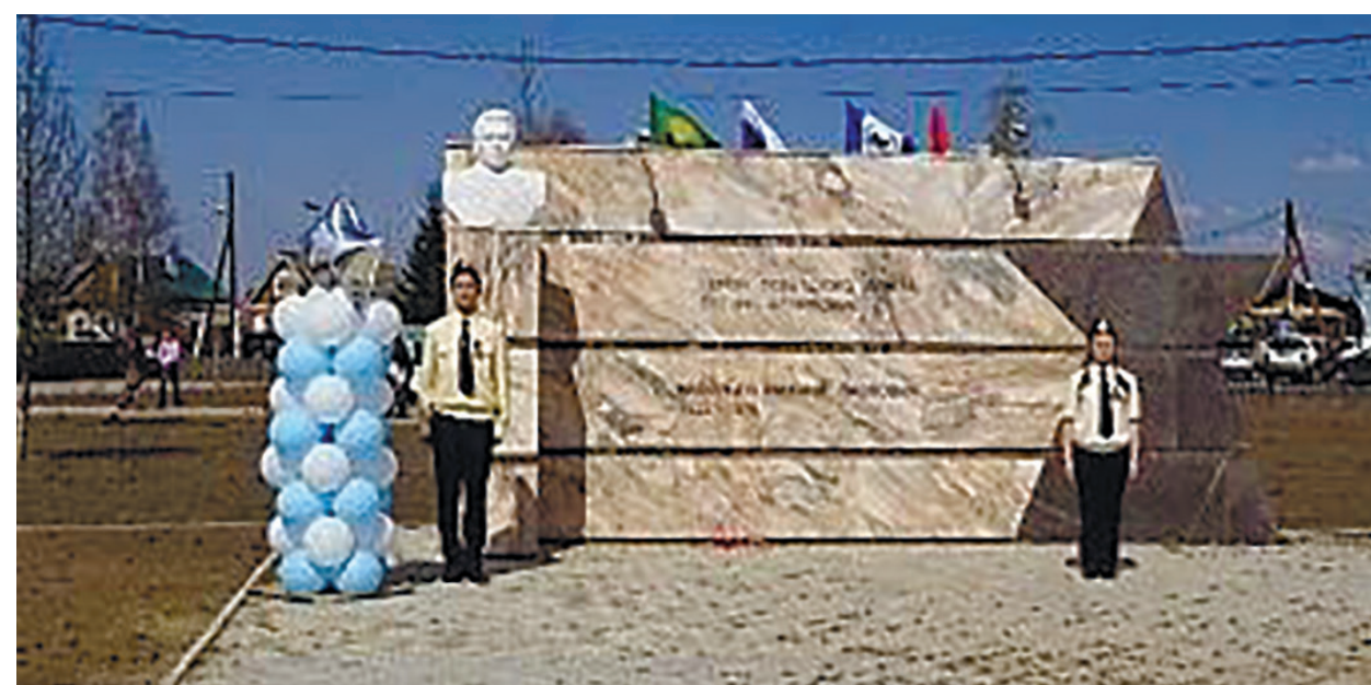
Памятник Герою Советского Союза летчику-истребителю Васильеву Михаилу Павловичу, отреставрирован в 2017 г

Памятник Герою Советского Союза летчику-штурмовику Михаилу Павловичу Васильеву