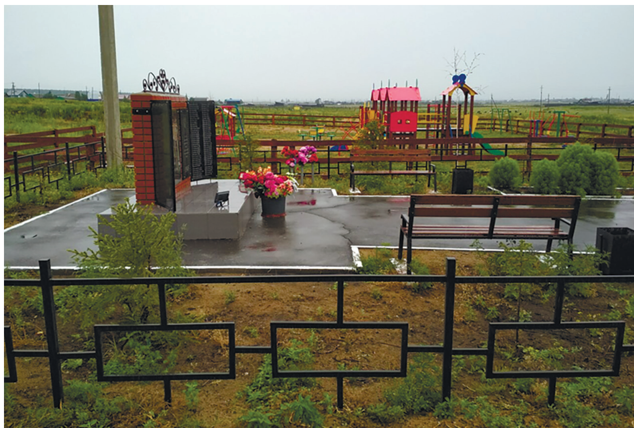
Аллея Славы в честь воинов, погибших в годы Великой Отечественной войны, д. Галки, ул. Первомайская