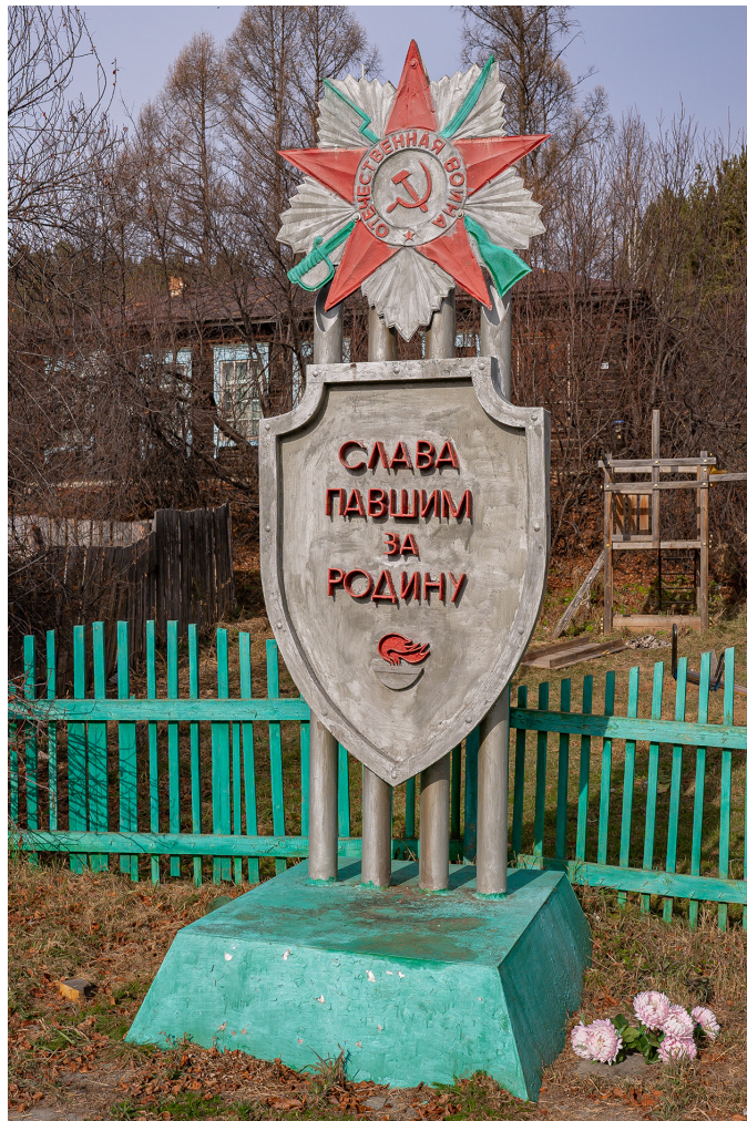
Памятная плита воинам-землякам, д. Тихонова Падь, ул. Центральная, 2024 г.