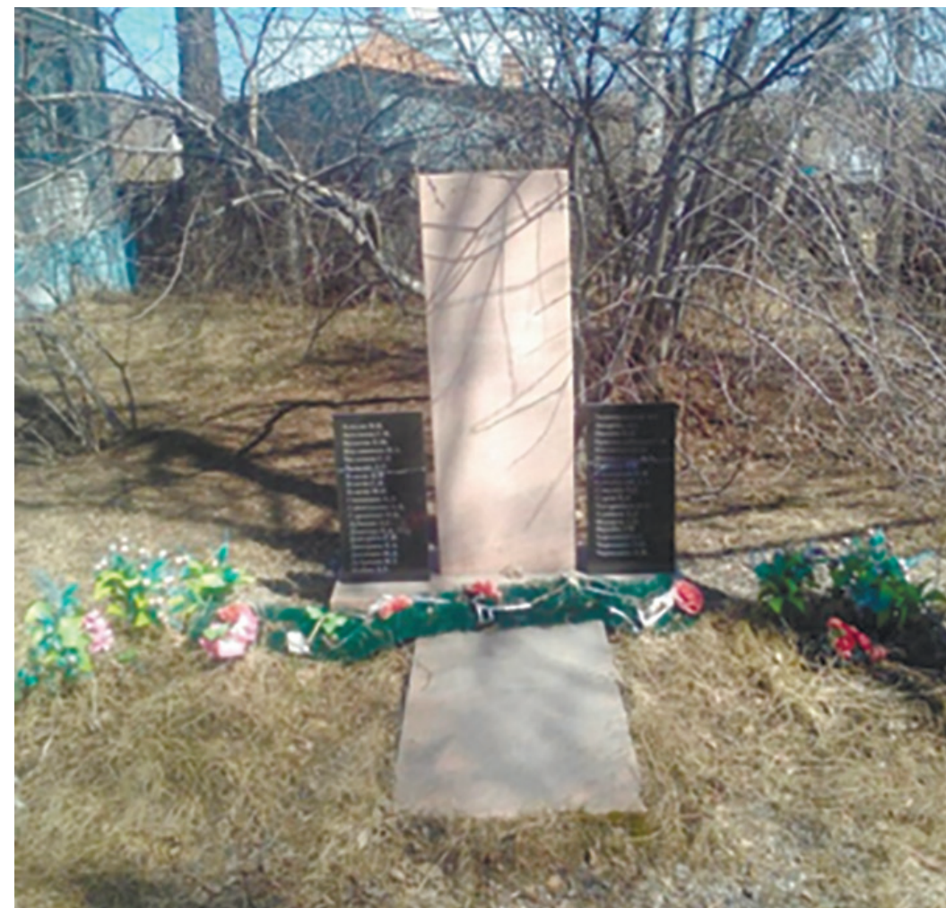
Памятник воинам – участникам Великой Отечественной войны, пос. Падь Мельничная, пер. Тракторный, 1