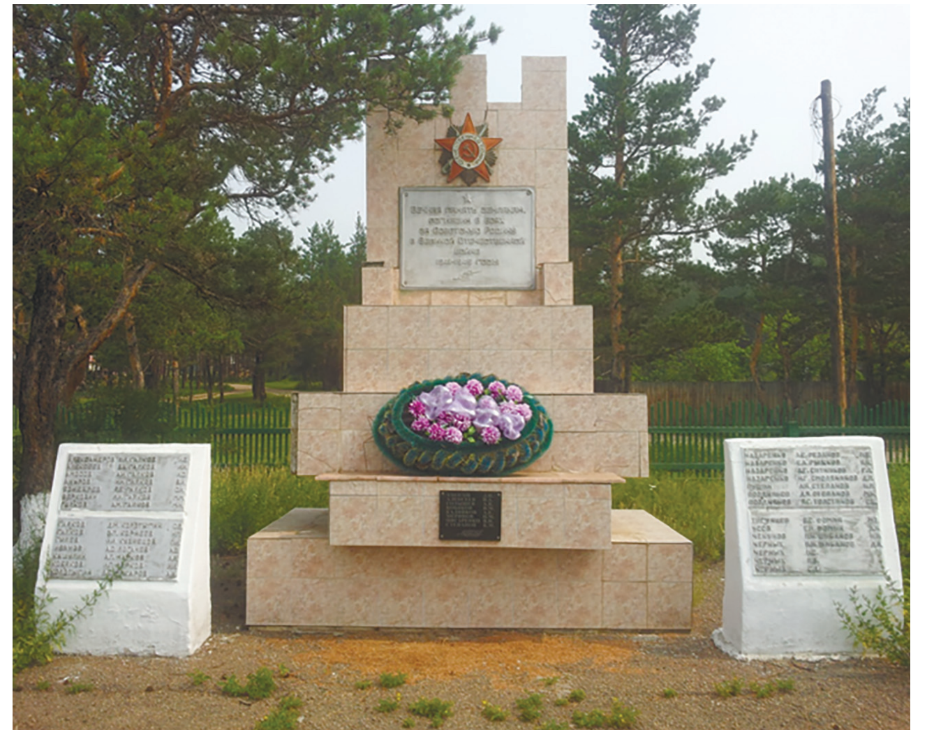
Памятник землякам, погибшим в боях за Советскую Родину в Великой Отечественной войне 1941–1945 гг., с. Никольск, ул. Комсомольская, 13, 1985 г.

В рамках федерального проекта «Формирование комфортной городской среды» 17 ноября 2021 г. в с. Никольск был обновлен мемориал и благоустроен Парк Победы в честь участников Великой Отечественной войны. При реконструкции уложена плитка, установлены скамейки и урны, по обеим сторонам памятника установлены плиты с именами 167 земляков, не вернувшихся с фронта.