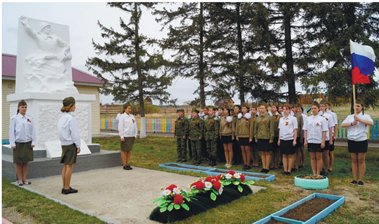
Памятник воину-освободителю, д. Москвизина, ул. Центральная, 33 (после обновления)