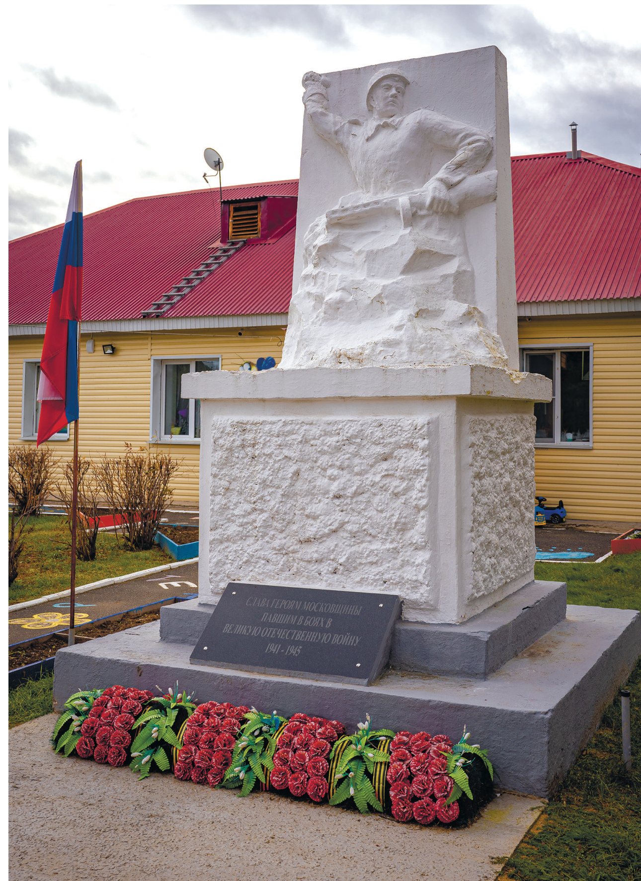
Памятник воину-освободителю, д. Московщина, ул. Центральная, 33, 2024 г.