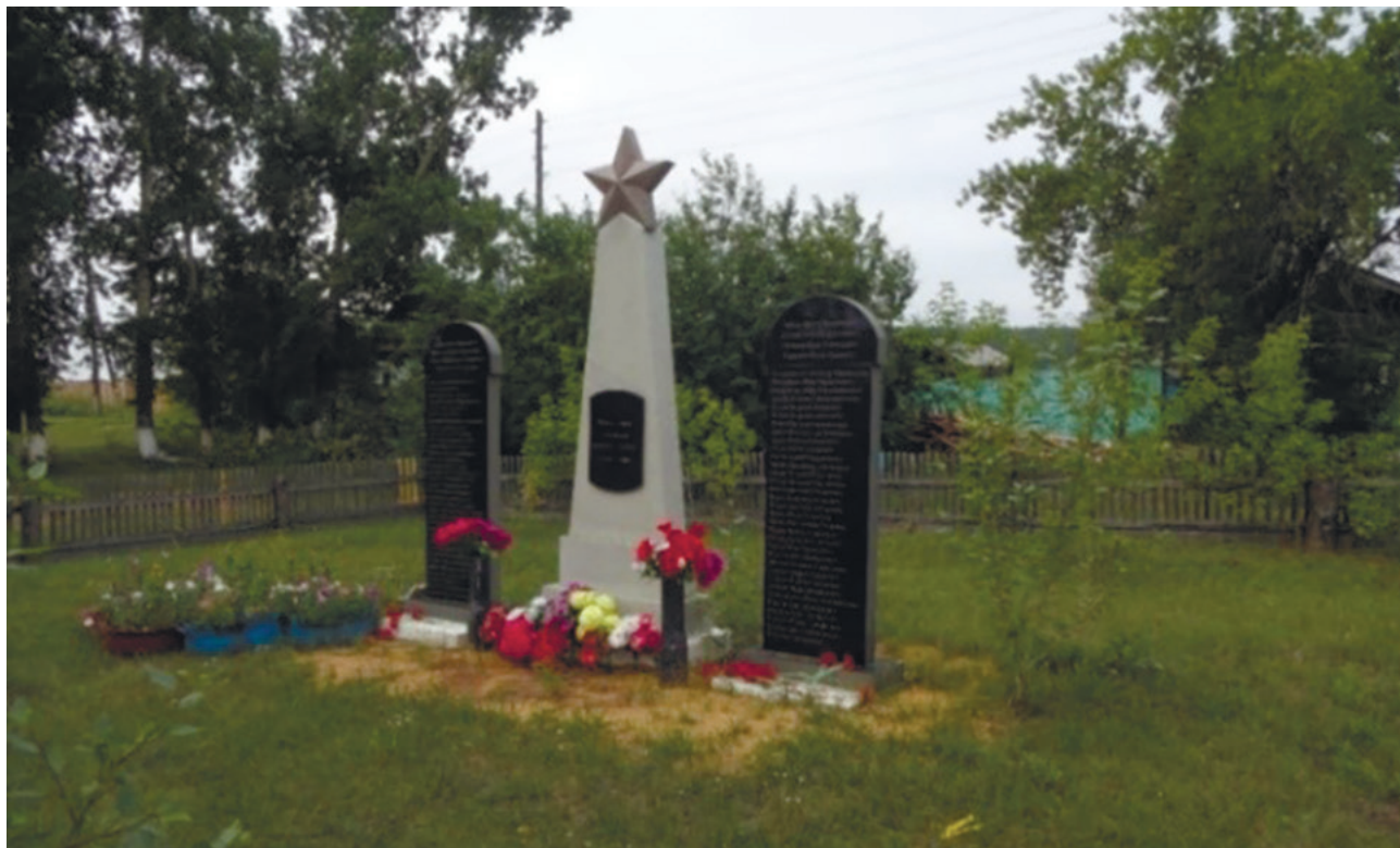
Памятник воинам-односельчанам, д. Лыловщина, 2012 г.