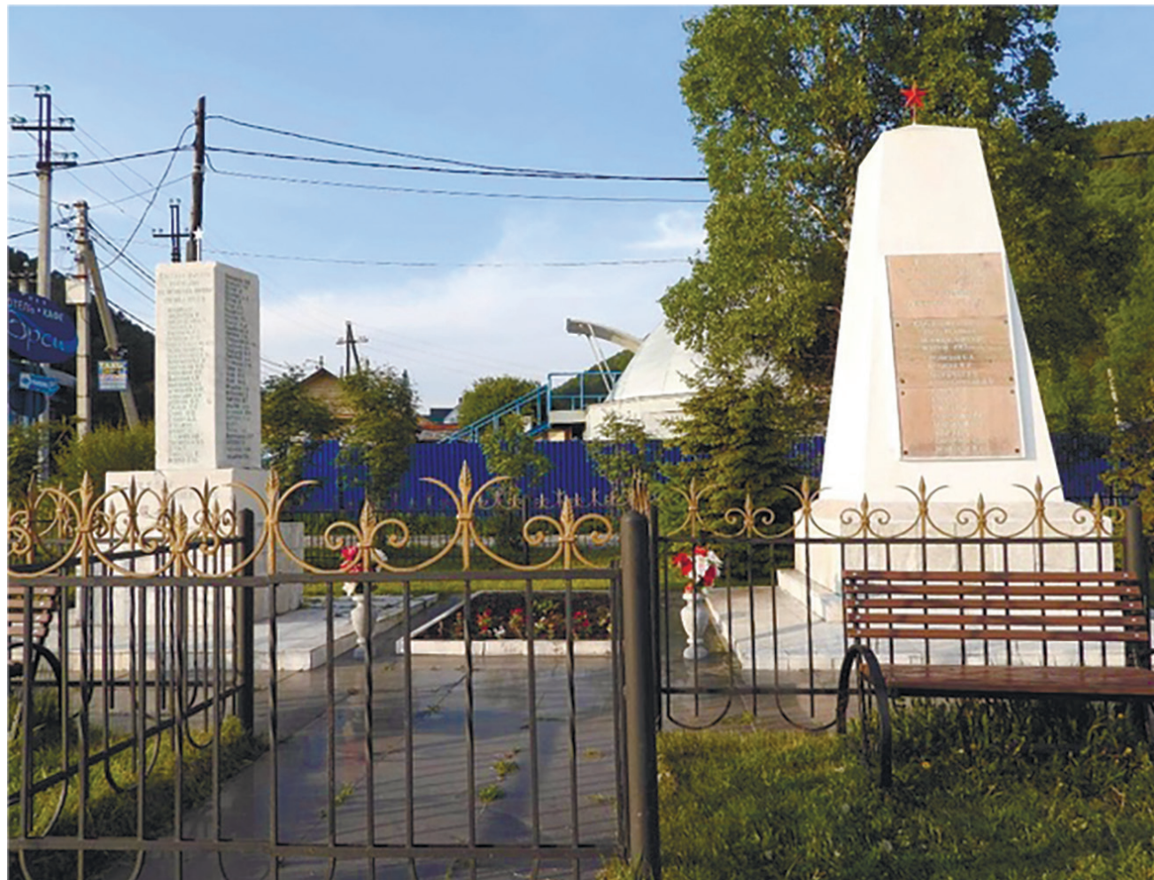
Обелиск в память о земляках, погибших в годы Гражданской войны, во время Великой Отечественной войны 1941–1945 гг., р. п. Листвянка, перекресток ул. Горького и Чапаева