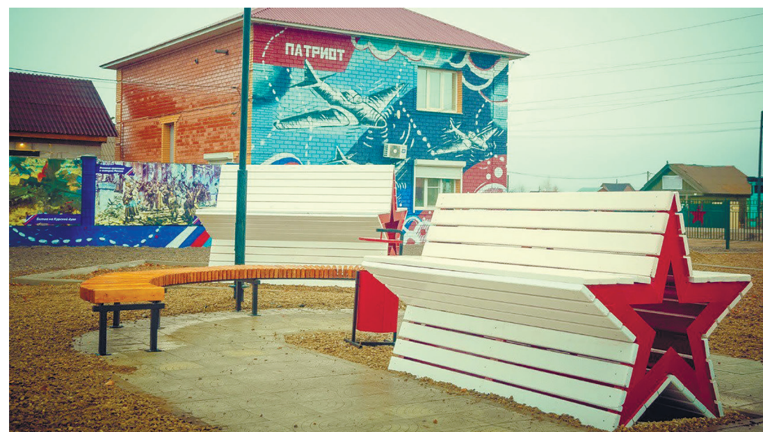
Аллея «Патриот», с. Хомутово, ул. Мичурина, 4, 2022 г.

В с. Хомутово, на ул. Мичурина, 4, 28 октября 2022 г. состоялось торжественное открытие аллеи.