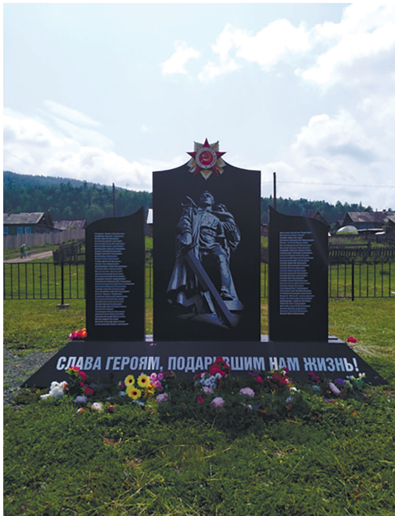
Мемориал памяти ветеранов Великой Отечественной войны, умерших в мирное время, с. Малое Голоустное, ул. Мира, 26а