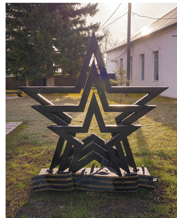
Малая архитектурная форма «Звёзды», с. Хомутово, ул. Кирова, 106

На территории обелиска Вечной Славы расположены: 76-мм дивизионная пушка ЗИС-3, реактивная система залпового огня «Град».