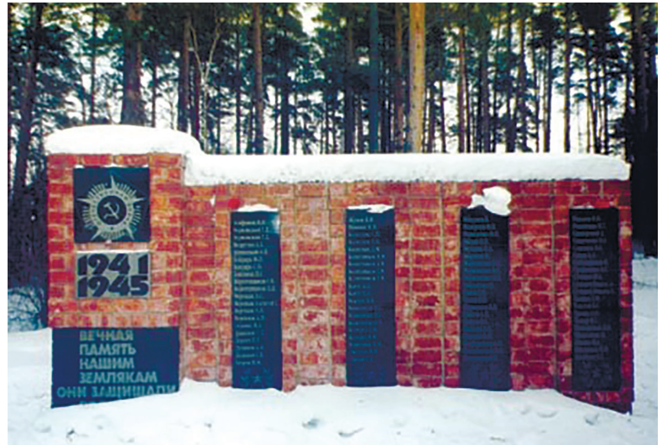
Обелиск павшим воинам-землякам, участникам Великой Отечественной войны 1941–1945 гг., с. Пивовариха, 1989 г.