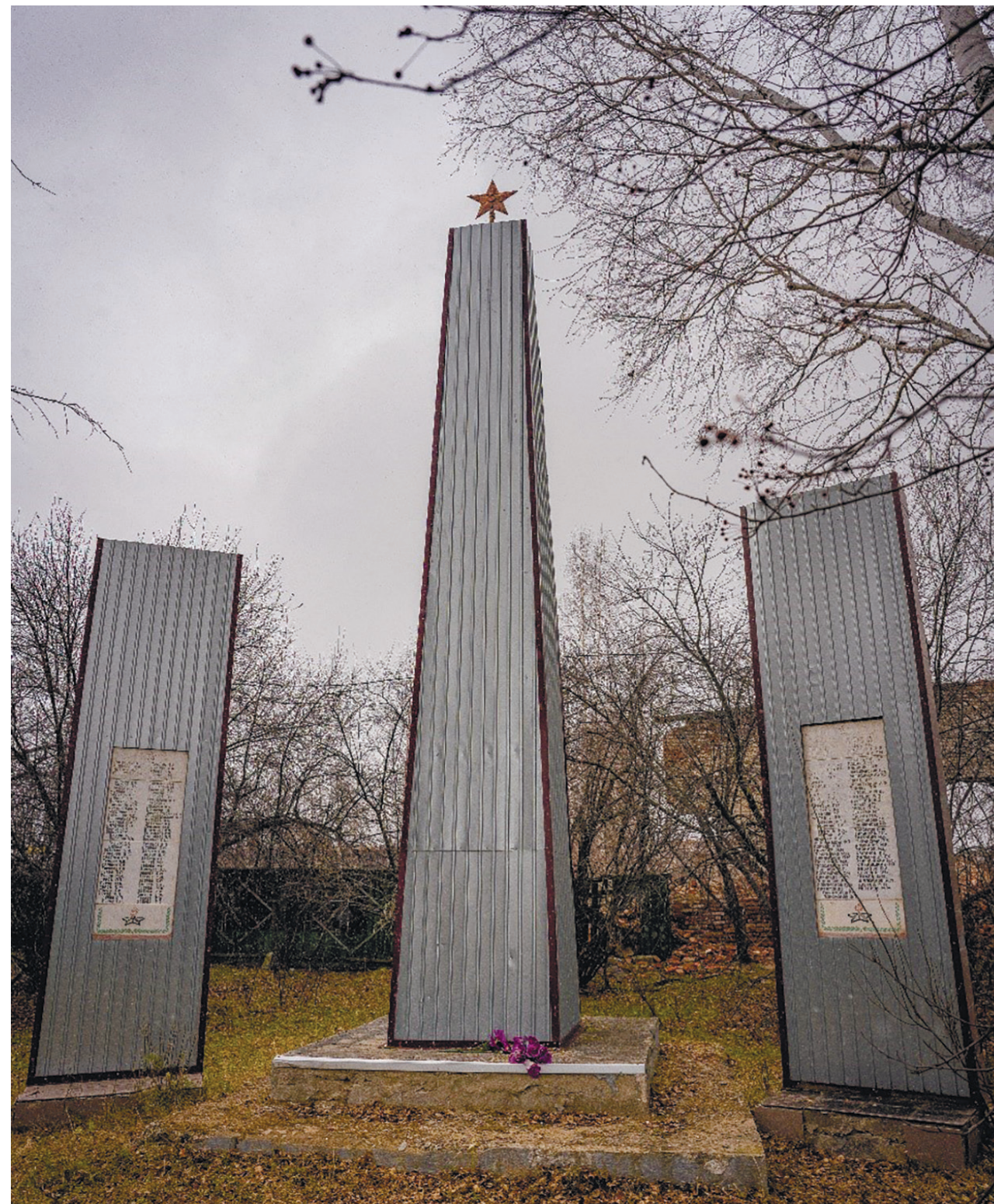
Памятник воинам-землякам, павшим в годы Великой Отечественной войны, с. Горохово, ул. Гагарина, 2024 г.