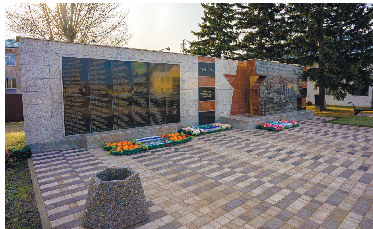
Обелиск Вечной Славы землякам-хомутовцам, павшим в боях Великой Отечественной войны, с. Хомутово, ул. Кирова, 106, 2024 г.