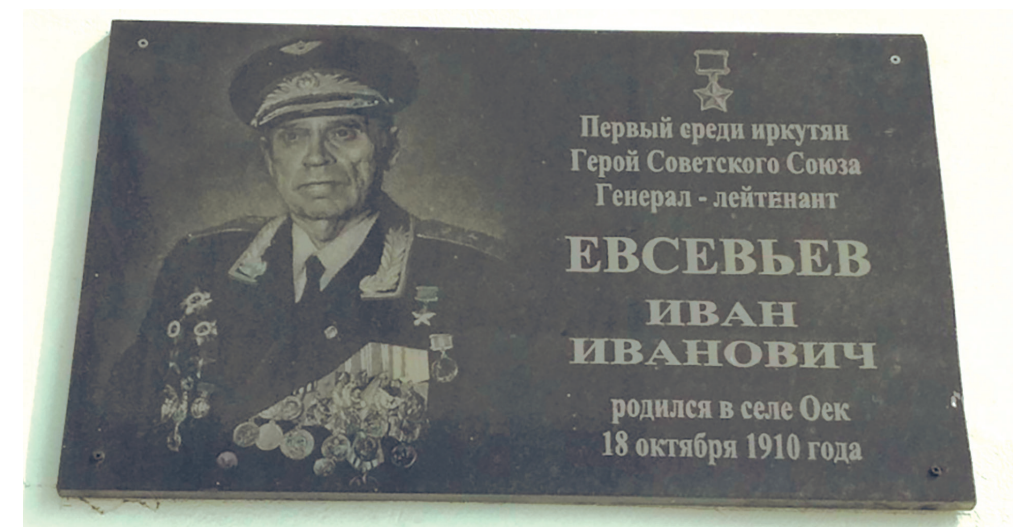
Мемориальная доска Герою Советского Союза генерал-лейтенанту Ивану Ивановичу Евсевьеву, уроженцу с. Оёк, 2010 г.

В с. Оёк на здании Социально-спортивного культурного комплекса в 2010 г. была установлена мемориальная доска Ивану Ивановичу Евсевьеву. На подвиге героев-земляков молодежь с. Оёк воспитывается в духе патриотизма, любви к своей Родине.