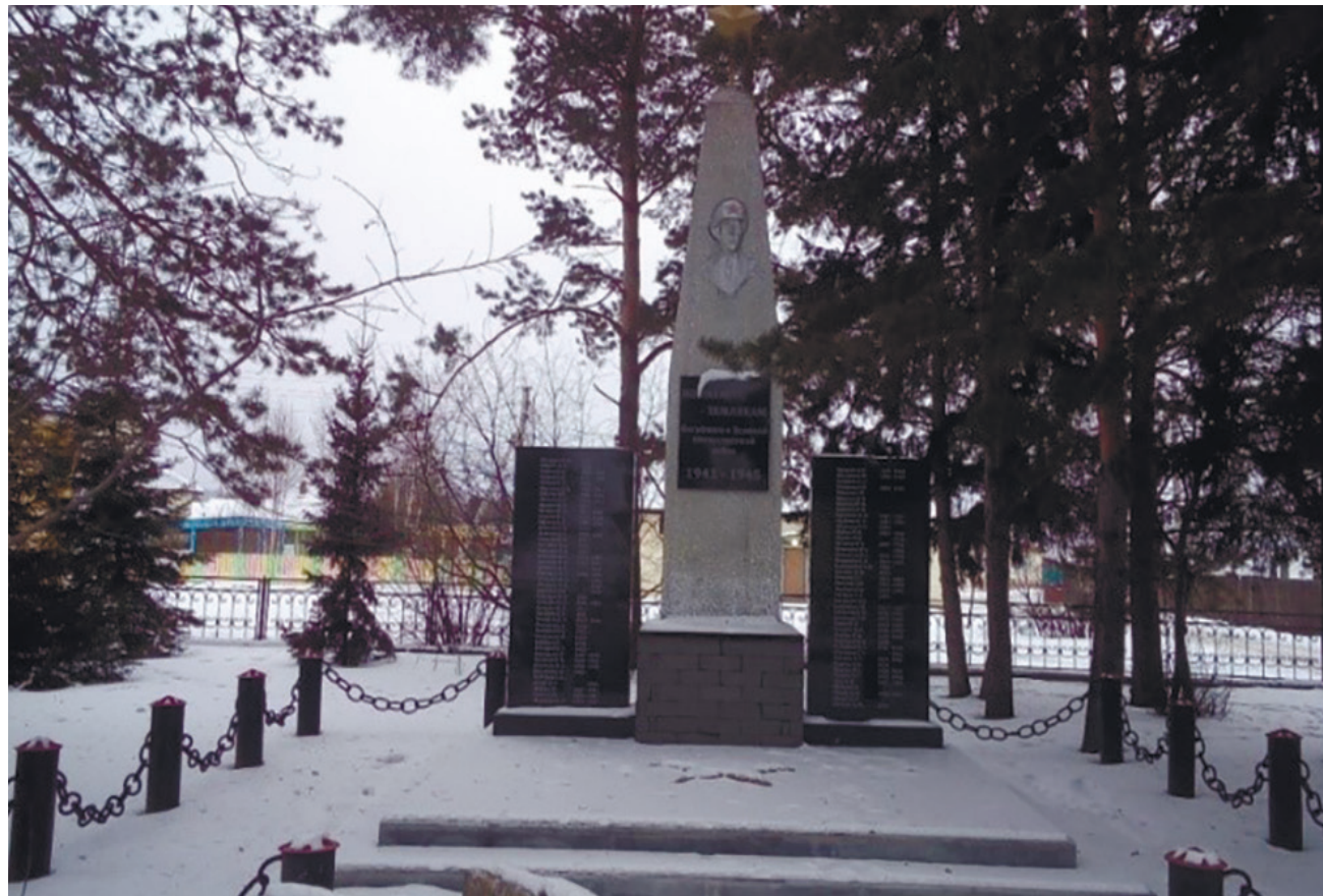
Памятник-obelisk в память земляков, погибших в годы Великой Отечественной войны, д. Ревякина, ул. Байкальская, 50

★ Памятник воинам-землякам, павшим в годы Великой Отечественной войны, д. Бургаз, установлен в 2023 г.