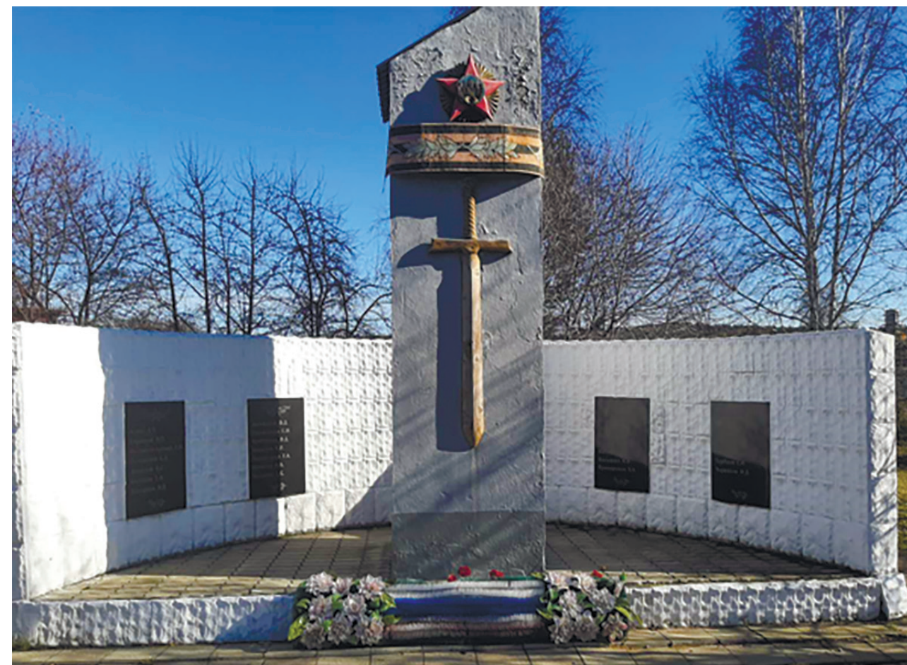
Мемориал участникам Великой Отечественной войны, пос. Плишкино

Мемориал воинам Великой Отечественной войны был установлен в 1989 г. ко Дню Победы на территории Плишкинской средней образовательной школы на пожертвования местных жителей. С этого дня ежегодно 9-го мая возле мемориала проводится торжественный митинг, посвященный Победе в Великой Отечественной войне.