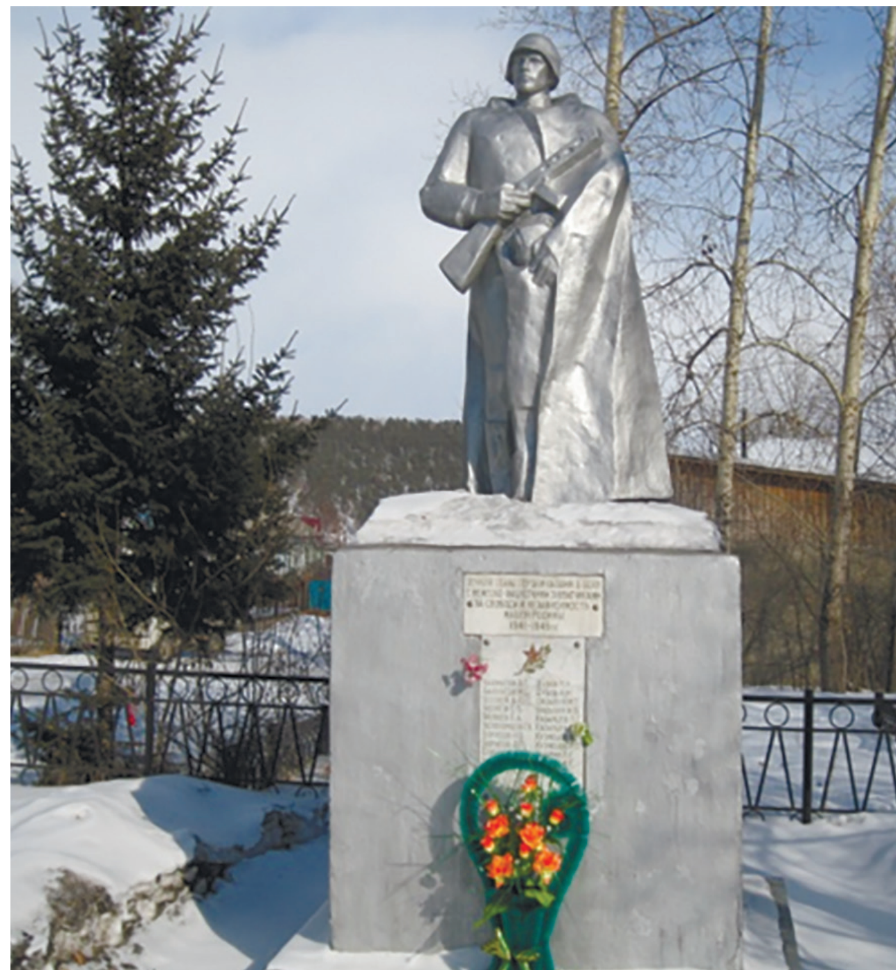
Памятник солдату. Установлен к 70-летию Победы в Великой Отечественной войне, д. Карлук, ул. Гагарина, 4, 2015 г.

В 2015 г. были проведены ремонтные работы: облицовка постамента мраморной плиткой, укладка брусчатки внутри ограды площадью 70 кв. м, установлен бордюрный камень внутри ограды под цветники, залит фундамент под мемориальную плиту.