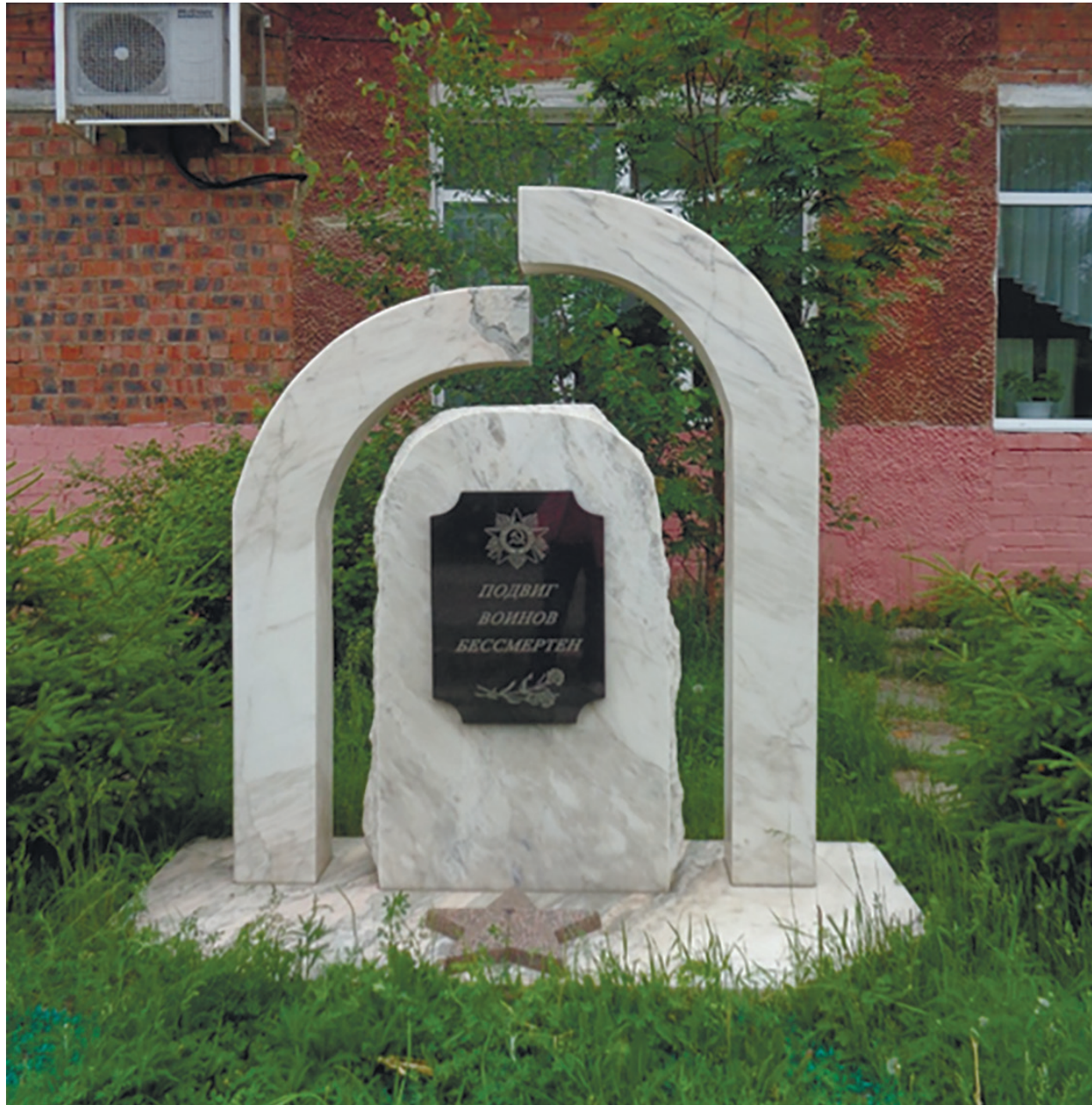
Памятник воинам, погибшим в боях за Родину в годы Великой Отечественной войны, с. Мамоны, ул. Садовая, 11, 2009 г.