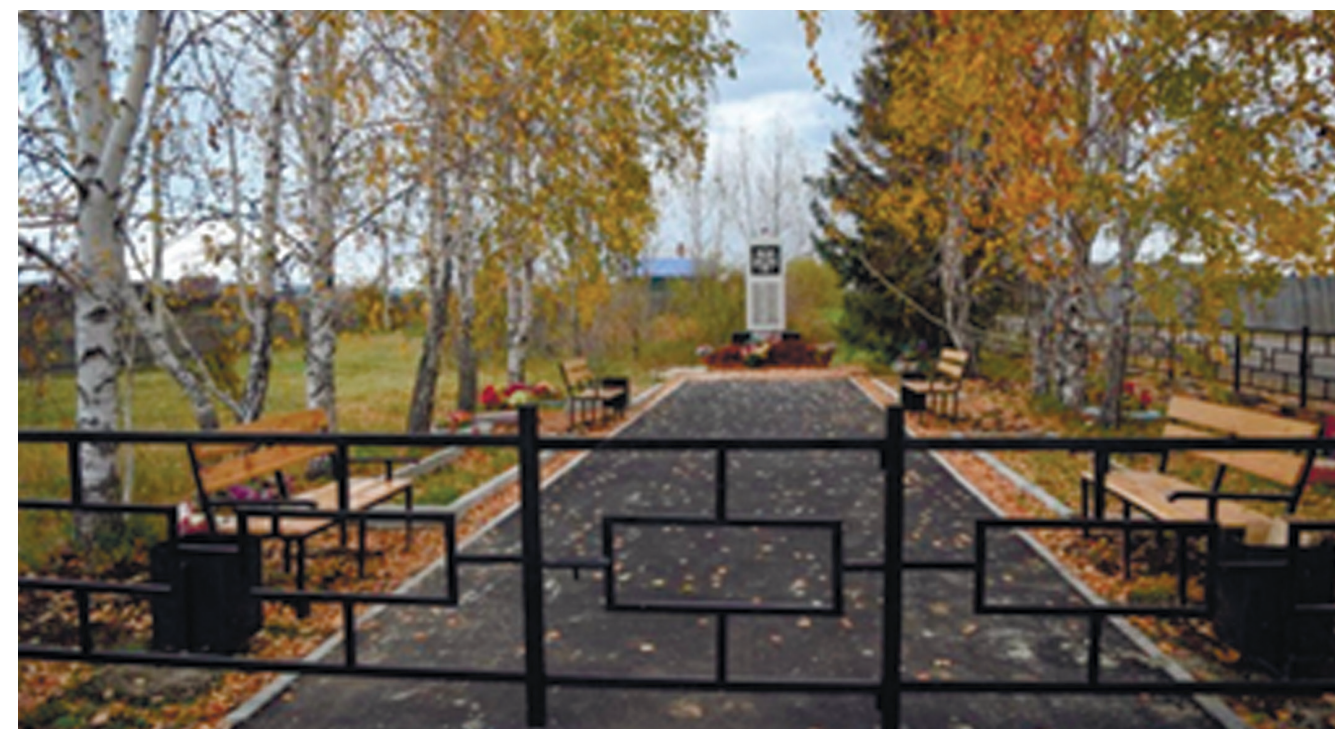
Аллея Славы и памятник в честь воинов-земляков, погибших в годы Великой Отечественной войны 1941–1945 гг., д. Коты, ул. Пионерская, 7, 2017 г.