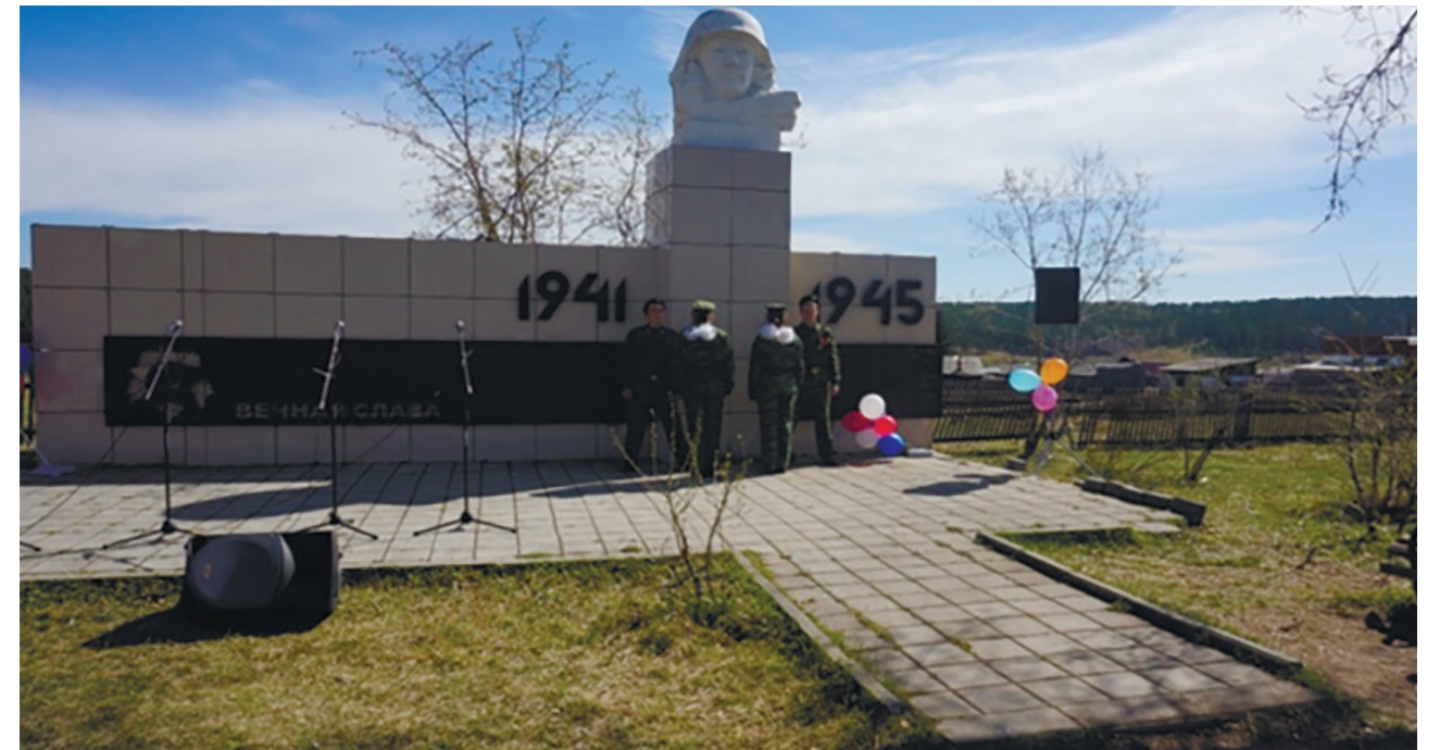
Памятник Героям Великой Отечественной войны, не вернувшимся с полей сражений, д. Ширяева, ул. Ленина, 26, 2009 г.