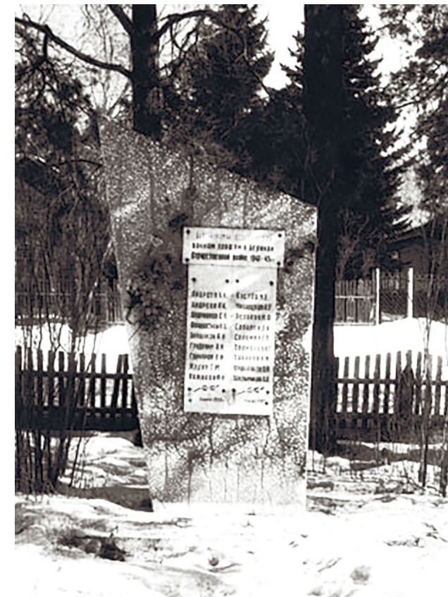
Обелиск воинам-землякам, павшим на фронтах Великой Отечественной войны 1941–1945 гг., пос. Патроны