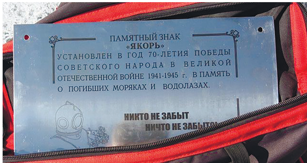
Памятный знак «Якорь» на дне оз. Байкал. Установлен в год 70-летия Победы в Великой Отечественной войне 1941–1945 гг. в память о погибших моряках и водолазах

В годы войны водолазы расчищали водные пути, обеспечивая действия бронекатеров и транспортных судов. Они погибали от взрывов донных мин, вражеских пуль, а также от тяжёлых нарушений режимов погружения и всплытия ( https://russkiymir.ru/news/188158/ ).