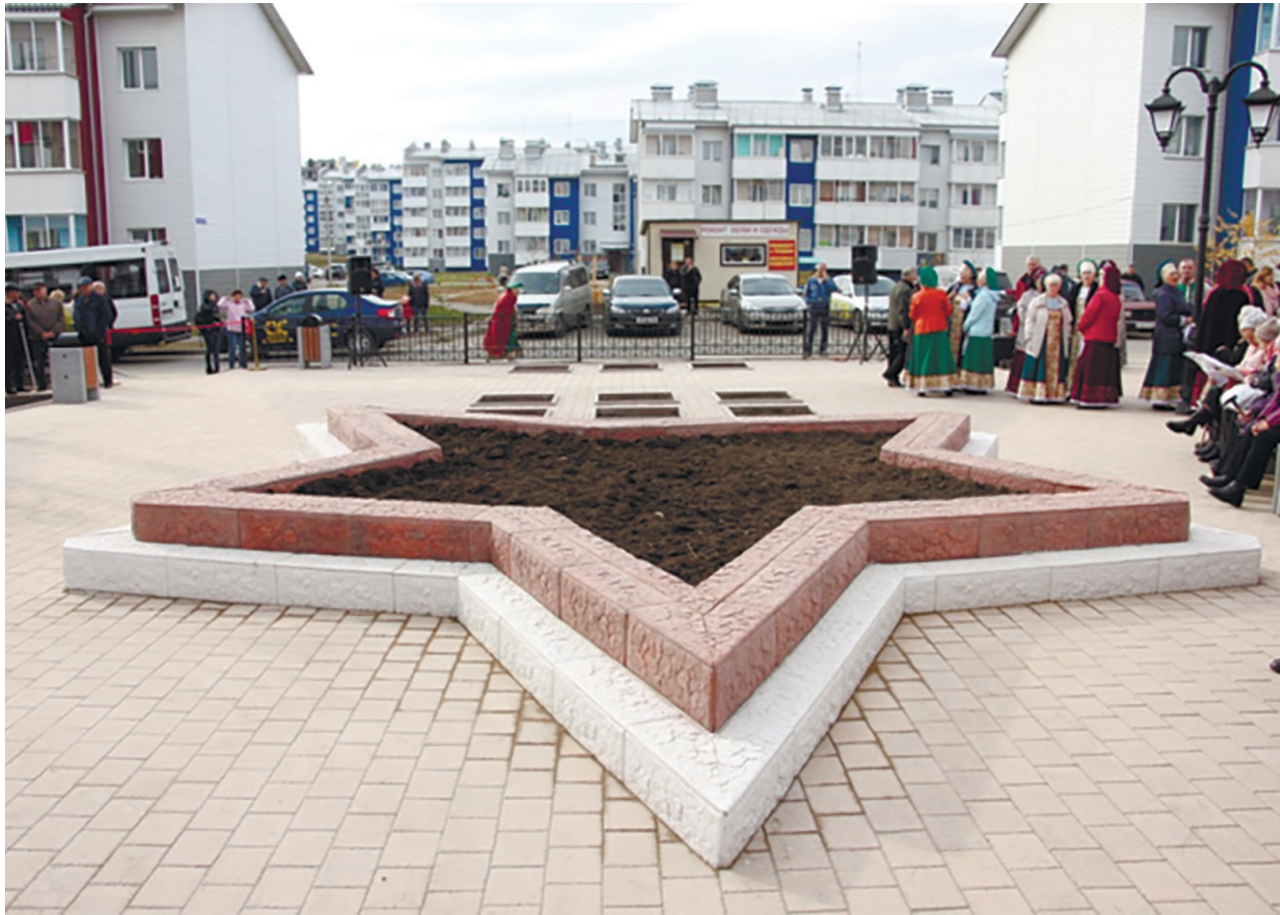
Аллея памяти «Дети войны», микрорайон Луговое, 2018 г.

Долгожданное и значимое событие для жителей Лугового произошло 19 октября 2018 г. – в микрорайоне открыли Аллею памяти «Дети войны».