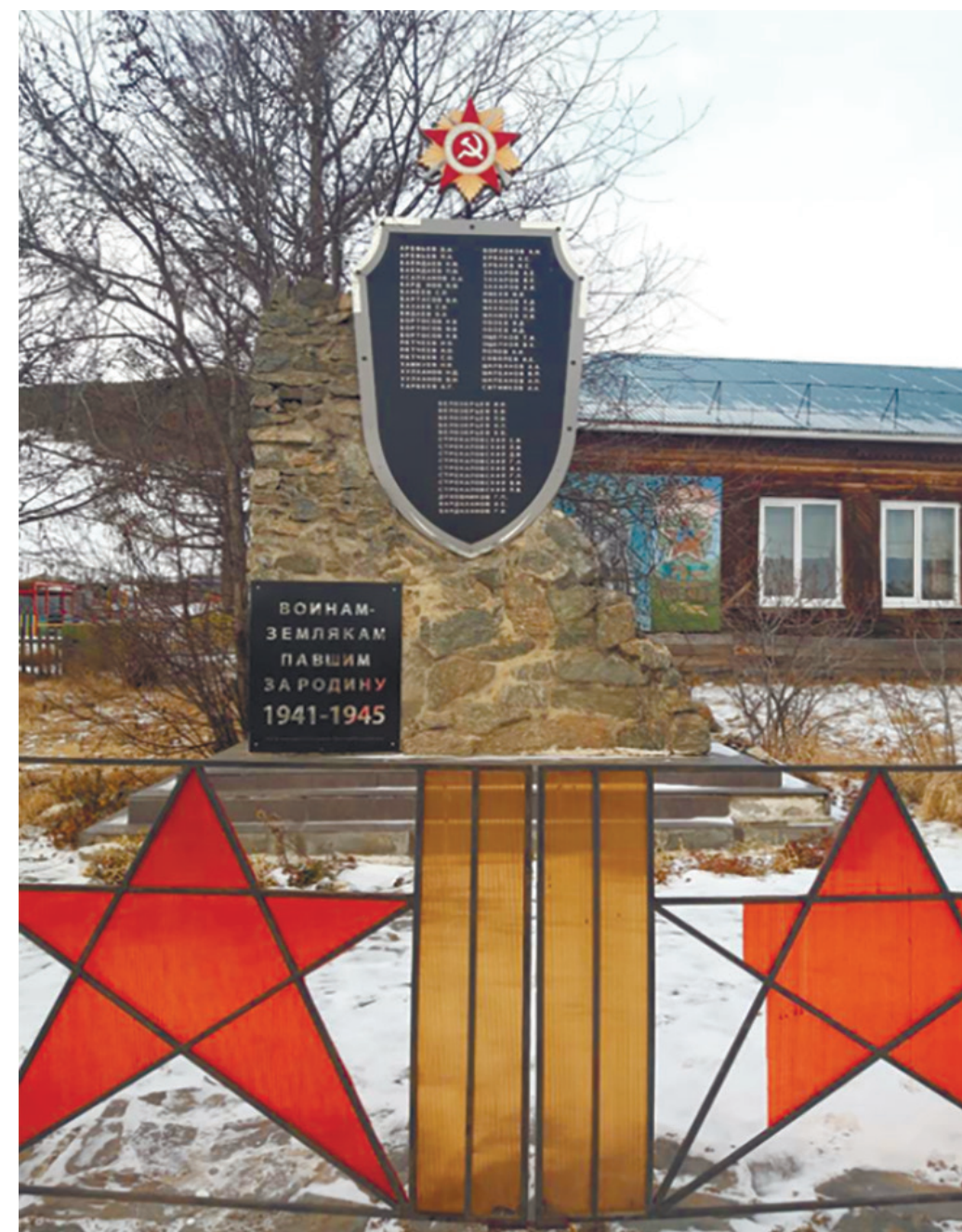
Обелиск памяти погибших на фронтах Великой Отечественной войны, п. Большое Голоустное, ул. Кирова, 54