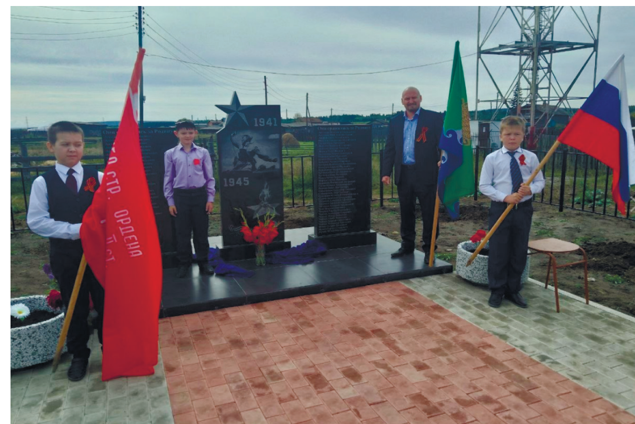
Сквер памяти д. Егоровщина, ул. Молодёжная, 2023 г.