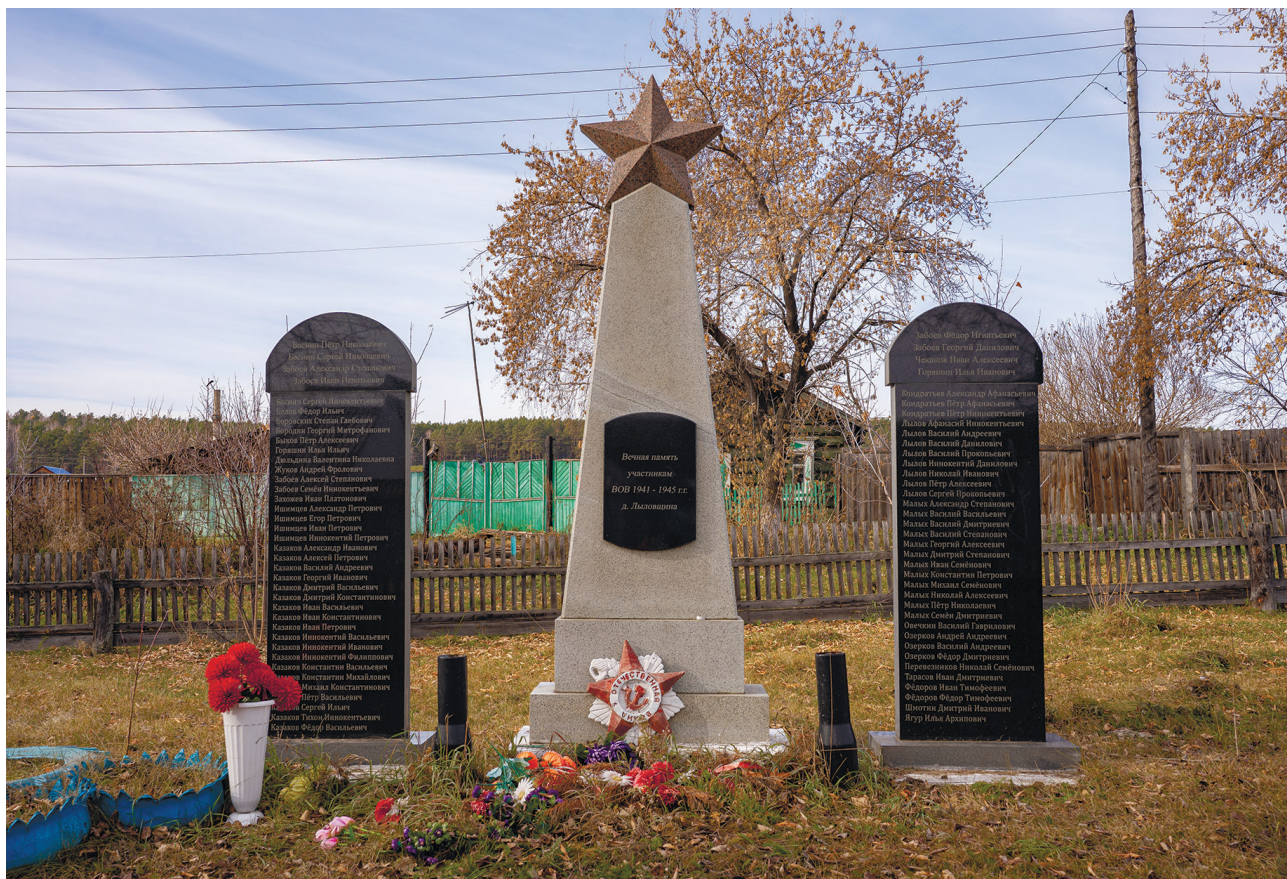
Памятник воинам-односельчанам, д. Лыловщина, 2024г.

Первый памятник жителям, погибшим в годы Великой Отечественной войны, был установлен по приказу коммунистической партии на средства колхоза 8 мая 1967 г. По инициативе ветеранов, вернувшихся с войны, была посажена Аллея Памяти. 22 июня 2012 г. на спонсорскую помощь и средства Ширяевской администрации был поставлен новый памятник.