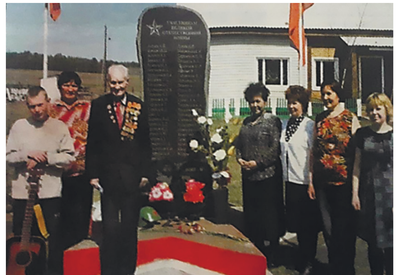
Памятник воинам-землякам, д. Сайгуты, ул. Комсомольская, 31