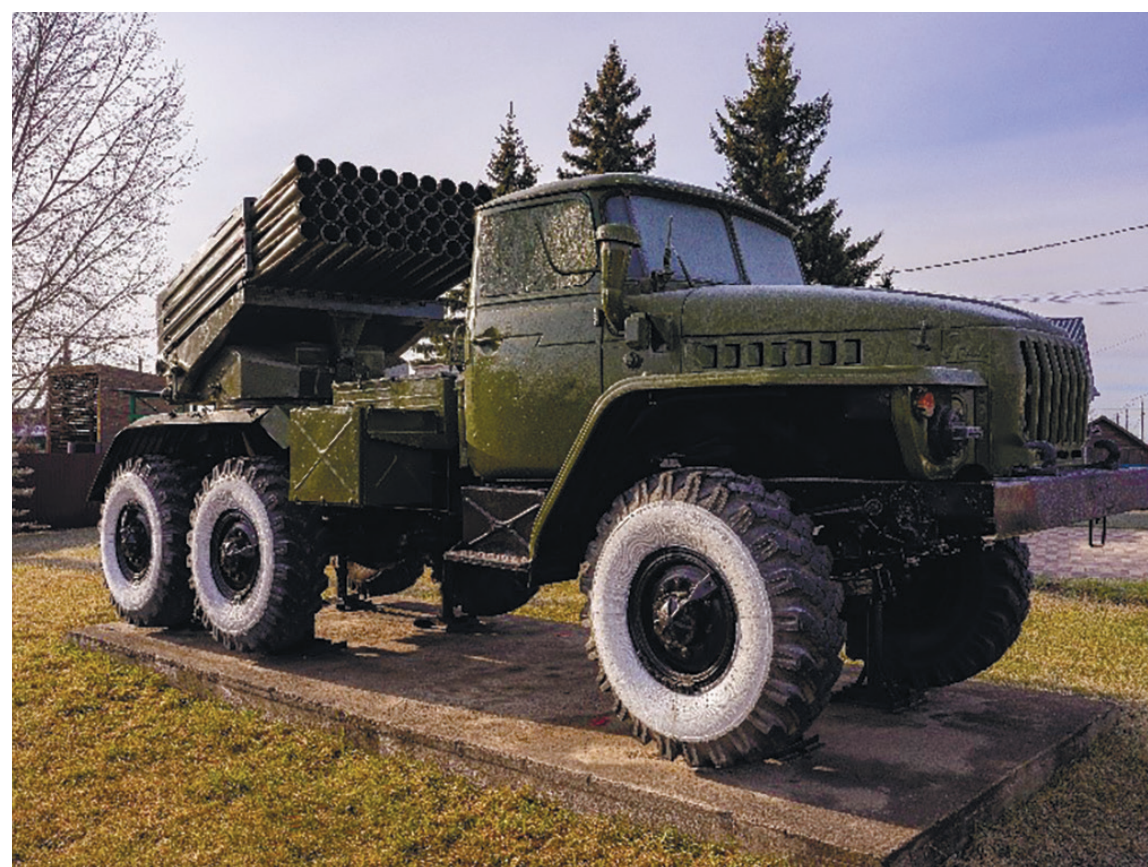
«Град» – реактивная система залпового огня (РСЗО) БМ-21, с. Хомутово, ул. Кирова, 106, 2024 г

К 70-летию Победы в Великой Отечественной войне у мемориала павшим землякам-хомутовцам был установлен еще один представитель артиллерии – РСЗО БМ-21 (реактивная система залпового огня «Град»).