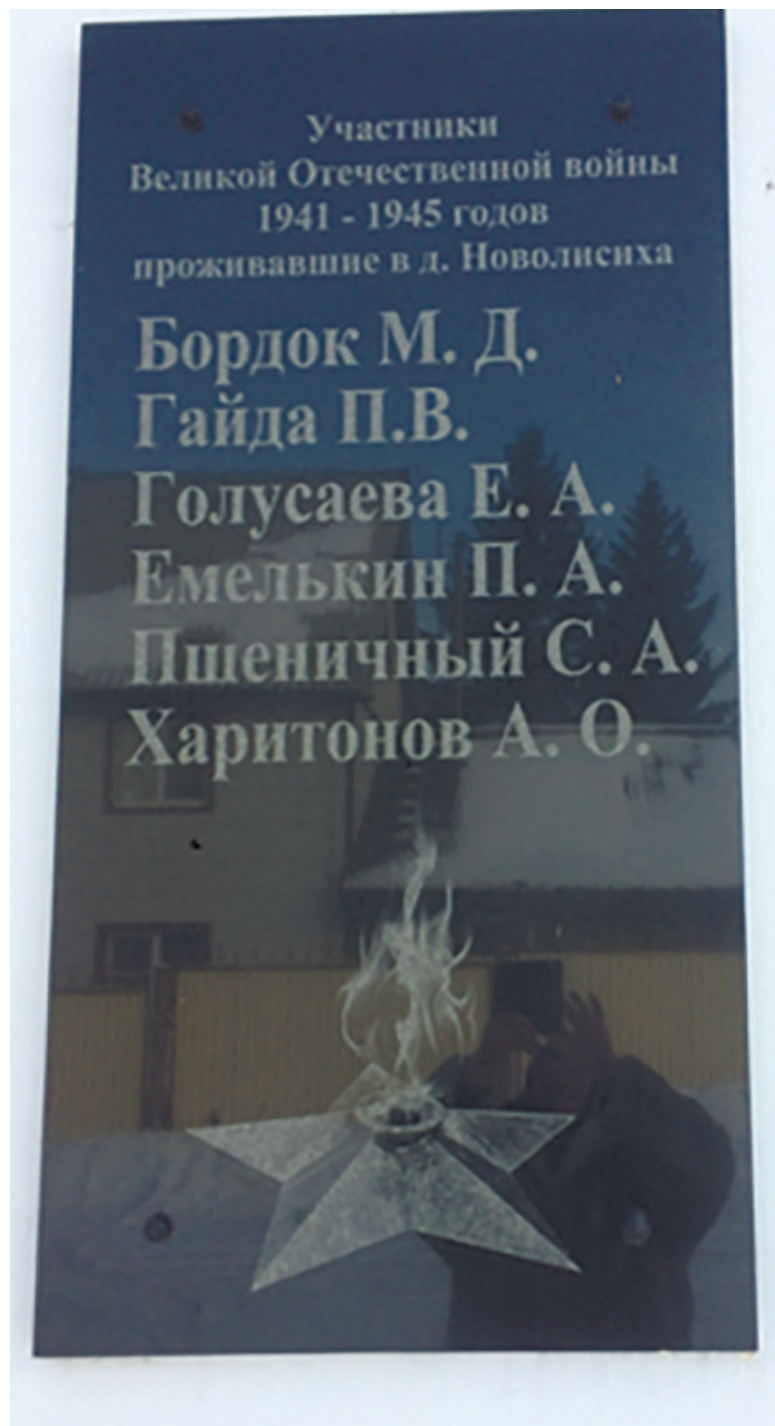
Мемориальная доска воинам-землякам, павшим в боях в годы Великой Отечественной войны, на здании клуба д. Новолисихи, ул. Клубная, 28, 2018 г.