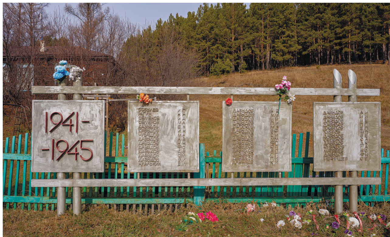
Памятная плита воинам-землякам, д. Тихонова Падь, ул. Центральная, 2024 г.