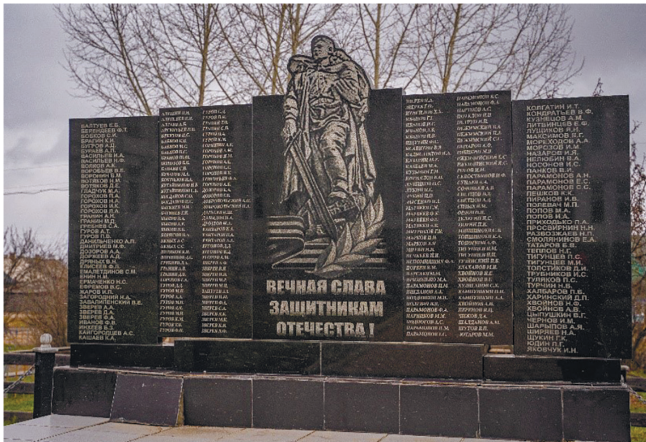
Памятник воинам-землякам, с. Горохово, ул. Школьная, 15, 2024 г.