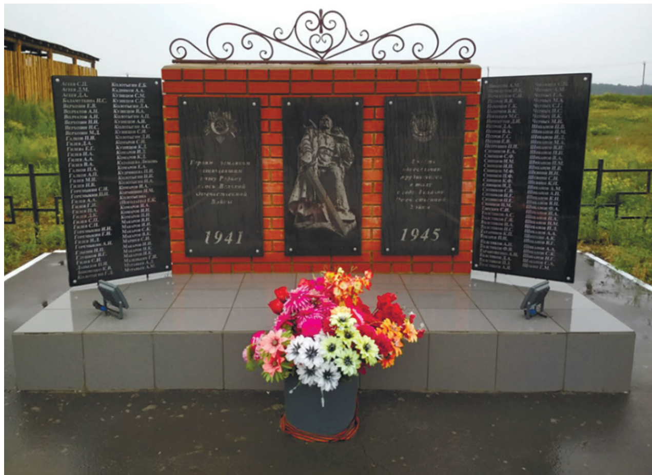
Памятник воинам-землякам, погибшим в годы Великой Отечественной войны 1941–1945 гг., д. Галки, ул. Первомайская