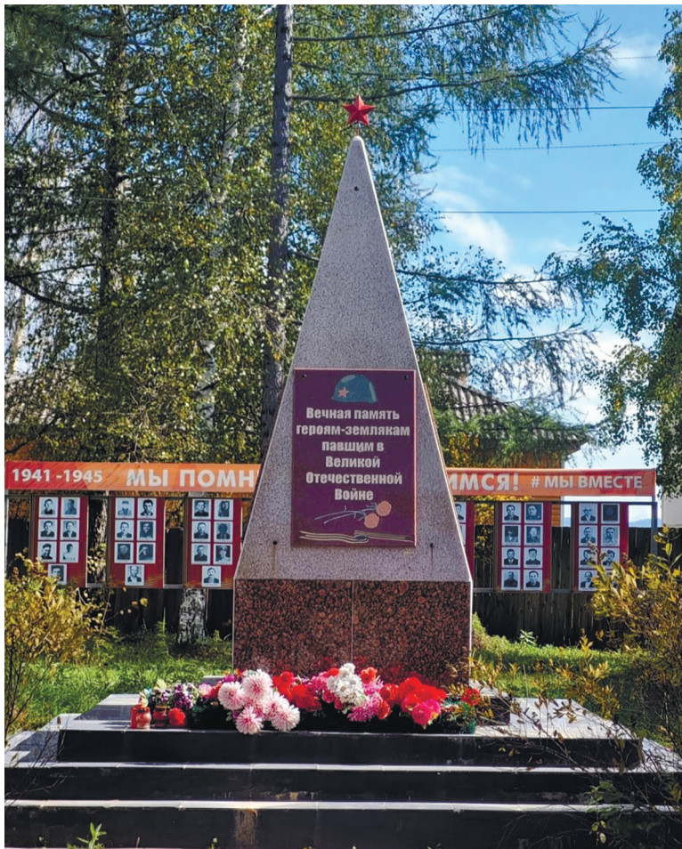
Памятник воинам-землякам в п. Большая Речка, ул. Ленина, 8, 2024 г.