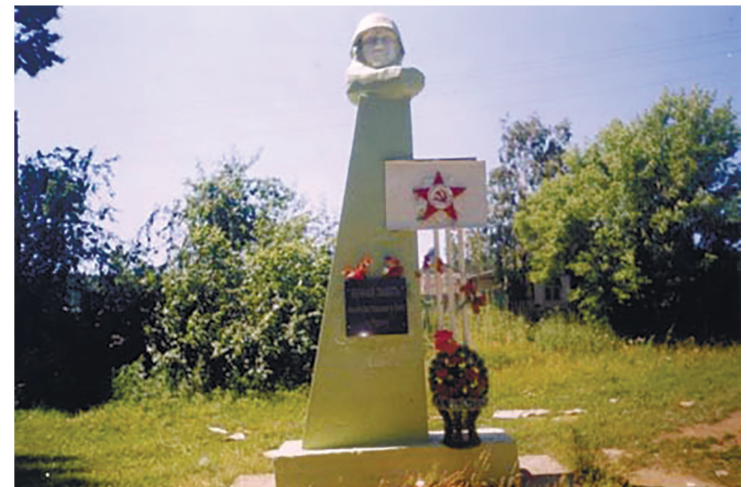
Памятник воинам-односельчанам, д. Лыловщина, 1967 г.