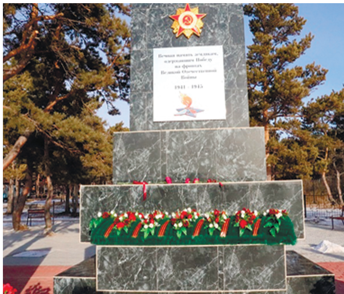
Мемориал памяти земляков – участников Великой Отечественной войны, с. Никольск, ул. Комсомольская, 13. Обновлен 17 ноября 2021 г.