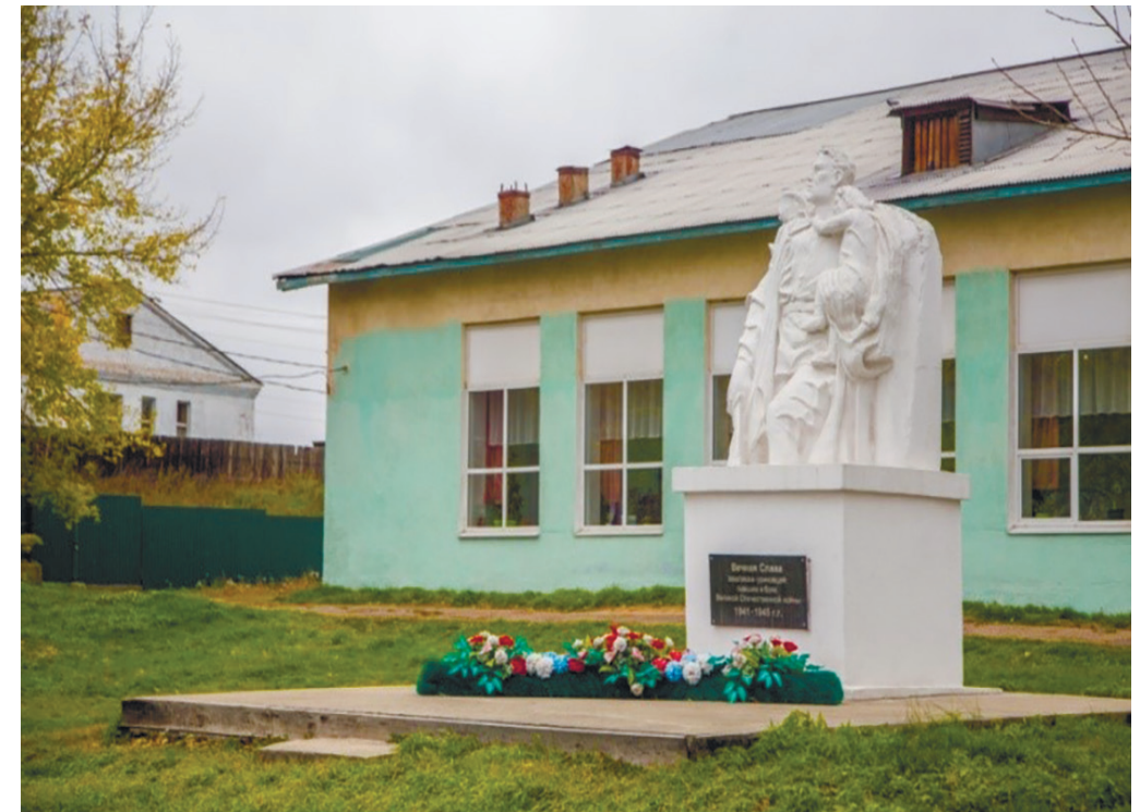
Памятник воинам-землякам, участникам Великой Отечественной войны, с. Урик, ул. Лунина, 2г, 2018 г.

В 2020 г. памятник был реконструирован. Мемориал землякам, ушедшим на фронт в годы Великой Отечественной войны, установили в центре с. Урик, напротив Дома культуры. Рядом с мемориалом обустроили сквер с лавочками, клумбами, освещением.