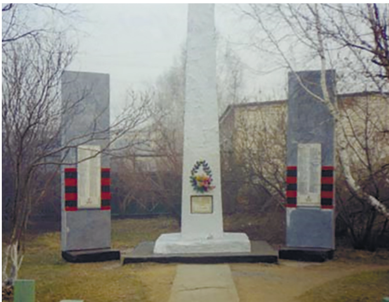
Памятник воинам-землякам, павшим в годы Великой Отечественной войны, с. Горохово, ул. Гагарина