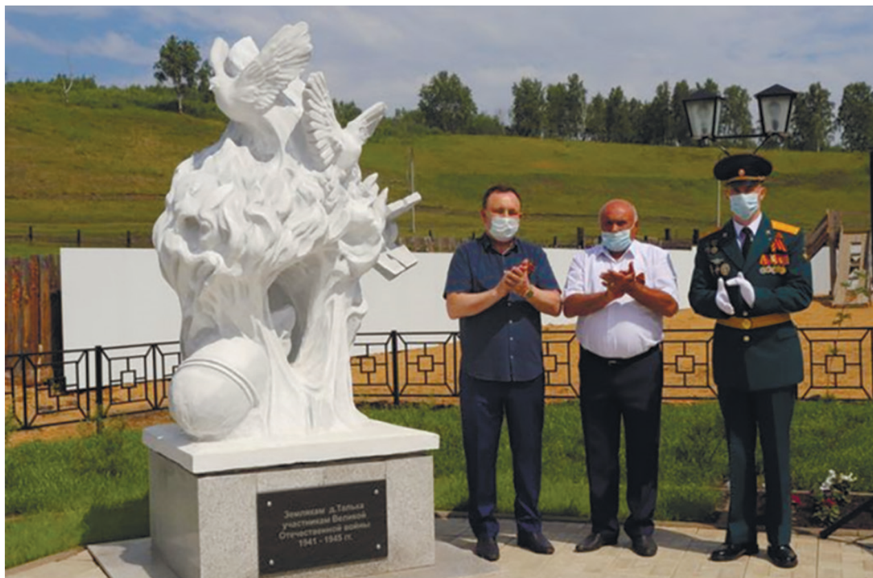
Памятник 27 землякам – участникам Великой Отечественной войны, д. Талька, 2020 г.