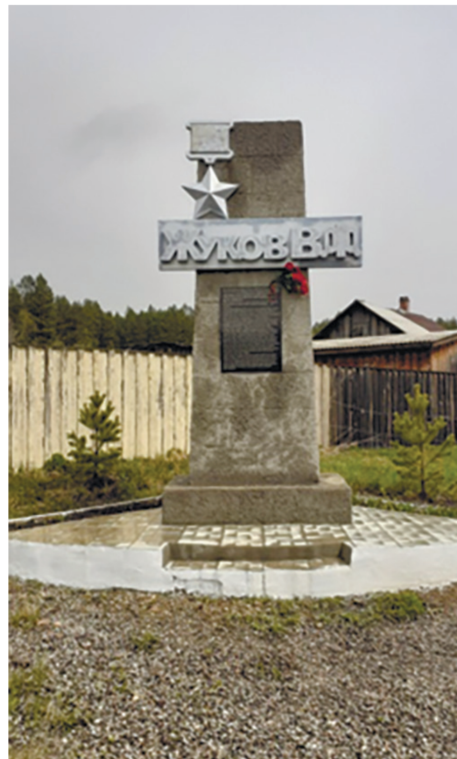
Памятник Жукову Василию Фроловичу, Герою Советского Союза, заимка Поливаниха, 2020 г

Гвардии лейтенант Василий Фролович Жуков был награжден орденом Отечественной войны 1-й степени 14.05.1944 (посмертно).