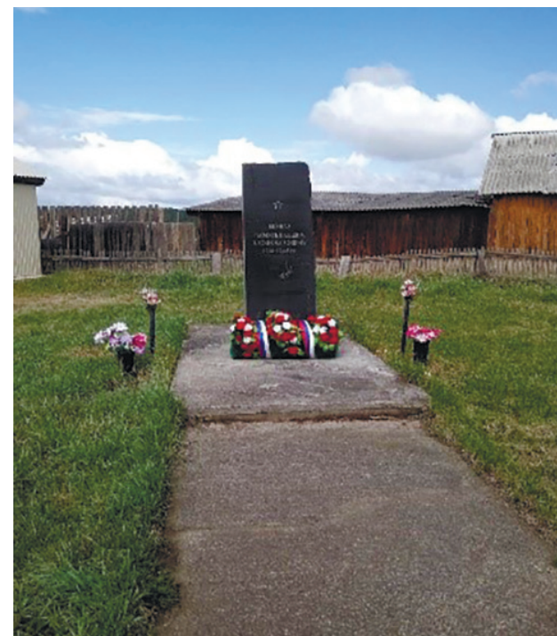
Памятник жителям, погибшим в годы Великой Отечественной войны, д. Горяшина, ул. 40 лет Октября, 1995 г.