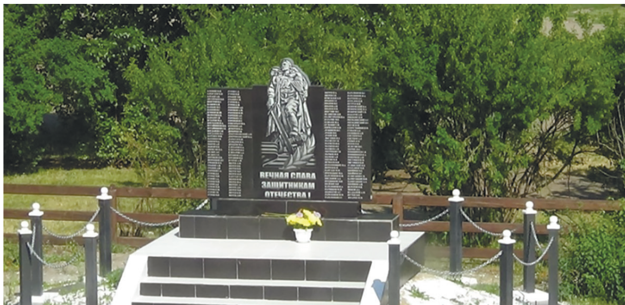
Памятник воинам-землякам, с. Горохово, ул. Школьная, 15

Территория памятника огорожена деревянным палисадом. Памятник представляет собой ступенчатую основу, облицованную керамогранитной плиткой. В центре – мемориальная плита прямоугольной формы, на которой изображен советский солдат (центральная фигура монумента «Воин-освободитель» в Берлине). На памятнике высечены фамилии 160 жителей с. Горохово и Гороховского МО, которые погибли на полях сражений в ВОВ 1941–1945 гг. Этот памятник не просто дань памяти павшим воинам, но и место проведения патриотических мероприятий.