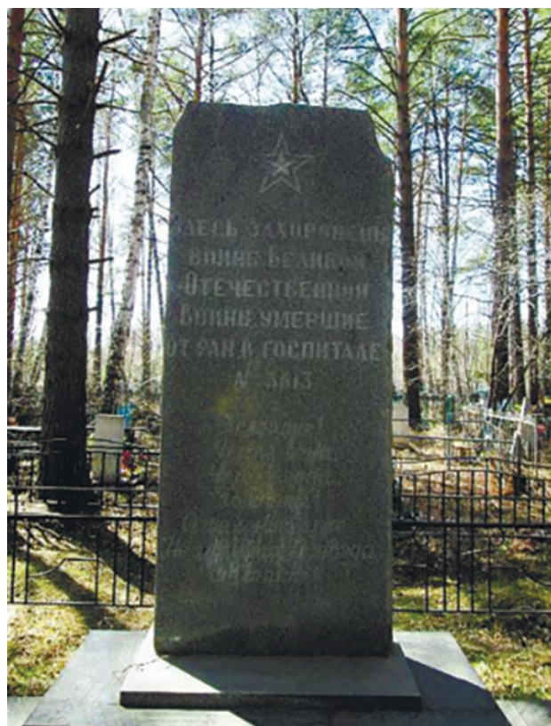
Памятник воинам Великой Отечественной войны, умершим от ран в госпитале д. Сосновый Бор