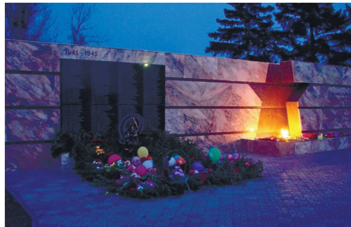
Обновленный обелиск Вечной Славы, с. Хомутово, 2010 г.

9 мая 2010 г. в торжественной обстановке на юбилейном параде был открыт новый обелиск Вечной Славы. Было дополнительно установлено 4 плиты с 89 фамилиями погибших в годы Великой Отечественной войны земляков-хомутовцев, выявленных в ходе архивно-поисковой работы. Вечный огонь зажигается по праздничным дням от газобаллонного оборудования, смонтированного в памятник.