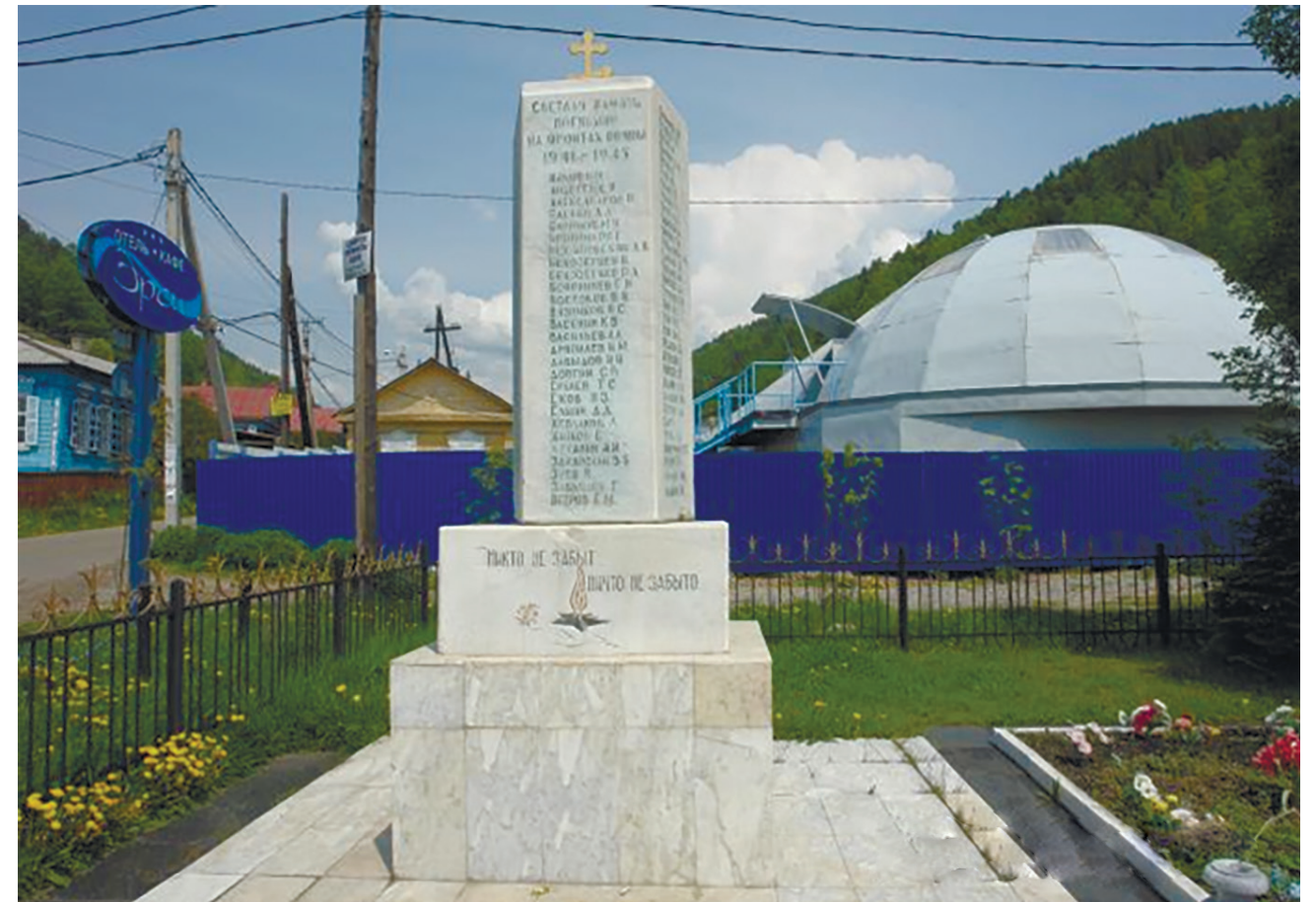
Обелиск героям, павшим на фронтах Великой Отечественной войны, р. п. Листвянка

Аллея Памяти заложена в честь ветеранов Великой Отечественной войны 9 мая 2010 г. (на памятной доске 10 фамилий).