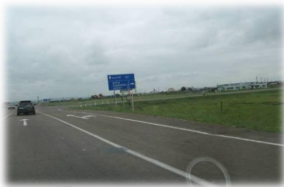
Качугский тракт, поворот в д. Ревякина, д. Бутырки, д. Коты

Поворачиваем направо. В 14-ти км. от Качугского тракта находится деревня Ревякина.