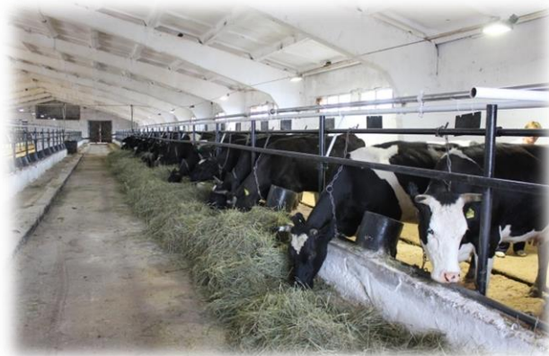
Ревакинская молочно-товарная ферма, 2020 гг.

Молоко в пакетах с маркировкой совхоза «Байкал» в городе пошло нарасхват. Из убыточной совсем недавно отрасли стали извлекать солидную прибыль.