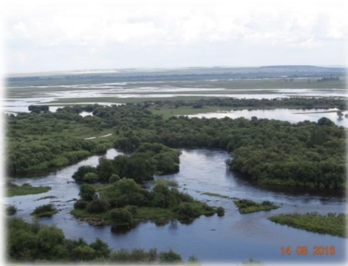
Р. Куда, 2018 г.