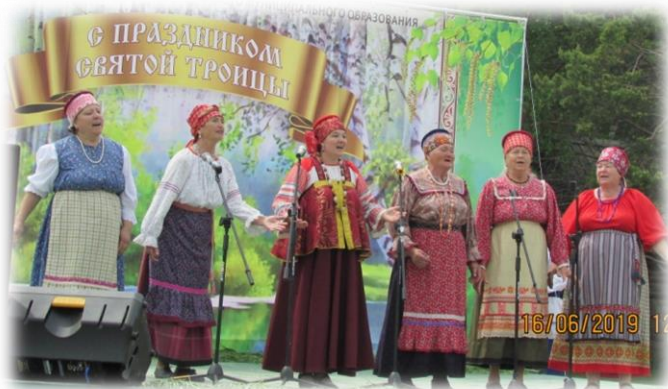
Выступление «Селяночки» в Тальцах

Фольклорные коллективы «Светёлочка» и «Селяночка»- постоянные участники мероприятий в г. Иркутске, районе и области.