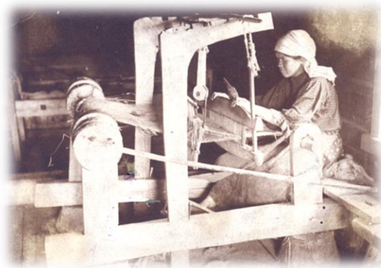
Кросна - ткацкий станок

Мужчины изготавливали конную упряжь, кошёлки, телеги, бондарничали, изготавливали глиняную посуду. В избах женщины мяли кожи, пряли овечью пряжу, обрабатывали коноплю и ткали всевозможные изделия на домашних ткацких станках – кроснах, обучая своих дочерей этому непростому ремеслу. В огородах выращивали неплохие урожаи овощей. Излишки собранного урожая, самодельных изделий увозили на продажу в Иркутск или в северные волости.