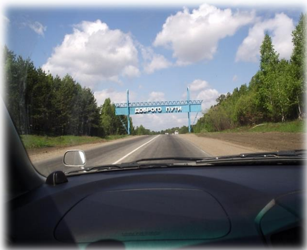
Качугский тракт, 2020г.

Расстояние Иркутск – Ревякина по трассе составляет 50 км.