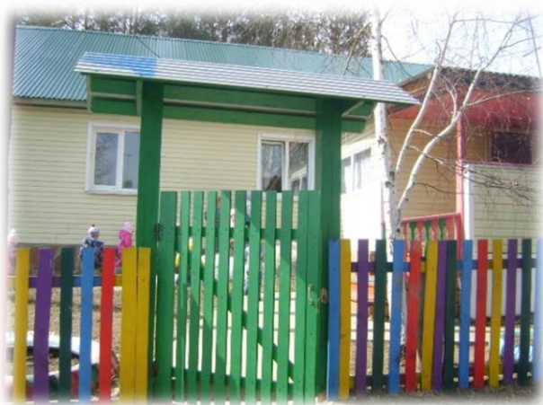
Черёмушкинский детский сад