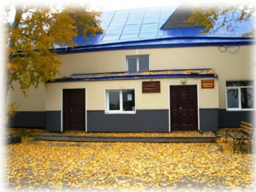
Дом культуры д. Черёмушка

занимает призовые места. Своим творчеством культработники украшают жизнь односельчан, проводят праздники и различные мероприятия.