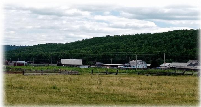
Д. Каштак, 2020 г.

Деревня в Иркутском районе Иркутской области.