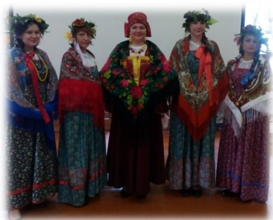
«Светёлочка» в 130 квартале