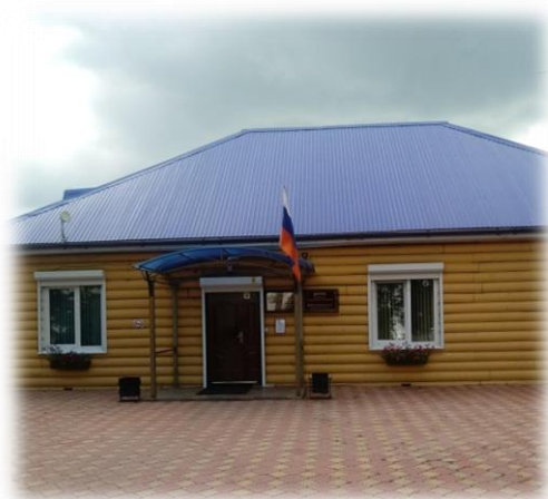
Новое здание администрации, 2020 гг.