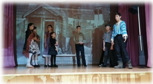
Театральный коллектив «Озорники»