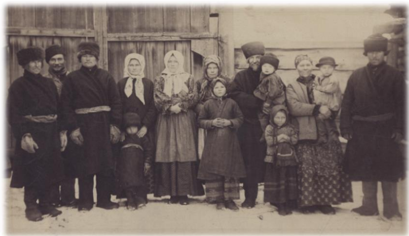
Жители с. Бургазского. Фотография 1893 г.

Впоследствии (с началом коллективизации, а затем в ходе сталинских репрессий, начиная с 1924 г.) количество населения в д. Бургаз стало резко снижаться и к настоящему моменту проживает около 300 человек. Значение большой и процветающей в прошлом деревни упало, а центром Ревякинского МО стала разросшаяся д. Ревякина.