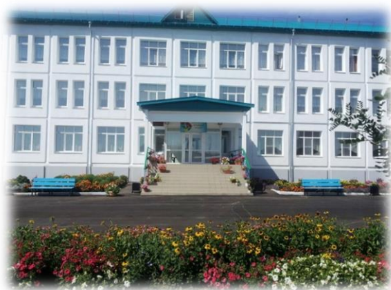
Здание школы построено в январе 1994 г.

В январе 1994 г. школа переехала в новое трёхэтажное здание, где в настоящее время обучаются около 200 детей из четырех населённых пунктов Ревякинского МО – д. Ревякина, Бургаз, Черёмушка и Каштак.