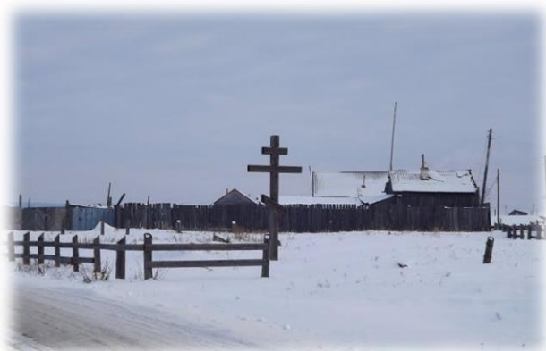
Д. Коты, 2020 г.

Через 3 км. от Качугского тракта справа от трассы проезжаем деревню Коты.