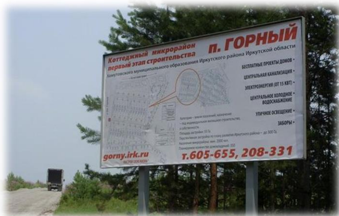
Реклама строительства коттеджного микрорайона п. Горный

На 16 км., слева по пути следования, мы проезжаем указатель деревни Карлук.