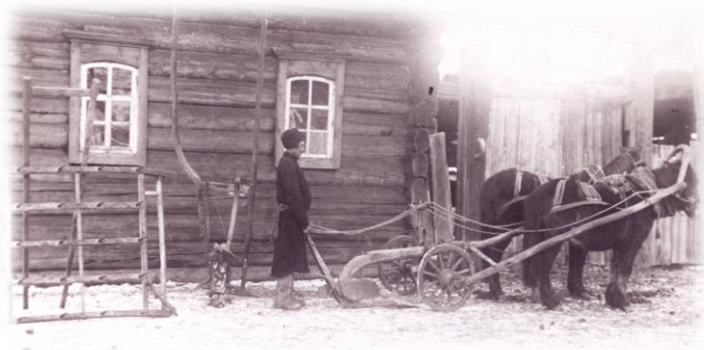
Орудия для обработки почвы