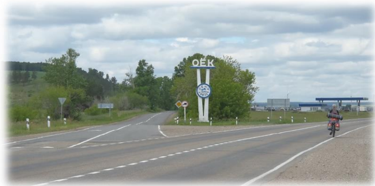
Качугский тракт, поворот в с. Оёк, 2020 г.

Через 5 мин проезжаем слева от трассы знак села Оёк.