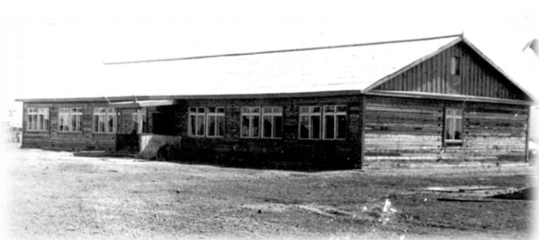
Здание школы, построено в 1970 г.

разместили начальные классы, столовую и группу продлённого дня, после чего школа стала работать в одну смену.