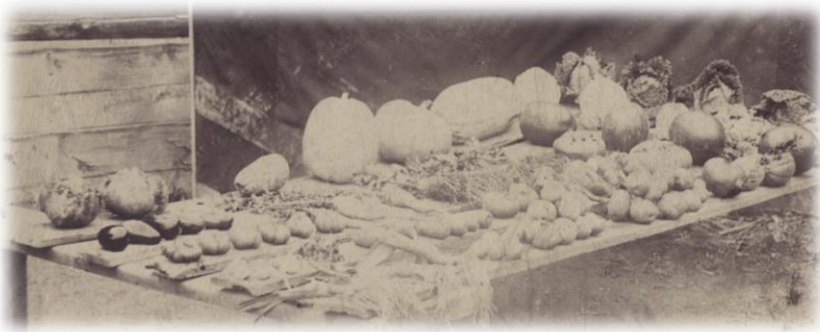
Овощи, выращиваемые в огородах с. Бургазского