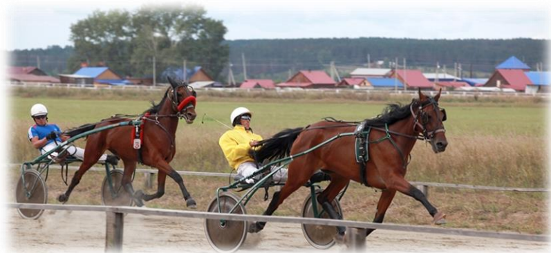
Конный спорт д. Черёмушка, 2020 гг.

В копилке призов КСКИ «Черёмушки» имеются: приз «Элита», «Дерби», кубок «Губернатора» Иркутской области, приз Иркутского ипподрома, приз «Открытие скакового сезона», приз «Большой Окс».