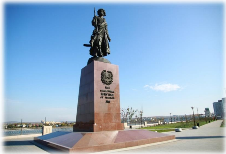
Памятник Якову Похабову. Иркутск, ул. Нижняя Набережная, 2

Памятник Якову Похабову в Иркутске – бронзовая статуя, установленная в 2011 г. к 350-летию города в месте его основания – сейчас это район улицы Нижняя Набережная. Отсюда открывается живописный вид на Ангару, а неподалёку располагается Собор Богоявления и триумфальная арка «Московские ворота».