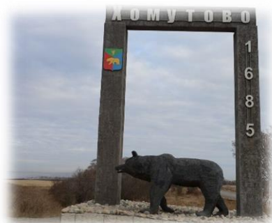
Стела с медведем, Хомутово, 2020 г.

Примерно через 3 км. по пути следования мы проезжаем мост через реку Куду.