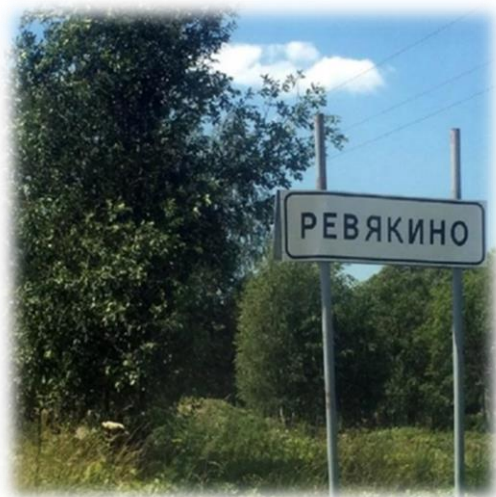
Указатель д. Ревякина

Через два километра за Каштаком и проехав мост через р. Кот, полюбуемся на водную гладь Ревякинского карьера. Поворачиваем направо и въезжаем в д. Ревякина.