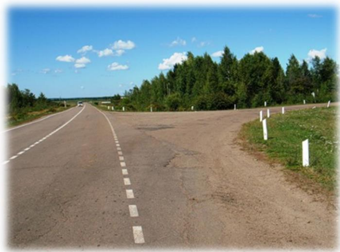
Поворот в д. Ревякина, 2020 гг.