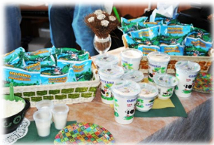
Продукция АО «Сибирская Нива»

Летом 2015 г. было приобретено новое оборудование по упаковке молочной продукции: молока пастеризованного, сметаны, творога, сыра, йогурта, сыворотки, снежка, простокваши и др.