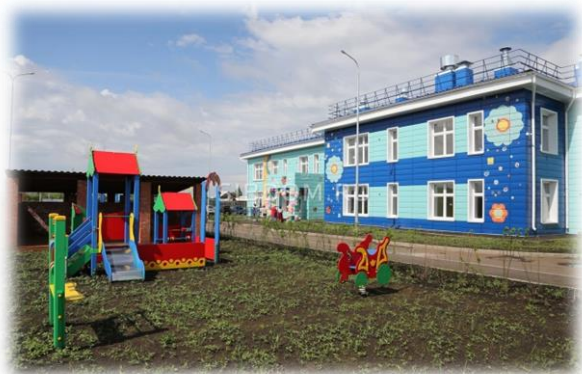
Новый детский сад д. Ревякина, 2021 г.