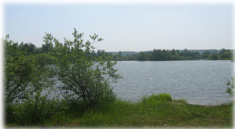
Ревякинский карьер, 2020 гг.

Через два километра за Каштаком и проехав мост через р. Кот, полюбуемся на водную гладь Ревякинского карьера. Поворачиваем направо и въезжаем в д. Ревякина.