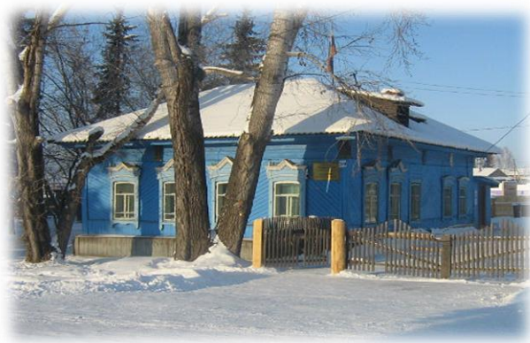
Старое помещение сельского Совета, 1970 гг.