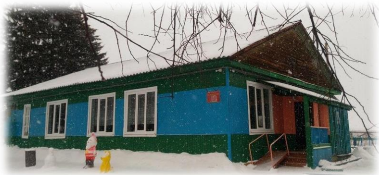
Школа в д. Бургаз, 2000 гг.

МОУ ИРМО «Бургазская начальная общеобразовательная школа».