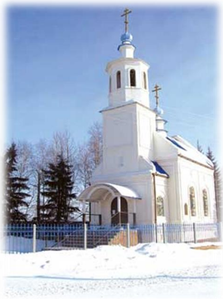
Храм Сорока Севастийских мучеников, д. Ревякина, 2000 гг.

Из-за малого количества жителей в Ревякина своей церкви не было. Церковь в честь Святых Петра и Павла находилась в 5-ти км., в селе Куяда. Жители ближайших к ней деревень были причислены к Петропавловскому приходу. В д. Бургазской и на заимке Петухова были только свои часовни.