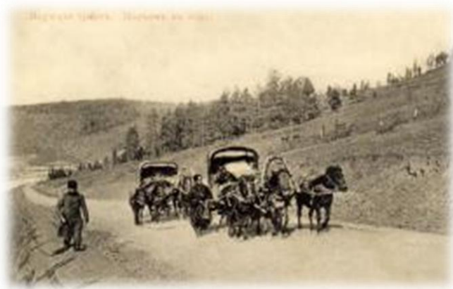
Якутский (Приленский тракт) XVII – 1-й половины XVIII вв.