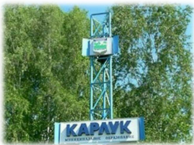
Стела деревни Карлук, 2020 г.

На 16 км., слева по пути следования, мы проезжаем указатель деревни Карлук.