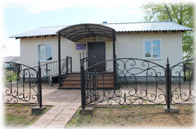
ФАП д. Черёмушка, 2020 гг.

При поддержке администрации района на территории Ревякинского МО успешно реализовываются новые программы по переселению граждан из аварийного жилищного фонда. Строятся детские площадки, 17 июня 2021 г. состоялось открытие нового детского сада на 145 мест в д. Ревякина, благоустраивается Бургазская начальная школа, планируется капитальный ремонт ДК д. Черёмушка, освещение и ремонт улиц поселений.