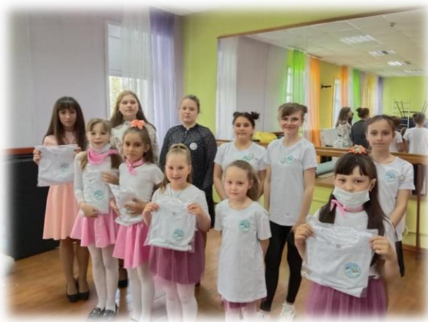
Вокальные ансамбли «Черёмушка» и «Ладушки»