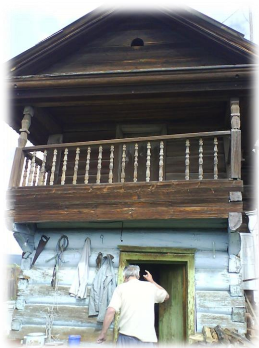
Дом Лоскутовой А.Л. (ранее-Дубровиных)

Быть на таком балконе и любоваться красотой родной деревни — это просто мечта! Жалко, что люди, не понимающие такой красоты, убирают их и возводят на их месте безликие, серые коробки.