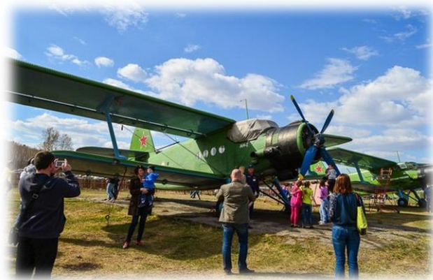
Авиационный центр ДОСААФ, с. Оёк, 2015 г.

Авиационный центр может принять одновременно группы туристов до 80 человек, оформить специальный пакет услуг: ознакомительный прыжок с парашютом (высота 800-900 м), полёт на Як-52 (с элементами высшего пилотажа), АН-2, МИ-2 (группа 10-11 человек), организация для больших групп туристов экскурсионных полётов Байкал «Листвянка», Байкал «Бухта Песчаная». За время полёта Вы почувствуете, что такое невесомость, Вам станет знакомо ощущение «изнутри», что такое петля Нестерова, крутой вираж, возможность понять ощущения летчика-истребителя. В рамках программы мероприятия участники могут ознакомиться с техникой, в том числе музейными экспонатами, совершить ознакомительный полёт на АН-2, экстремальный заезд на багги по территории авиационного центра, принять участие в военной игре от Стрелкового Клуба ДОСААФ и в завершении мероприятия участникам могут представить Авиашоу.