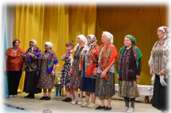
После спектакля. П.Мишелевка, 2015 г.

Современный самодеятельный театальный коллектив «Пульс» известен далеко за пределами Иркутского района. Начиная с 2013 г., он участвовал в областном фестивале