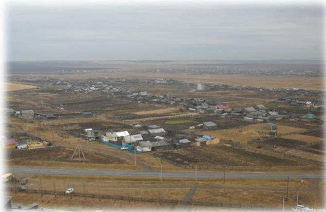
Д. Бутырки, 2020 г.

Находится на левобережье реки Куды, в 4 км. к юго-востоку от центра сельского поселения, села Оёк, и в 35 км. к северо-востоку от Иркутска.