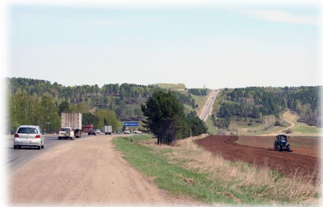
Качугский тракт между д. Карлук и с. Хомутово, 2020 г.

Сейчас – это комфортабельная трасса с асфальтовым покрытием.