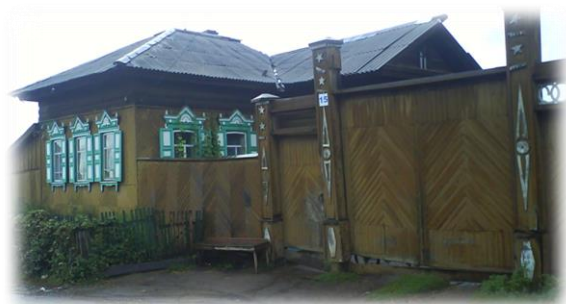
Первая школа в бывшем доме Савинского, ул. Байкальская, д. 15

Приезжающие в деревню грамотные люди по просьбе местных жителей обучали грамоте ребятишек, но постоянной школы и учителей не было, так как деревня была небольшой. Желаящие учиться грамоте дети ходили в начальную школу за 5 км. в д. Куяда.