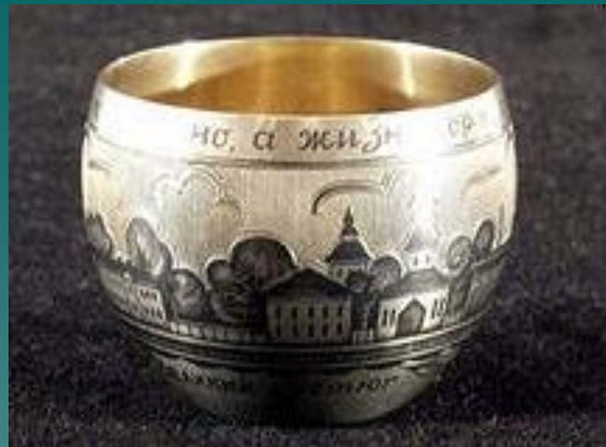
Вологодское чернение серебра