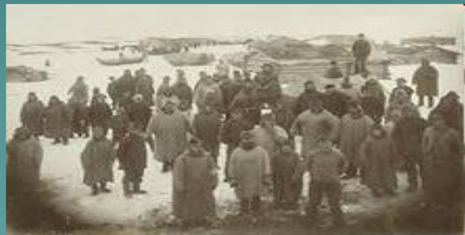
Народ, проживающий на берегу Белого моря