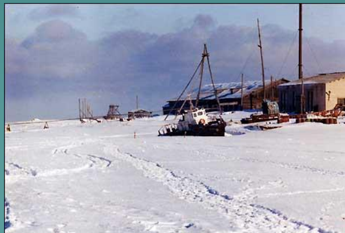
Замерзающее Белое море