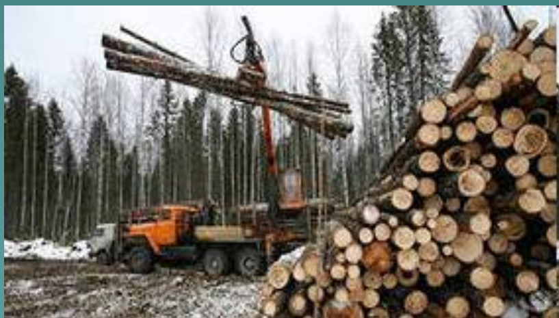
Огромные запасы древесины