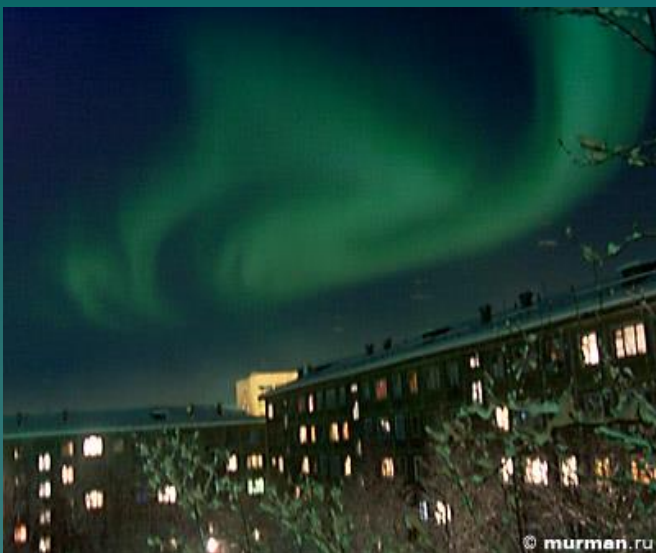
Полярная ночь Северное сияние