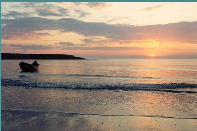
Незамерзающее Баренцево море