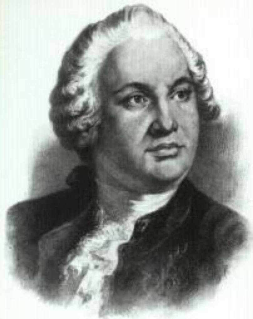
Михаил Васильевич ЛОМОНОСОВ (1711—1765)

Ломоносов Михаил Васильевич – первый русский учёный- естествоиспытатель, получивший мировое признание, энциклопедист и художник, поэт и филолог, физик, химик, астроном. Работал в области молекулярно-кинетической теории тепла, географии, металлургии, геологии, истории.