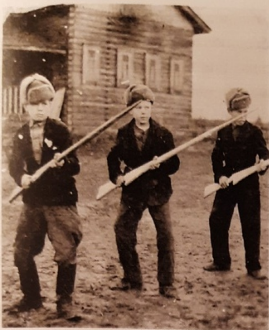
Занятия по начальной военной подготовке

Большое место отводилось тактической подготовке. Программа обучения была рассчитана на подготовку одиночного бойца, который смог бы найти выгодную для боя позицию, расположиться, отрыть и замаскировать окоп, определить ориентиры и расстояние до них. Особое внимание уделялось умению действовать в ночное время суток.