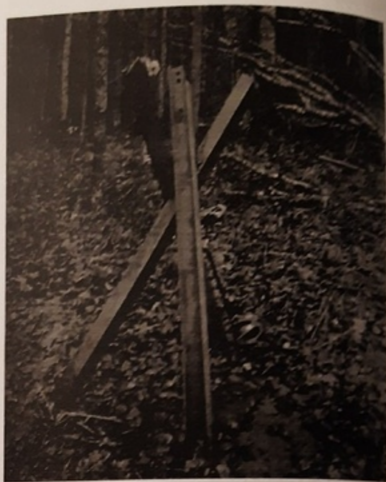
Место захоронения на кладбище в Клёнове. Памятник – три рельсовые рубки сформированы в противотанковый ёж – установлен в 2013 году