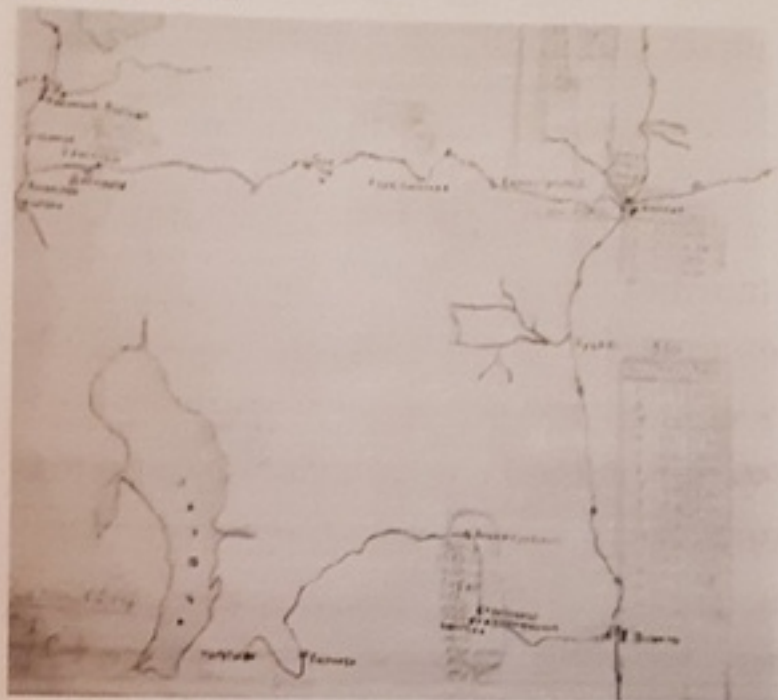
Карта 500.000 1941 года, утвержденный маршрут передислокации 1276-СП

армейца 1274 СП, передано в народное хозяйство 9 истощенных лошадей, было утеряно 532 боевых винтовочных патрона, 2 ручных гранаты, плащ-палатка, один топор и один штык.