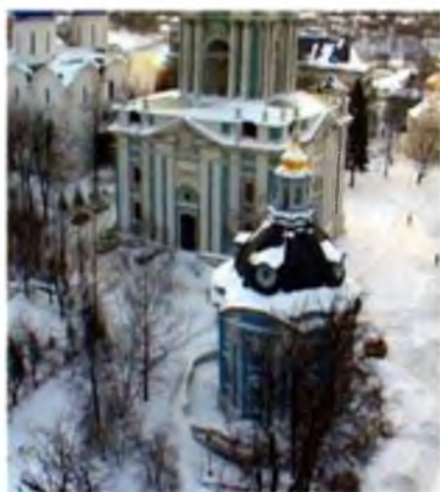
Здание огромное, величественное и изящное, состоит из пяти ярусов и имеет вид четырёхугольного столба, который по мере возвышения своего уменьшается в объёме. Колокольня Рисунок 9