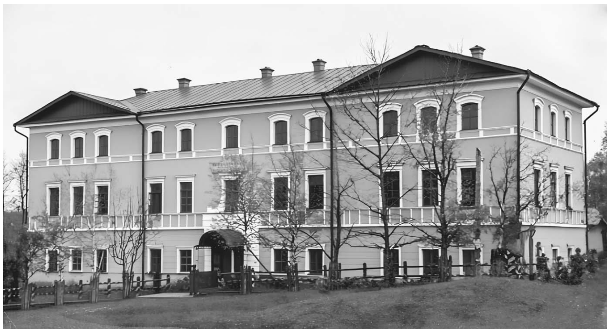
Здание соликамской тюрьмы