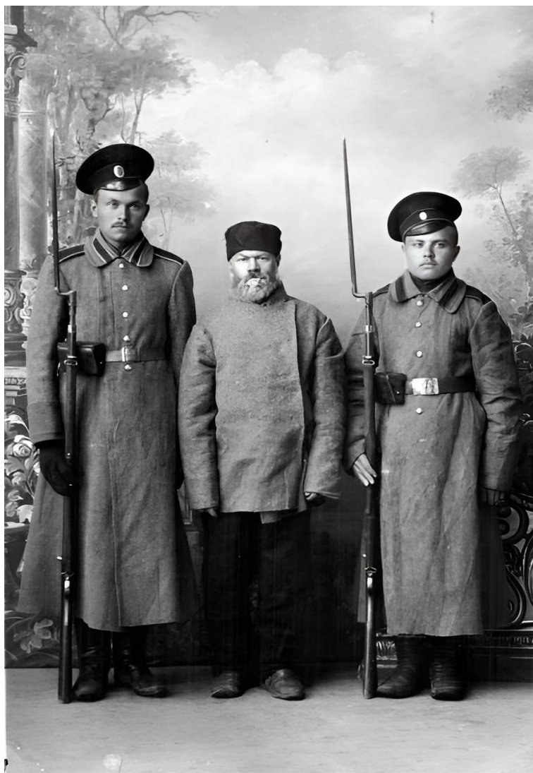
Охранники тюрьмы с арестантом