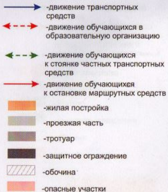
Схема организации дорожного движения в непосредственной близости от образовательной организации