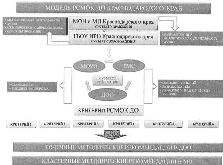
Рисунок 1 – Модель РСМОК ДО

Модель РСМОК ДО (рисунок 1) состоит из субъектов управления (министерство образования, науки и молодежной политики Краснодарского края), субъектов сопровождения (ГБОУ ИРО Краснодарского края, муниципальные органы управления образованием, территориальные методические службы, педагогические работники – эксперты), субъекты реализации образовательных услуг – дошкольные образовательные организации.