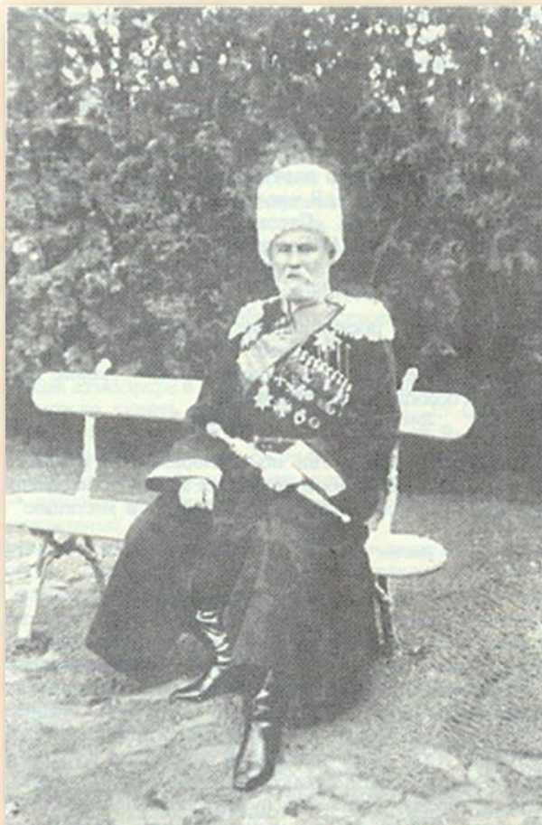
Михаил Бабыч, 1916, Екатеринодар

Михаил Бабыч — последний наказной атаман Кубанской области, персона, которая заслуживает внимания из-за своего символического значения в истории Кубани. Убежденный монархист, человек, большую часть жизни отдавший военной службе, руководивший областью девять лет, повлиявший на культуру и историческое наследие Кубани, был смещен с должности после Февральской революции и затем жестоко убит в Гражданскую войну. Разобрались в его биографии.