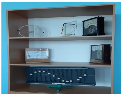
Инженерно – математический класс