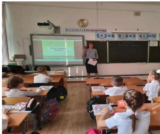
Кабинет начальные классы