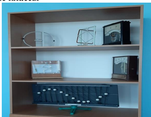
Инженерно – математический класс