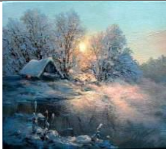
М. А. Иваненко «Там, где сбываются мечты»