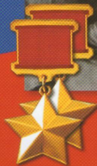
НИКОЛАЕВ Андрьян Григорьевич летчик-космонавт СССР