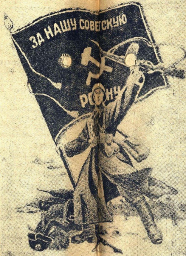
Генерал М. Миронов