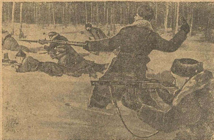
В Н-ском партизанском отряде.

За время с 19 по 24 января наши войска на всех фронтах подбили и уничтожили 337 немецких танков. В воздушных боях и огнем зенитной артиллерии сбито 163 самолета противника.