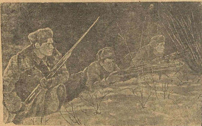
В Н-ском партизанском отряде, партизаны ведут бой.

За время с 28 декабря 1943 г. по 3 января 1944 г. наши войска на всех фронтах продвинулись и уничтожили 581 немецкий танк. В воздушных боях и огнем зенитной артиллерии сбит 121 самолет противника.