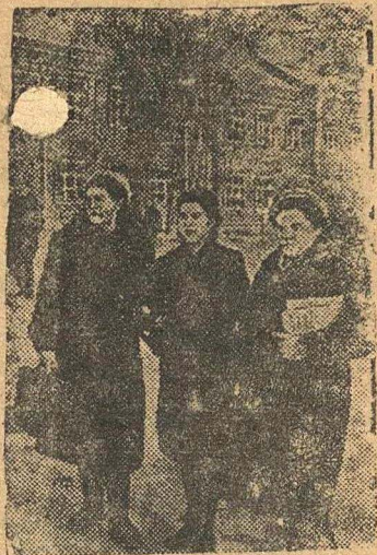
Колхозники Палехского района (Ивановской области) своими силами и из местных материалов за 4 месяца выстроили здание новой средней школы, в которой сейчас учится 400 детей.

На снимке: Школьницы возвращаются из новой школы.