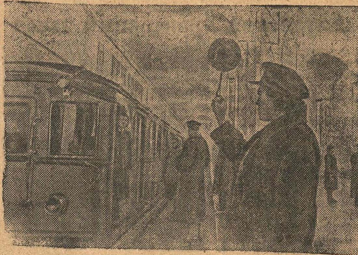
ст. «Завод имени Сталина» на Москворецком радиусе Московского метрополитена.