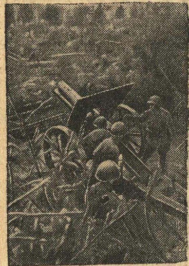
Гвардейцы-артиллеристы ведут огонь по фашистам в районе города Н.

За истекшие месяцы ожесточенных боев на советско-германском фронте Красная Армия в упорных боях нанесла немцам, итальянским, румын-