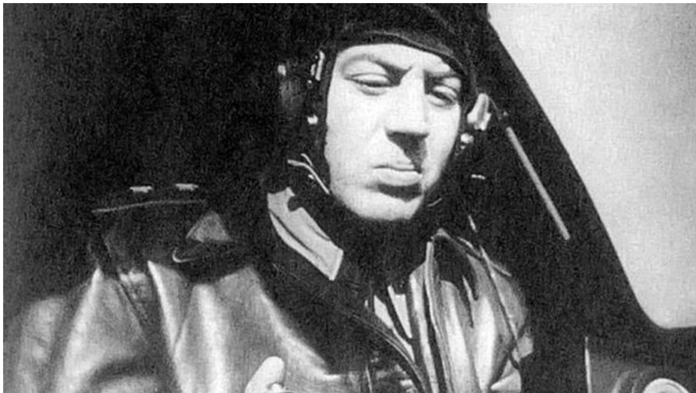
Василий Иосифович Сталин за штурвалом самолёта

– Ой-ой, какой остроумец, – полковник хрипло хохотнул. – Ты понимаешь, Виталик, ну никакой субординации, – обратился он к улыбавшемуся Попкову. – Насел на меня, как репей на жучкин хвост, и не отпадывает. Я – в петлю, он – в вираж, я выхожу – он опять тут как тут!