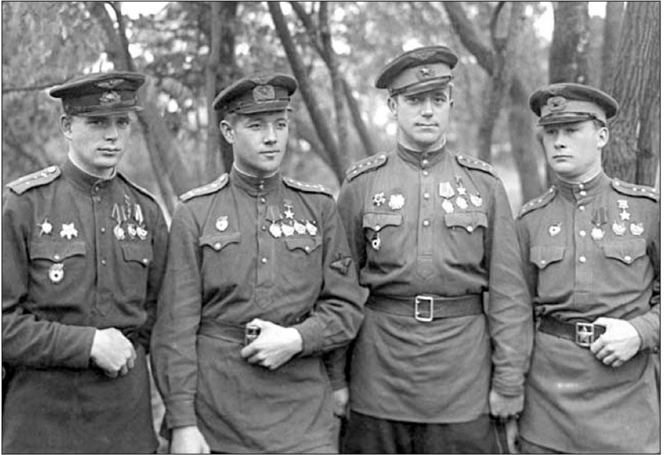
Лётчики «Второй поющей»