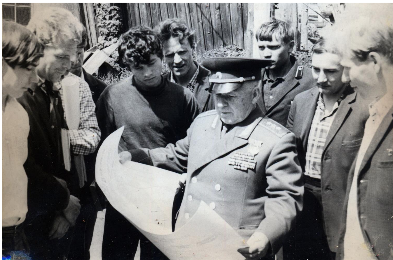
С молодёжью Очёра