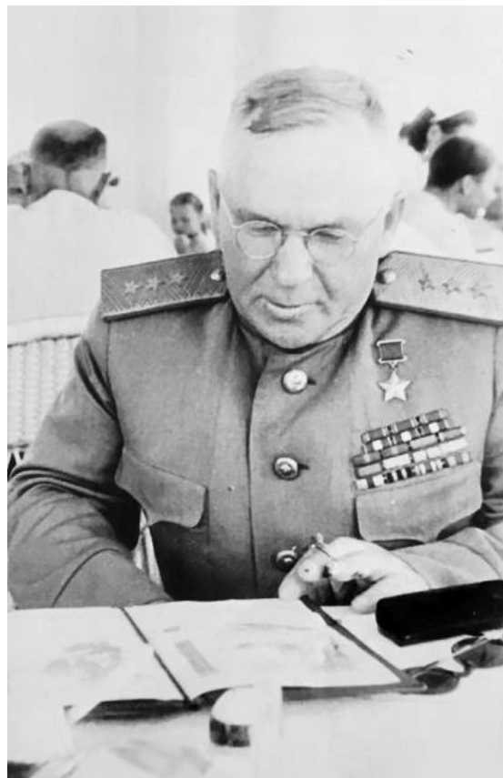
За работой во Всесоюзном совете ветеранов