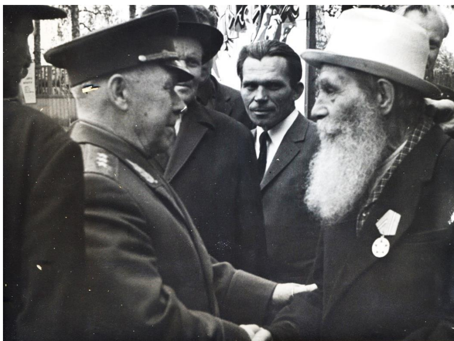
Встреча с ветеранами войны