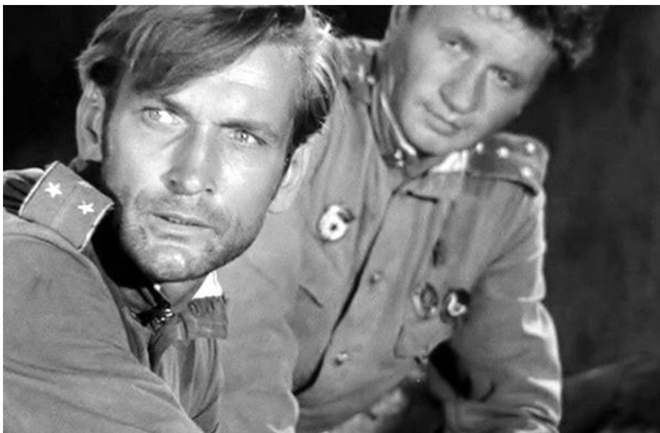
Кадр из к/ф «В бой идут одни "старики"»

«...Имеет место полное единодушие в оценке гвардейских частей, элиты советской истребительной авиации. В этих гвардейских частях были собраны лучшие русские лётчики. Они были настоящим типом истребителя: агрессивны, тактически умны, бесстрашны и летали на лучших самолётах...», – перефразировали слова самого результативного аса Второй Мировой войны Эриха Хартманна американские историки Толивер и Констебль 1 .