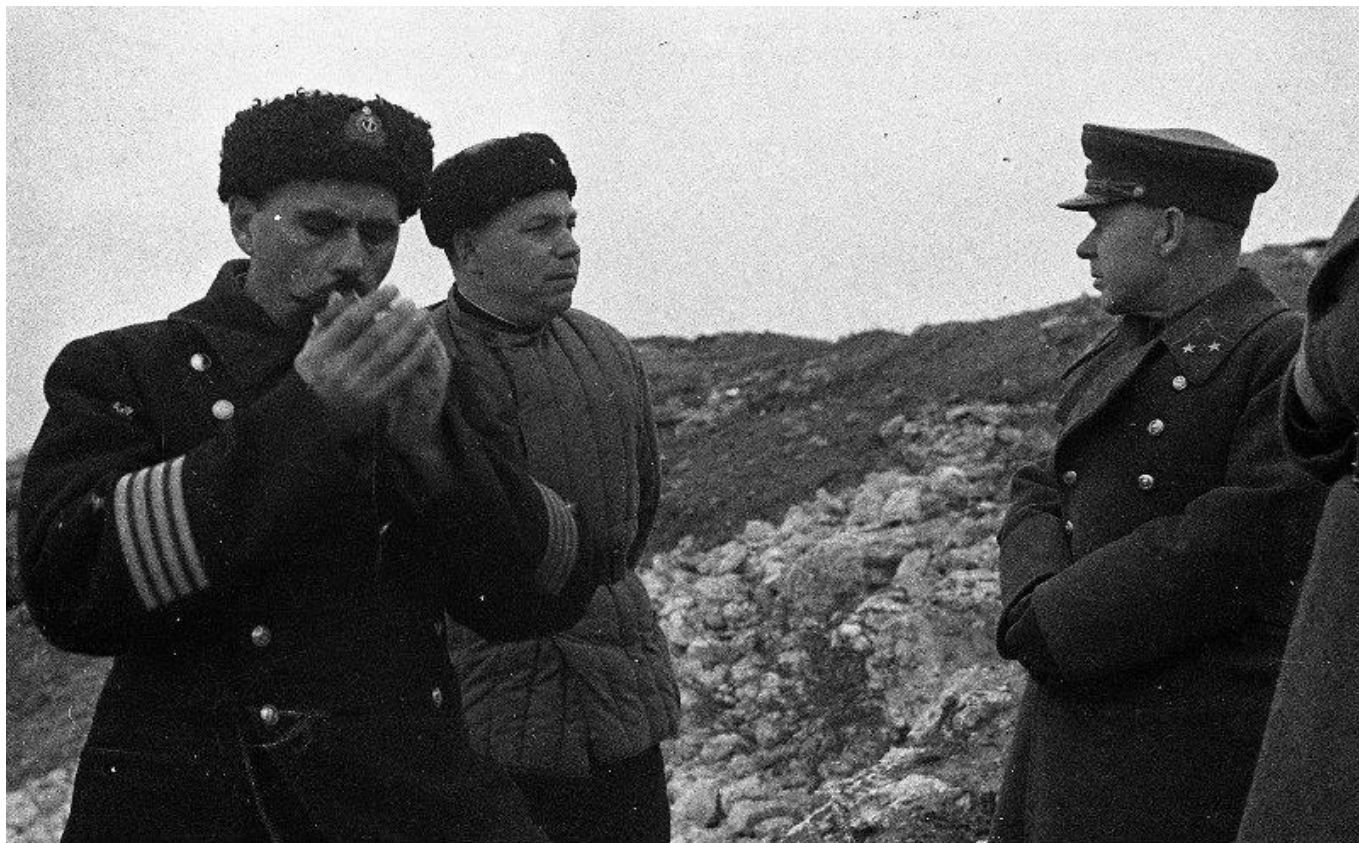
Оборона Севастополя. На знаменитой Сапун-горе.

стояния, разорвались две гранаты. Танк подъехал поближе к траншее, развернулся и остановился.