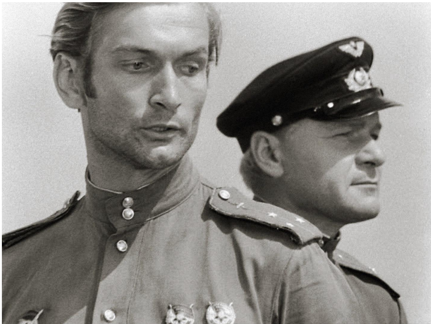
Кадр из фильма «В бой идут одни "старики"»