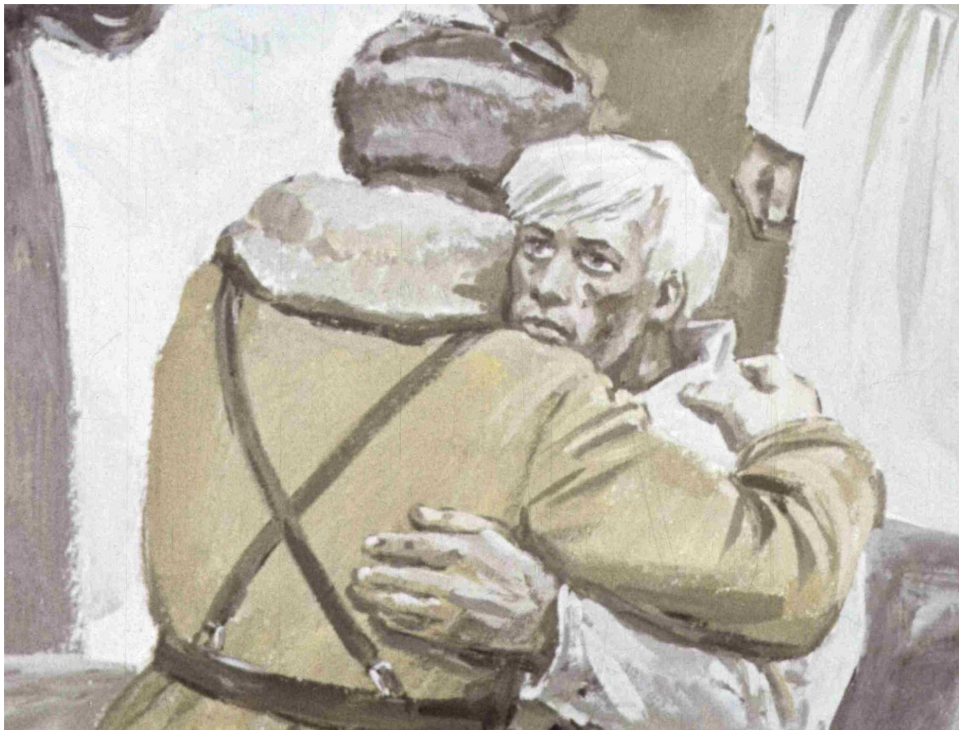
Иллюстрация к поэме К. Симонова «Сын артиллериста». Студия «Диафильм», Госкино СССР, 1977 г.

И ребята тут же разом загалдели, перебивая друг друга: