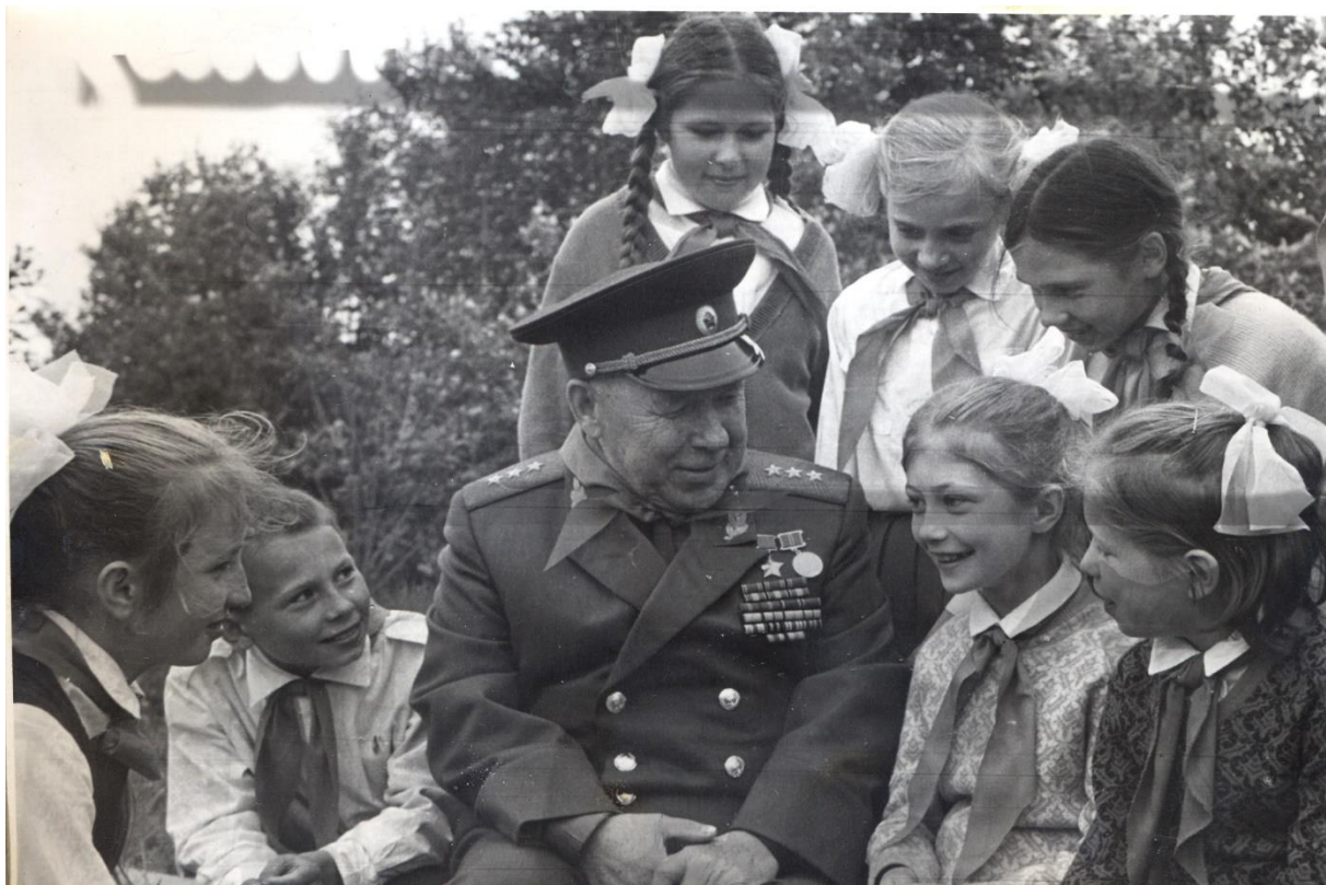
Пионерский лагерь «Звёздочка»