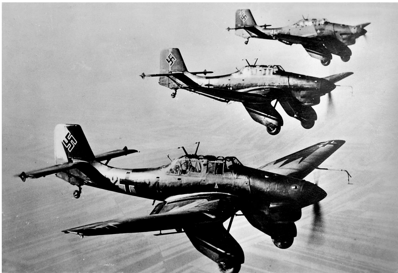
«Лаптёжники» – пикировщики «Юнкерс-87»

– А теперь – к бомберам! Ну, кто тут с полным брюхом? Щас лопнете, гады!