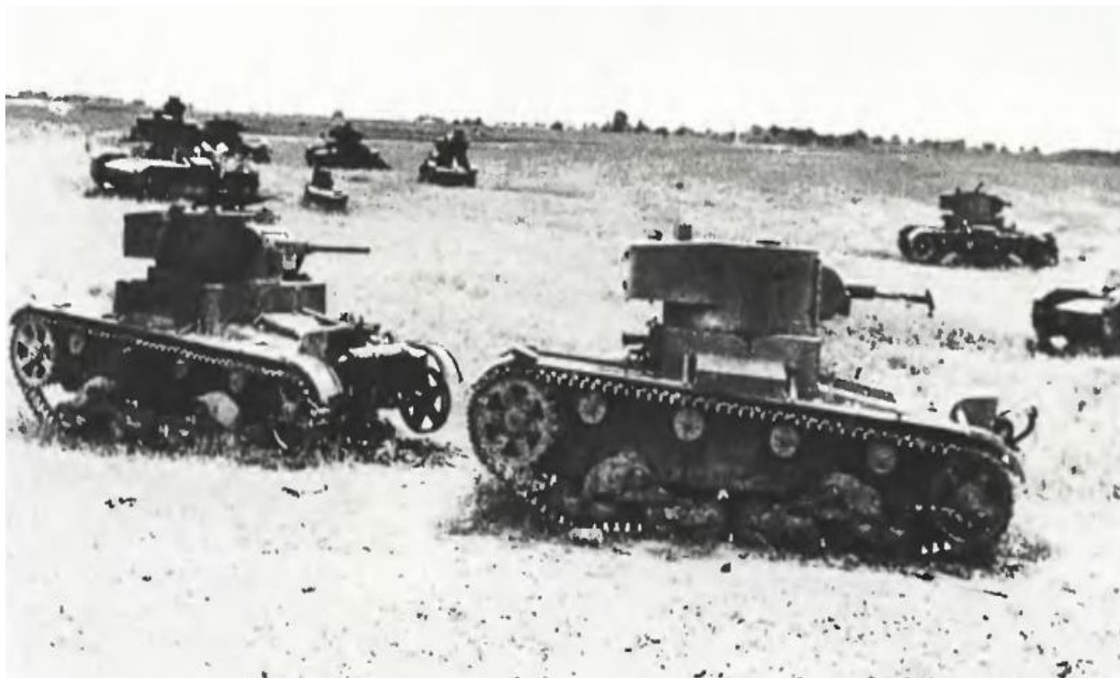
Телеуправляемая танкетка ТТ-27, применявшаяся в 1942 г. в Севастополе