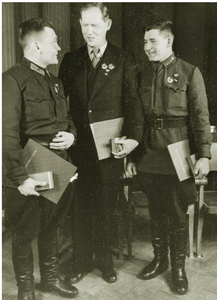
Лауреат Сталинской премии А. Д. Швецов в Кремле с лётчиками, Героями Советского Союза

Сталин и в дальнейшем внимательно следил, как постановление ГКО, касающееся швецовского мотора, претворяется в жизнь. Однажды в кабинете Верховного произошел разговор на повышенных тонах, о котором в своих мемуарах вспоминал бывший замнаркома авиапромышленности Александр Яковлев: