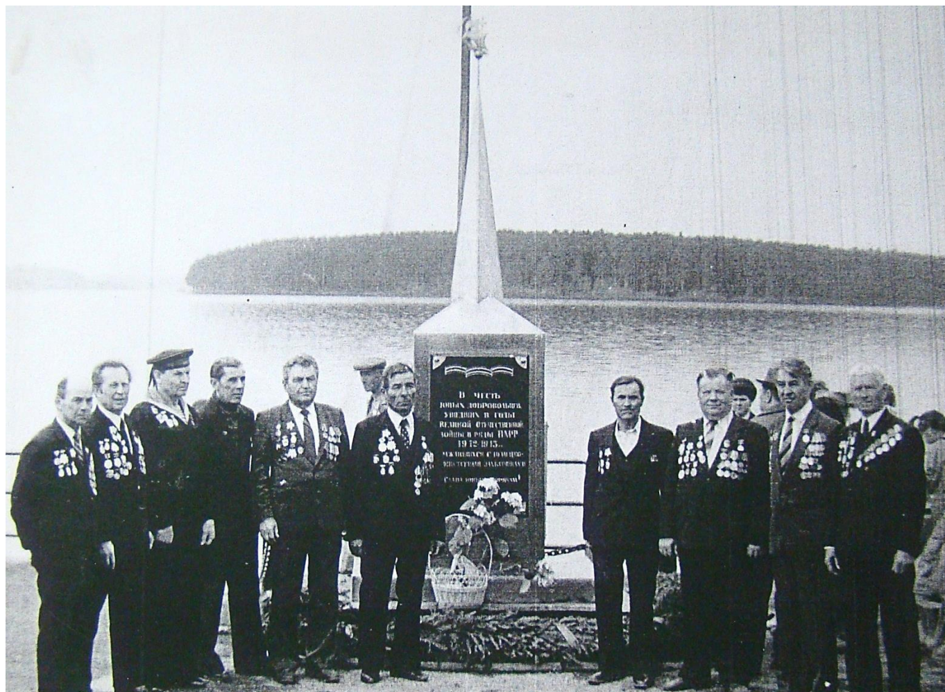
Встреча ветеранов флота у памятника Юнгам ВМФ в Очёре, май 1988 г.