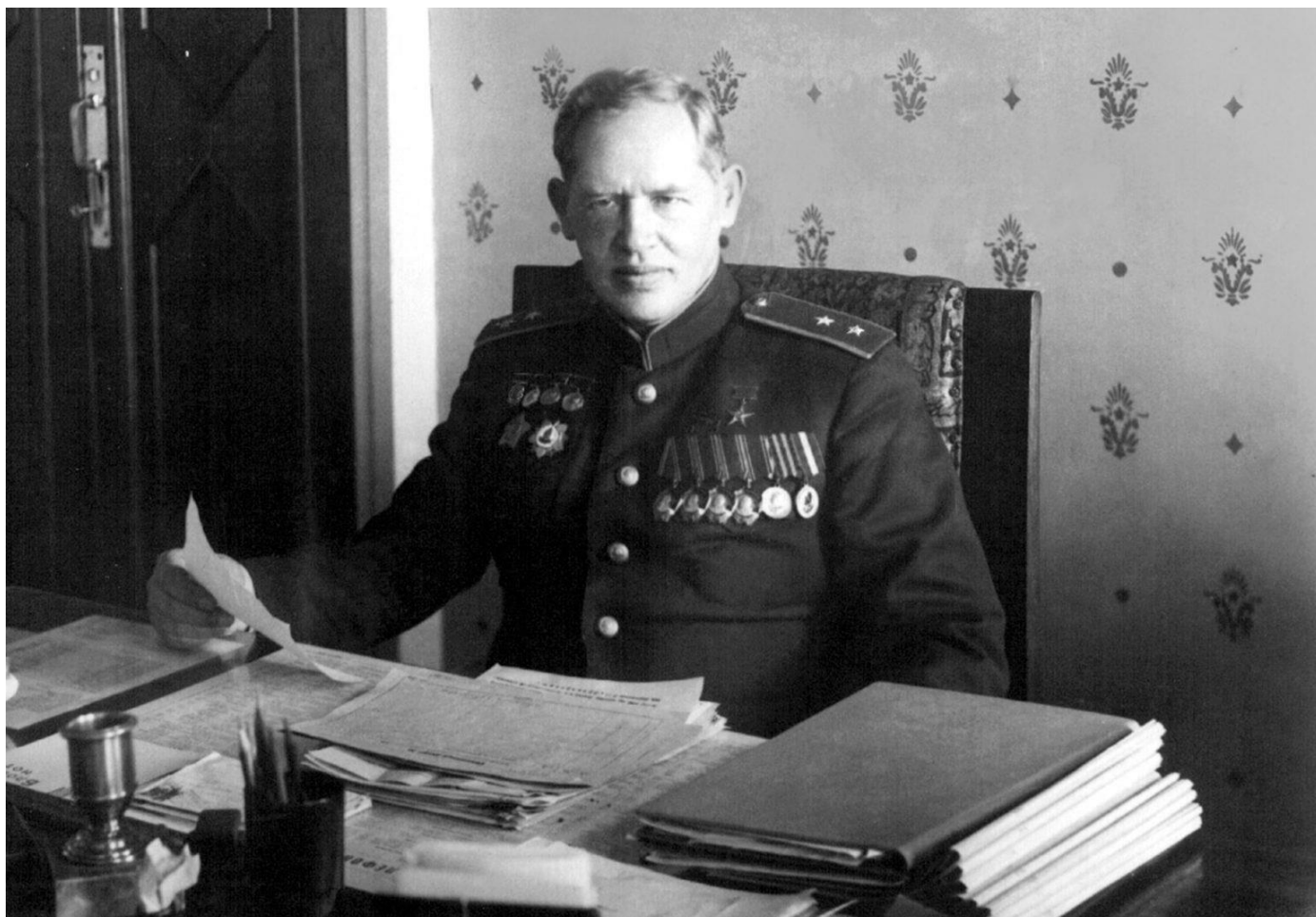
Конструктор А. Д. Швецов за работой