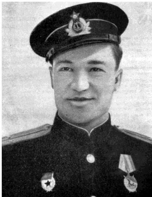
Герой Советского Союза Евгений Францев

Бесстрашный воздушный боец погиб 15 сентября 1944 года вместе с экипажем, как и герой фильма Саша Белобров. Последняя радиограмма от него была короткой: «Атакую! Потопил!» Но