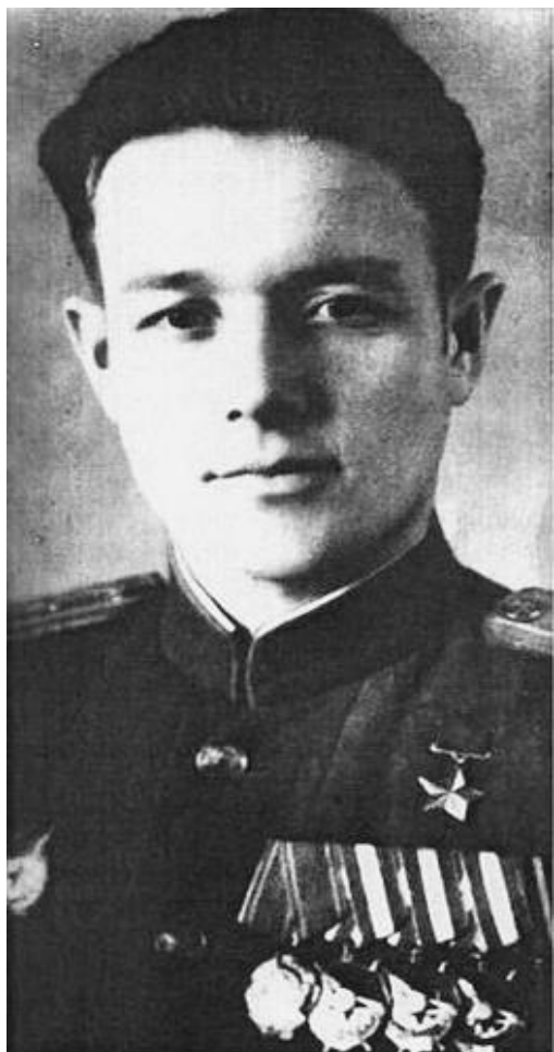
И. А. Шардаков – Герой Советского Союза

– Да какой там Попов! Гляди – это я, – обрисовал пальцем свою физиономию лётчик. – И это – тоже я, – ткнул он в газету. – Могу документики показать!