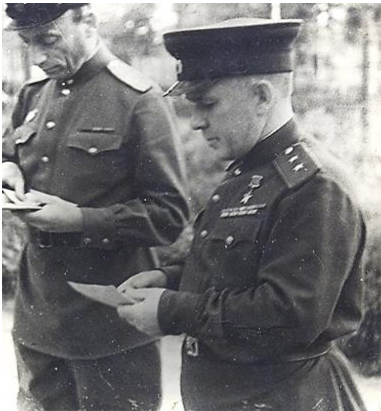
На Волховском фронте