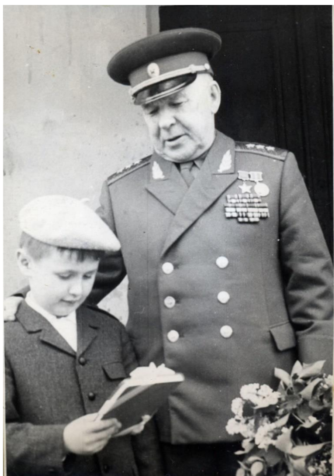
С внуком в Очёре