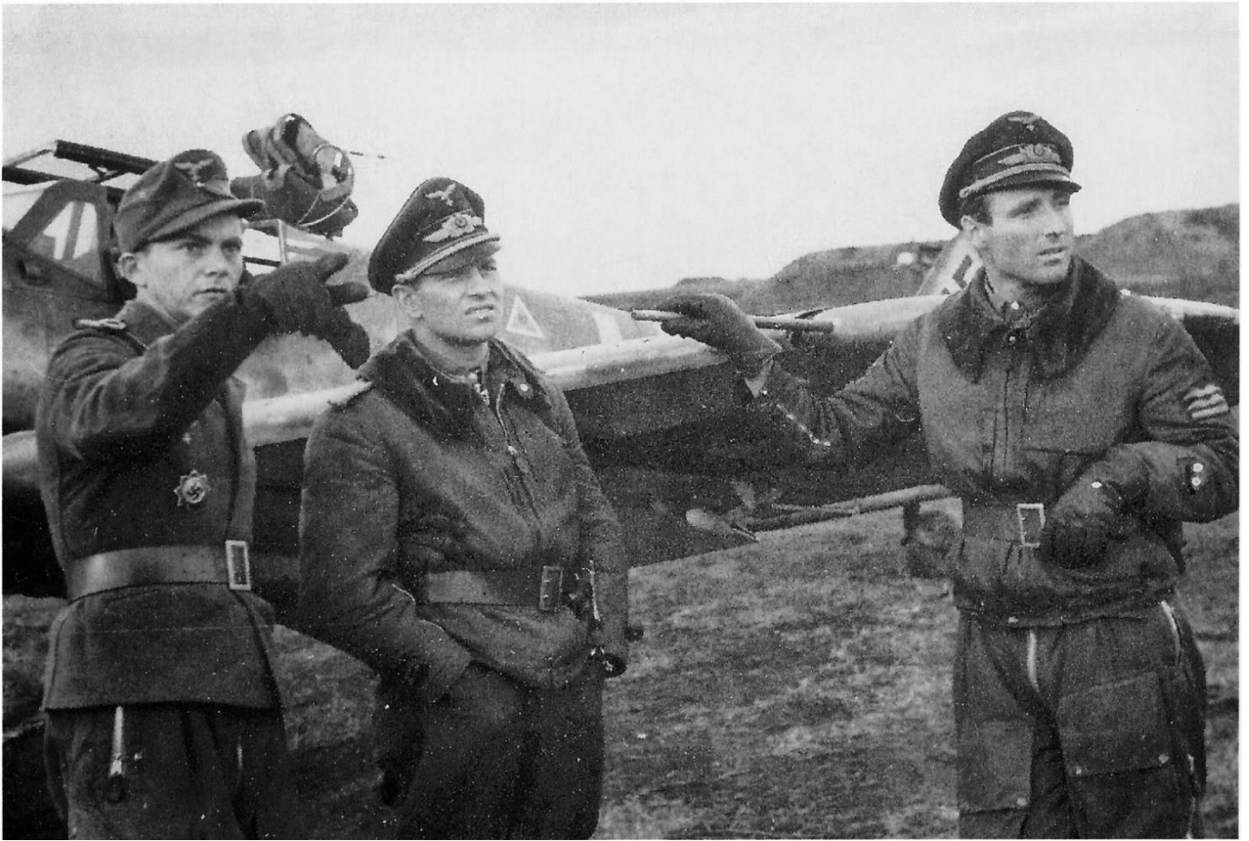
Лейтенант Генрих Штурм, майор Герхард Бархорн, майор Вильгельм Батц – асы люфтваффе, якобы сбившие на троих более 600 советских самолётов.