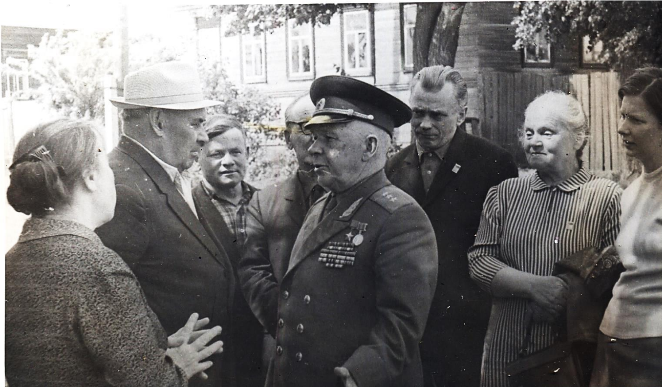
Во дворе редакции газеты «Знамя труда»