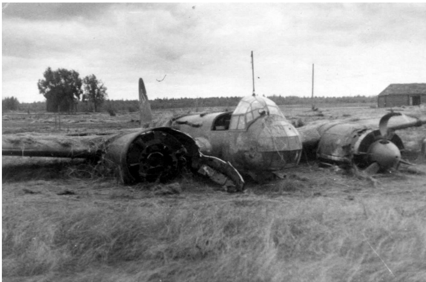
Бомбардировщик Ю-88, сбитый в начале Великой Отечественной войны

этих устаревших машинах можно бить врага. Именно на И-16 ему удалось подбить два бомбардировщика Ю-88, летевших на Москву 1