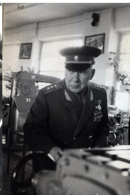
За станком. Мастерские ОИПТ