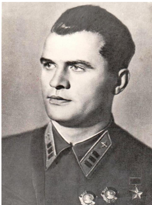
Степан Супрун – создатель истребительных авиаполков ОСНАЗ