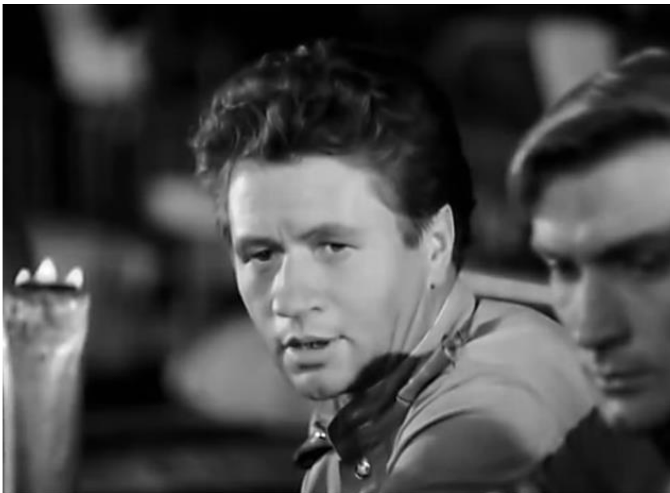
Леонид Быков в роли Маэстро (кадр из к/ф «В бой идут одни "старики"»)

не считаясь с трудностями, год за годом ведут свою большую работу и дают возможность семьям погибших воинов обрести, наконец, успокоение и, главное, место, где можно преклонить колени перед последним приютом мужа, отца, деда и прадеда.