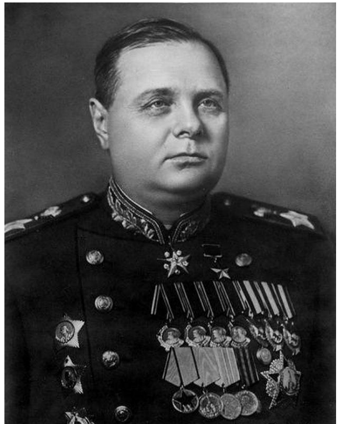
Кирилл Афанасьевич Мерецков, Маршал Советского Союза

После того как Хренов детально и толково объяснил