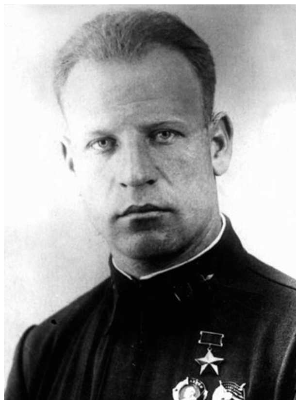
Василий Александрович Зайцев (прототип героя)