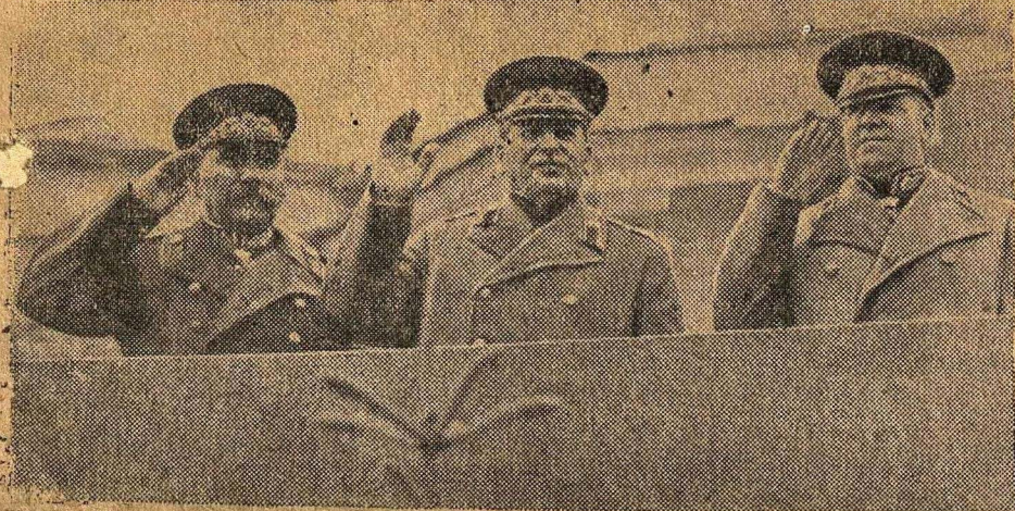
Парад Победы на Красной площади в Москве 24 июня 1945 года. На трибуне Мавзолея Ленина товарищ И. В. Сталин, Маршал Советского Союза Г. К. Жуков и Маршал Советского Союза С. М. Буденный.

вождь советского народа — Генералиссимус Советского Союза товарищ Сталин!