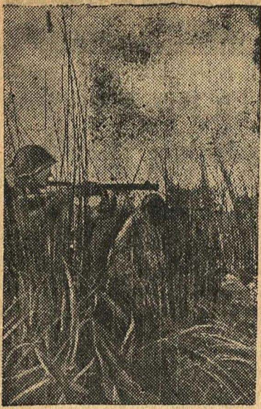
Автоматчики-комсомольцы И. Д. Поддубный и Я. Л. Иминов пробиваются камышами в разведку.