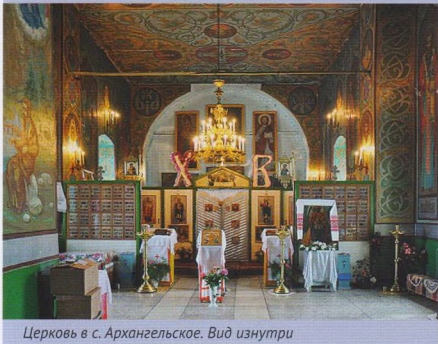
Церковь в с. Архангельское. Вид изнутри

здесь съезжались люди из разных мест, совместными усилиями они пытались создать процветающее общественное хозяйство. Одной из достопримечательностей Коммуны является лиственничная аллея, расположенная на ее центральной улице, по обеим сторонам от которой расположились жилые дома.