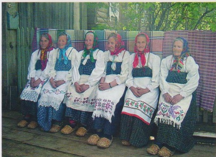
Фольклорный ансамбль «Стариковские самородки»