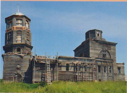
Церковь в с. Курнос