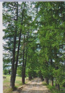
Лиственничная аллея в д. Коммуна

в условиях избыточного увлажнения и затрудненного доступа воздуха. Сегодня разведано и используется 30 месторождений торфа. Из торфа с использованием современных технологий можно получать более 100 видов продукции при практически безотходной переработке запасов месторождений (термоизоляционные и строительные материалы, сельскохозяйственные удобрения и т.д.).