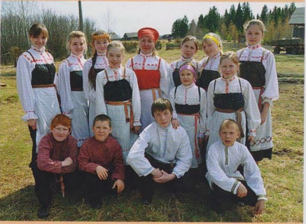
Ансамбль «Пöлянок», с. Архангельское