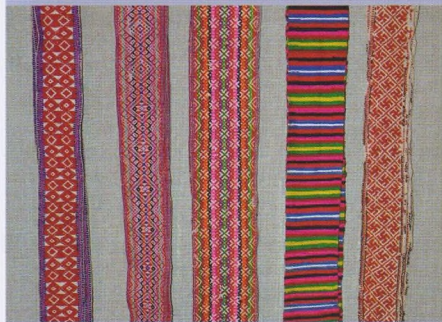
Пояски с национальным узором

Крохалево можно увидеть старую деревянную часовню, в Антипино храм, восстановленный в последние годы, в деревнях Федорово и Стариково встретиться с удивительными фольклорными ансамблями, в репертуаре которых старинные песни юсвинской земли.