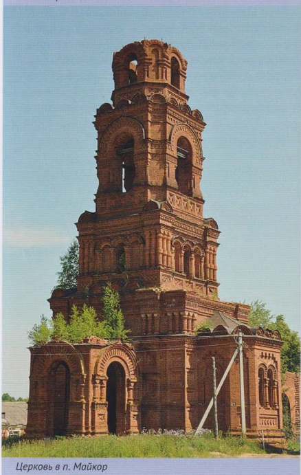
Церковь в п. Майкор

было предостаточно. С вводом доменной печи и электростанции завод стал производить шинное и полосовое железо, а в 1914 г.—сталь для снарядов.