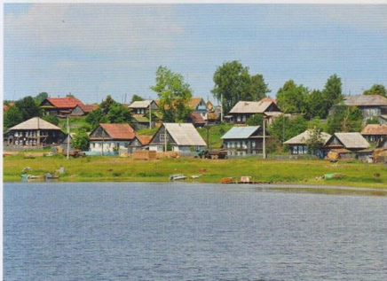
Вид на п. Пожева