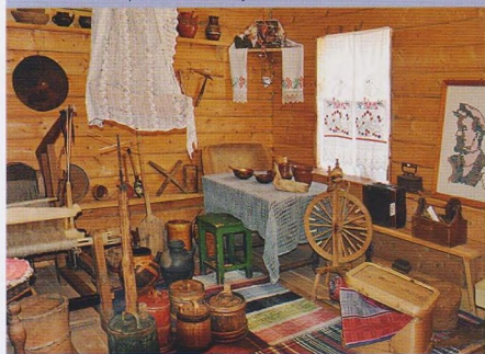
Экспозиция Юсвинского краеведческого музея