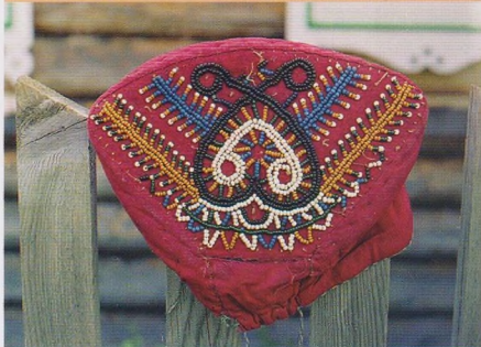
Шамшура—коми-пермяцкий женский головной убор