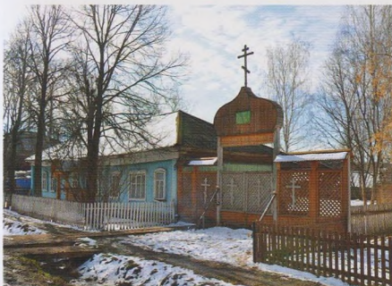
Церковь в с. Юсьва