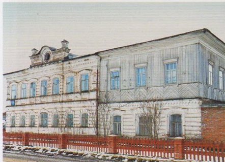
Юсвинский краеведческий музей