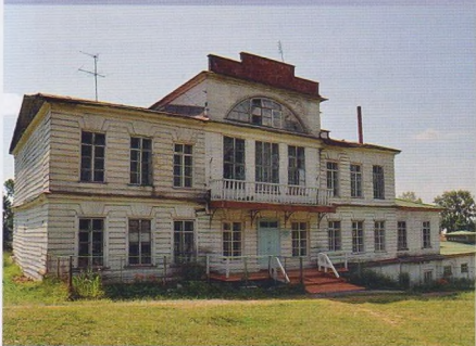
Дом заводладельцев, п. Пожва