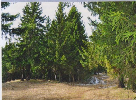
Лес в окрестностях с. Архангельское