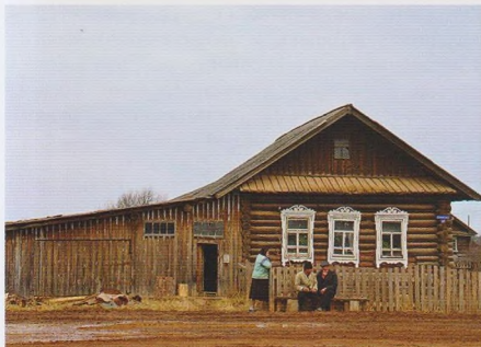
Дом в с. Архангельском