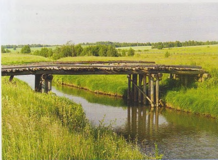
Мост через р. Истер у д. Андроново