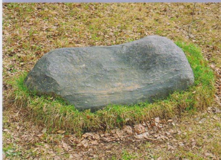
Камень в церковной ограде с. Архангельское