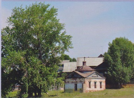
Церковь в п. Майкор