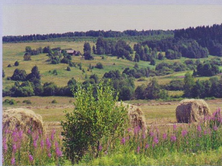
Сенокосные луга Юсьвинского района