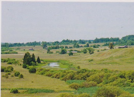
Природа вблизи с. Курнос