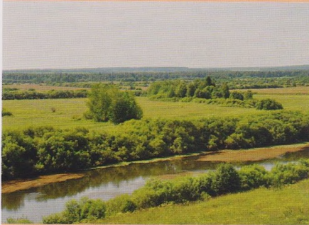
Природа Юсьвинского района

Очевидно, что история Туманского городища, возникшего в X–XIII вв., не прерывается и в дальнейшем. Об этом свидетельствуют первая перепись Перми Великой 1579 г., где упоминается «деревня Туманская на городище», и писцовая книга М. Кайсарова 1623 г., в которой деревню Туманскую уже называют «деревней Майкор на реке Иньве».