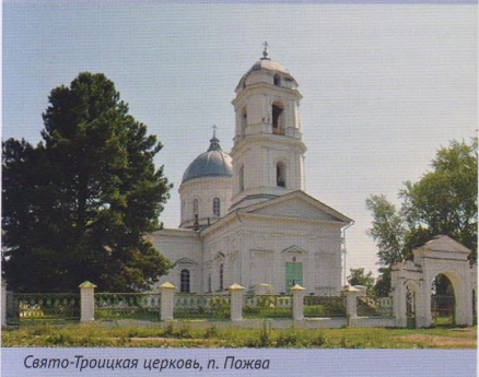
Свято-Троицкая церковь, п. Пожва

тивного назначения. Большая часть этих зданий была перенесена на заранее распланированный участок, образовав новый микрорайон. От большого завода в поселке Пожва, занимавшего 3 гектара, остались лишь кирпичная труба, корпус бывшей мартовской фабрики, где была доменная печь (нынешний Дом культуры), и заводская плотина, которая в свое время была выдающимся сооружением на Урале (длина ее составляет 1320 м).