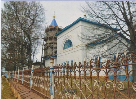
Церковь в с. Архангельское