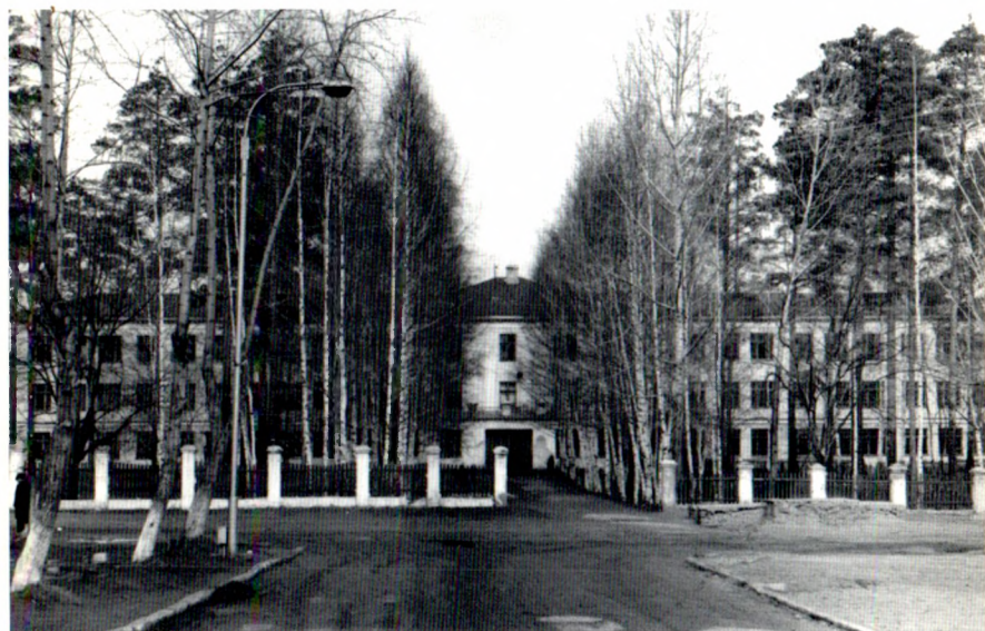
Здание военного госпиталя, ныне школа № 8