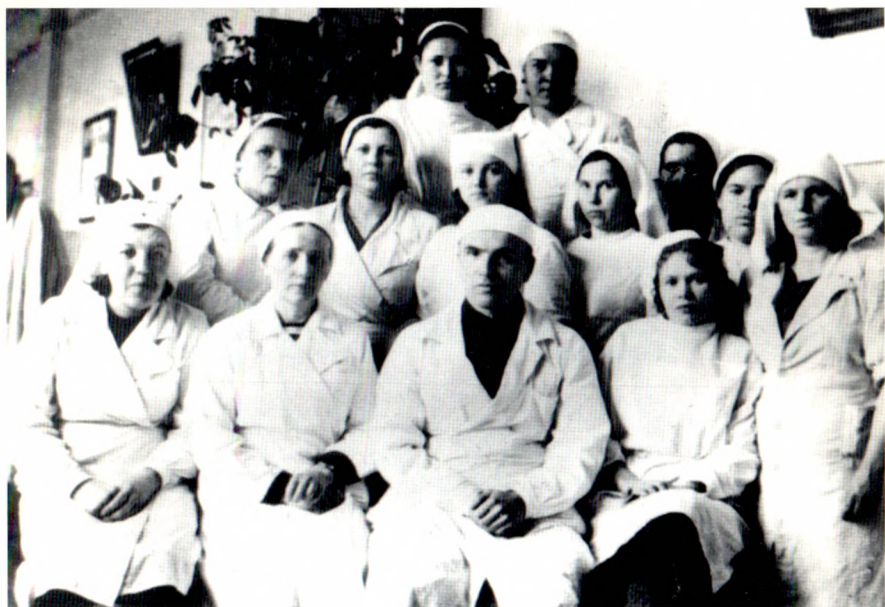
Коллектив госпиталя, фото 40-х годов