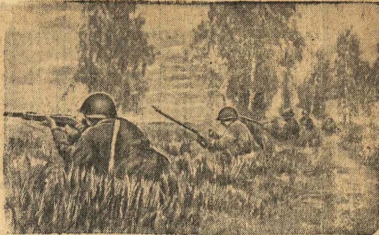
Действующая Армия Бойцы ведут огонь по вражеским огневым точкам. (Кадр из Совкиножурнала). Фотохроника ТАСС.